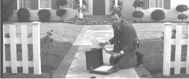
Abbildung 3: »American Beauty«. Lester hat aus Versehen seinen Aktenkoffer fallen lassen

nimmt, bildet sie in diesem Moment eine weibliche Front. Die blickt nach vorne und hat offenbar ein Ziel oder wenigstens eine Perspektive. Lester wird im Gegenzug auf die Rückbank verwiesen. Beide Frauen verachten ihn.