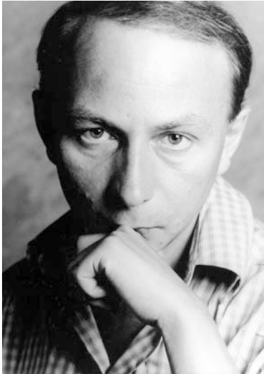
Abbildung 13: Michel Houellebecq

Michel Houellebecq? Ach ja. Frankreichs Literaturstar. Der Provokateur. Befürworter der Eugenik. Der Mensch als fehlkonstruierte Triebmaschine. Schamlippenbeschreiber. Dauerständer. Sitzt in einem Agglo-Wohnsilo. Startt auf Heizungsradiatoren. Kaut Tiefkühlmenüs. Holt sich einen runter. Keine Liebe, kein Glück, nicht einmal Leid. Psychiatrie oder Selbstmord? Egal. C'est la tristesse, mes amis.