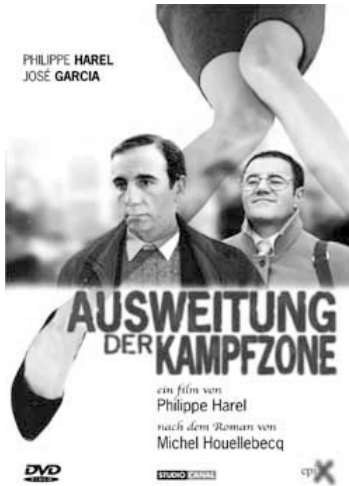
Abbildung 14: Filmplakat.