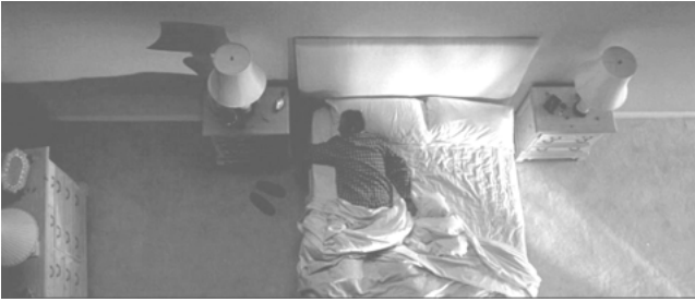
Abbildung 1: »American Beauty«. Lester Burnham allein in seinem Bett. Nur die Pantoffeln warten auf ihn.

lebendigen Lester Burnham und Vater von Jane, wiederum von oben: Im karierten Pyjama liegt Lester auf dem Bauch in einem Ehebett und schläft. Neben ihm findet sich eine zweite bereits zurückgeschlagene Bettdecke; der Platz an seiner Seite ist leer; dabei ist es früh am Morgen, doch seine Frau scheint bereits aufgestanden zu sein. Jetzt klingelt der Wecker auf seiner Seite – und die Geschichte beginnt: Lester schält sich mühsam aus dem Bett, die an der Längsseite des Bettes positionierten Pantoffeln warten schon auf ihn. Die Kamera folgt dem schlurfenden und gähnenden Mann unter die Dusche. Sie zeigt ihn hinter der milchigen Duschkabinentür, das heiße Wasser genießend, mit unschwer dechiffrierbaren Handbewegungen in der Leistengegend. »Look at me. Jerking off in the shower. This will be the high point of my day. It's all downhill from here.«