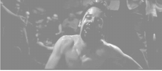
Abbildung 9: »Fight Club«: Glücklich im Schmerz.

Auffällig ist, dass die Kampf-Clubs ihren Mitgliedern eine strenge Disziplin abverlangen. 15 Damit wird ein Paradox installiert und ein Hinweis auf die Ambivalenz der Kampfvereine gegeben: Auf der einen Seite steht die Entfesselung, die Entmoralisierung und die Freiheit durch das Ausleben einer orgiastischen Aggression. Auf der anderen Seite: der strikt zu befolgende Regelkatalog. Nur wer sich dem Reglement bedingungslos unterwirft, darf Mitglied der von Tyler und Jack betriebenen »Unterwelt« werden. Die erneut verlangte Unterwerfung wird dabei mit einem verlockenden Angebot verknüpft: Die verletzte Seele erhält einen verletzten Körper. Und damit wären wir wieder beim Schmerz als unerlässlich erachteten Indikator. Der Kampf mitsamt dem hysterischen, an Erweckungskirchen erinnernden Gebrüll 16 der Zuschauenden macht die Misere des Mannes fassbar. Der alltägliche Existenzkampf wird in einen nach klaren Regeln aufgebauten und damit sowohl verständlichen als auch beeinflussbaren Überlebenskampf übersetzt. Der empfindsame Körper, der Kampf, der Schrei, der Schmerz werden den täglich praktizierten und in die Unsichtbarkeit normalisierten Unterwerfungsgesten entgegengesetzt und verleihen dem diffusen Leiden eine Sprache. Das ist der Gewinn, den die physische Brutalität verspricht: Während die Schläge der Dienstleistungsgesellschaft dem kleinen Mann nachhaltige inwendige Verletzungen beibringen, sind die im Fight Club errungenen Blessu-