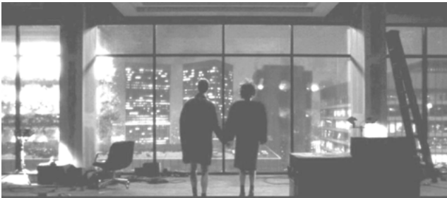
Abbildung 12: »Fight Club«: Jack und Marla beobachten den Zusammenbruch ihrer Welt

Im Abspann wird erneut für eine Millisekunde ein erigiertes männliches Glied eingeblendet. Wir erinnern uns: Das war eine der Guerilla-Taktiken des Tyler Durden, um das bourgeoise Publikum ein wenig aufzuschrecken. Sie gilt nun unmittelbar der ZuschauerIn.