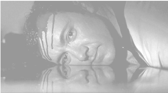
Abbildung 6: »American Beauty«: Lester wird in seiner Küche erschossen.

So ist es kein Zufall, dass er in der Küche, einem weiblich konnotierten Ort, von hinten erschossen wird. Er hatte keine Chance, sich zu wehren. Statt eines Helden-Todes stirbt er einen vermeidbaren, herbeigeführt durch die Hand eines verbissenen Vietnam-Veterans, der seinerseits die Schmach seiner Zurückweisung und seines Outings rächen und wohl vor allem auslöschen will. Und wie immer die falschen Mittel wählt. Carolyn betritt im Moment des Schusses das Haus und bricht in der Waschküche, die frisch gewaschenen Hemden Lesters umarmend, zusammen. War sie noch kurz zuvor selbst bereit, Lester zu erschießen, ja fast tranceartig lief sie durch den strömenden Regen im roten enganliegenden Kleid, erschrickt sie beim Betreten des Hauses offenbar über sich selbst und erliegt endlich ihrer Hysterie. Sie wirft die Handtasche samt Pistole in den Trog für benutzte Wäsche und – noch immer im Bann von Ersatz-Objekten, also ganz Hausfrau – umarmt sie weinend, ja lang gezogene Klagelaute ausstoßend, an Lester statt seine frisch gewaschenen Oberhemden. Das ist ihre Liebeserklärung an ihren Mann. Sie sinkt in die Knie. Und dennoch. Trotz ihrer endlich eingestandenen Liebe, ist sie ihm keinerlei Hilfe. Er stirbt allein.