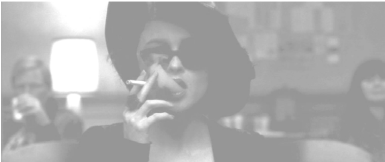
Abbildung 11: »Fight Club«: Marla – die große Widersacherin von Jack.

Die Feststellung, dass Jacks Identitätsprobleme und seine Aggression gegen die amerikanische Zivilgesellschaft ursächlich mit Marla, also einer Frau, zusammenhängen sollen, steht am Anfang und Ende des Films und weist mithin der Frau eine Schlüsselrolle im Rahmen der maskulinen Gewalteskalierung zu. Gleichwohl existiert in dem gesamten Film nur eine bemerkenswerte Frauenfigur. Ansonsten interagieren Männer ausschließlich mit Männern. Begründet wird der Überdruß am weiblichen Geschlecht mit einer schmerzlichen Kindheitserfahrung: Es fehlten positive Vaterfiguren. »We're a generation of men raised by women. I'm wondering if another woman is really the answer we need.« 44 Die Familien mit alleinerziehenden Müttern und/oder den in die Arbeitswelt entschwundenen Vätern 45 werden damit für die gegenwärtige