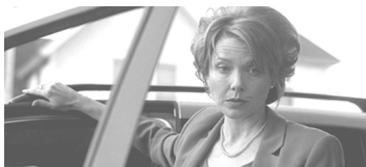
Abbildung 2: »American Beauty«. Carolyn findet ihren ungeschickten Mann unerträglich

Die Einstellung, in der eine Person durch das Fenster auf das Leben draußen blickt, wobei sie zur Hälfte hinter der Gardine Deckung nimmt, ist ein Motiv, das man etwa von Caspar David Friedrich, Virginia Woolf oder auch von zahlreichen früheren Hollywoodfilmen kennt. Es kennzeichnet gemeinhin Frauen als unglückliche, an Haus sowie Ehemann gefesselte und damit heillos in die Konventionen verstrickte Hausfrauen. Diese Darstellung von Lester als in diesem Sinne verweiblicht hatte bereits in der Duschszene einen Vorläufer.