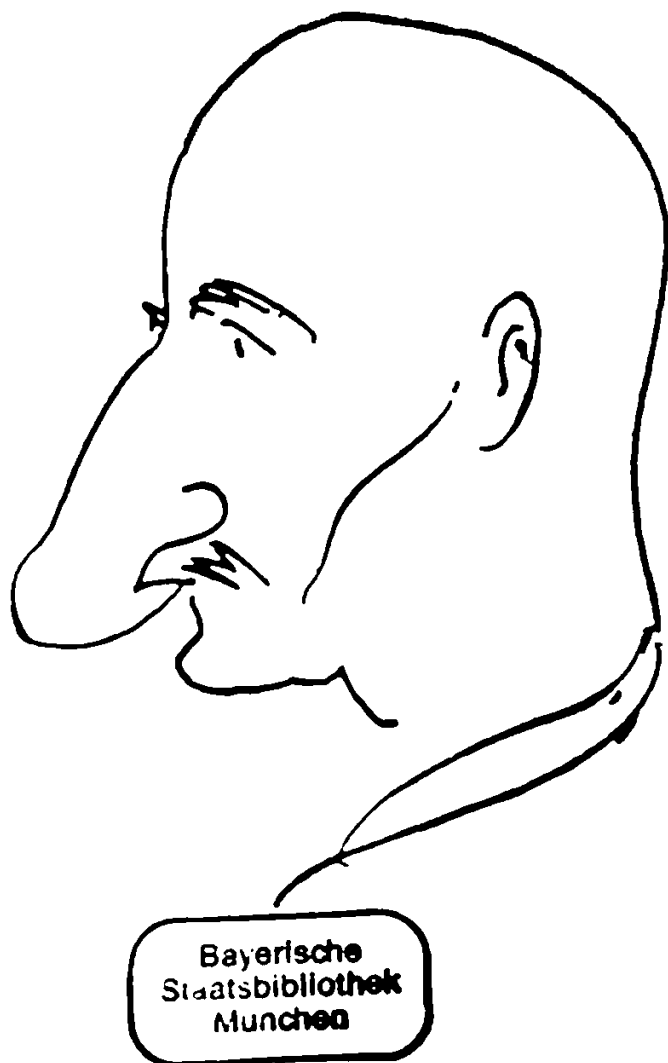
Ян Сатуновский. Автошарж. 1966 год.