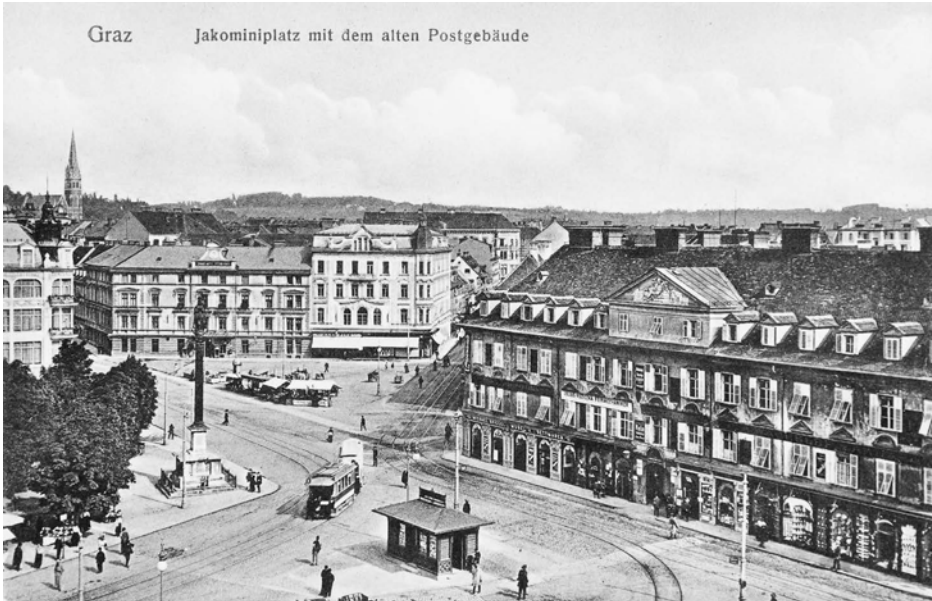
III Jakominiplatz in Richtung Osten, 1914