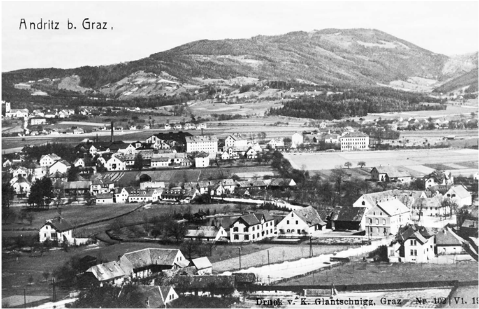
XIII Der Grazer „Vorort“ Andritz, 1917