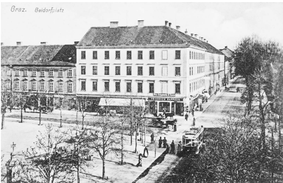
IV Geidorfplatz mit der „roten Tram“ auf dem Glacis, 1914