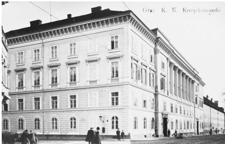
II Korpskommando an der Ecke Glacis/Elisabethstraße, 1912