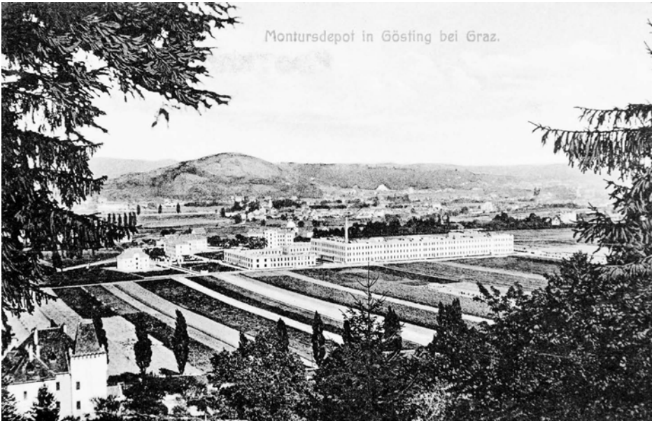
XII Montur-Depot in Gösting, 1909