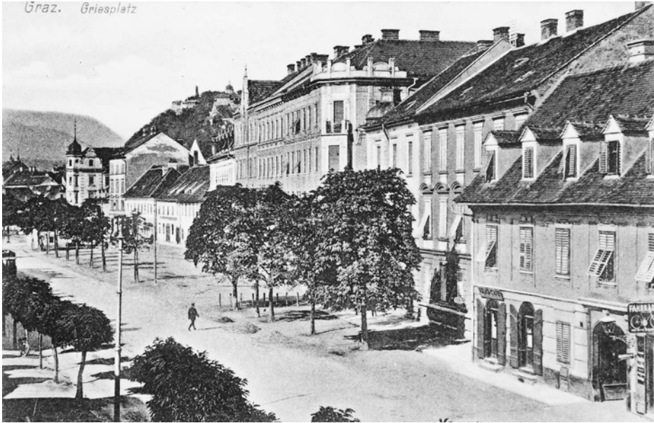
V Griesplatz, 1914