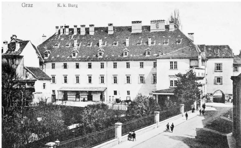
I Grazer Burg in der Hofgasse, 1914