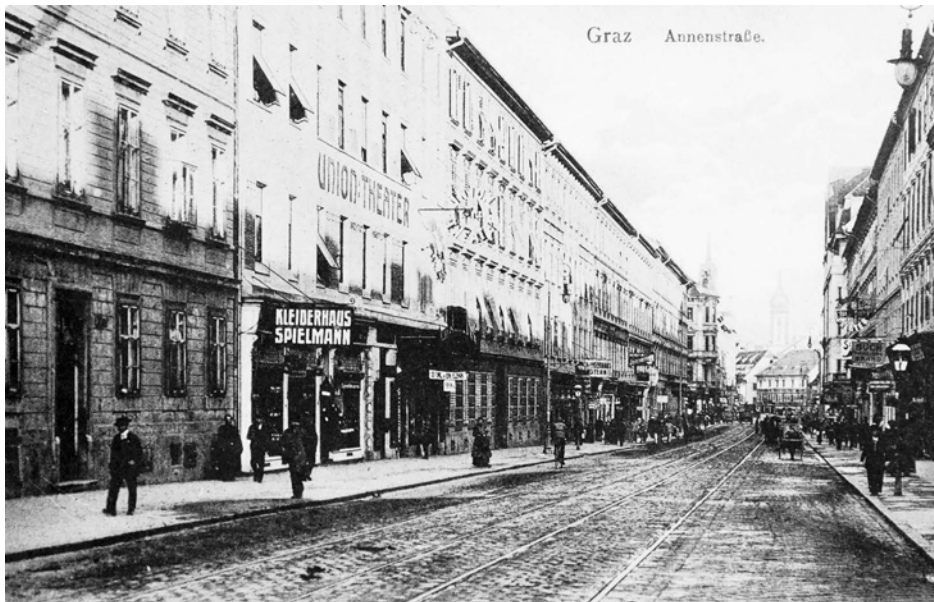
X Kino und Kleiderhaus in der Annenstraße, Richtung Murplatz (heute: Südtirolerplatz), 1918