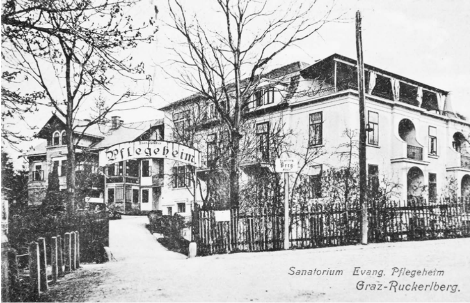
XI Evangelisches Pflegeheim am Ruckerlberg, 1917