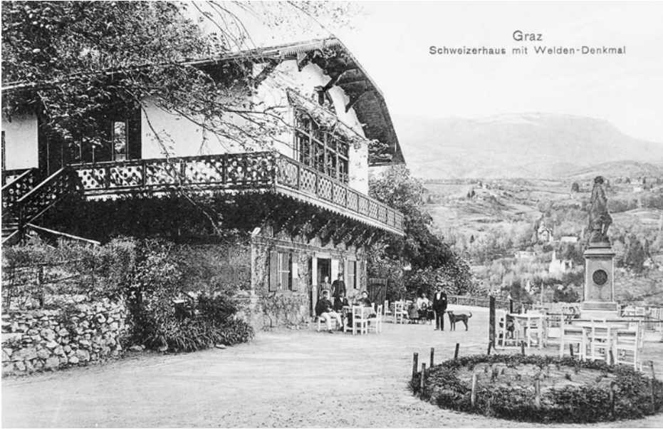
VII Schweizerhaus am Schlossberg mit Welden-Denkmal, 1913–1914