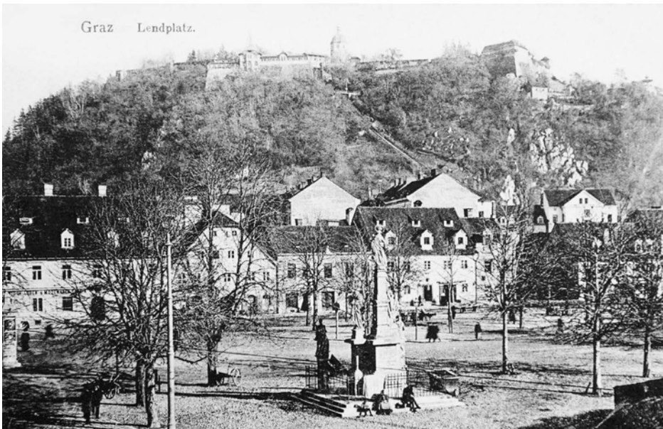
VI Lendplatz mit der Pest- bzw. Mariensäule, 1918