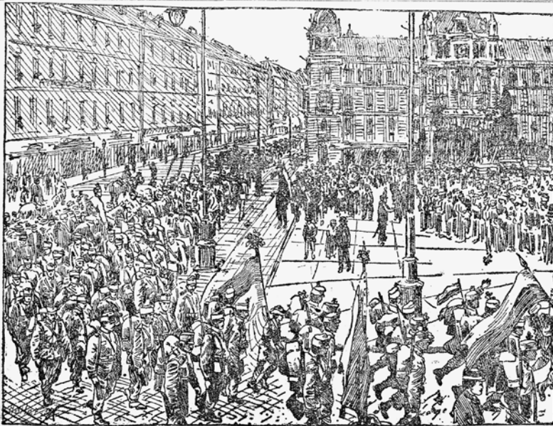
Aus bewegten Tagen — ein Bild ohne Worte.

Kriegserklärung Montenegros an Deutschland. — Deutschland erweist sich stark und mächtig.