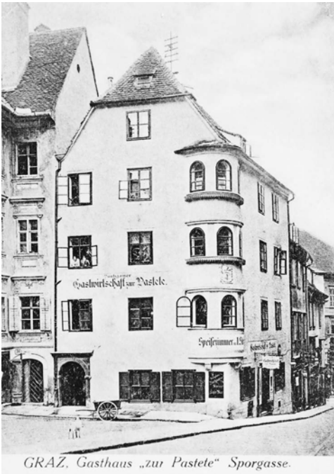
VIII Gasthaus „zur Pastete“ in der Sporgasse, ca. 1910–1915