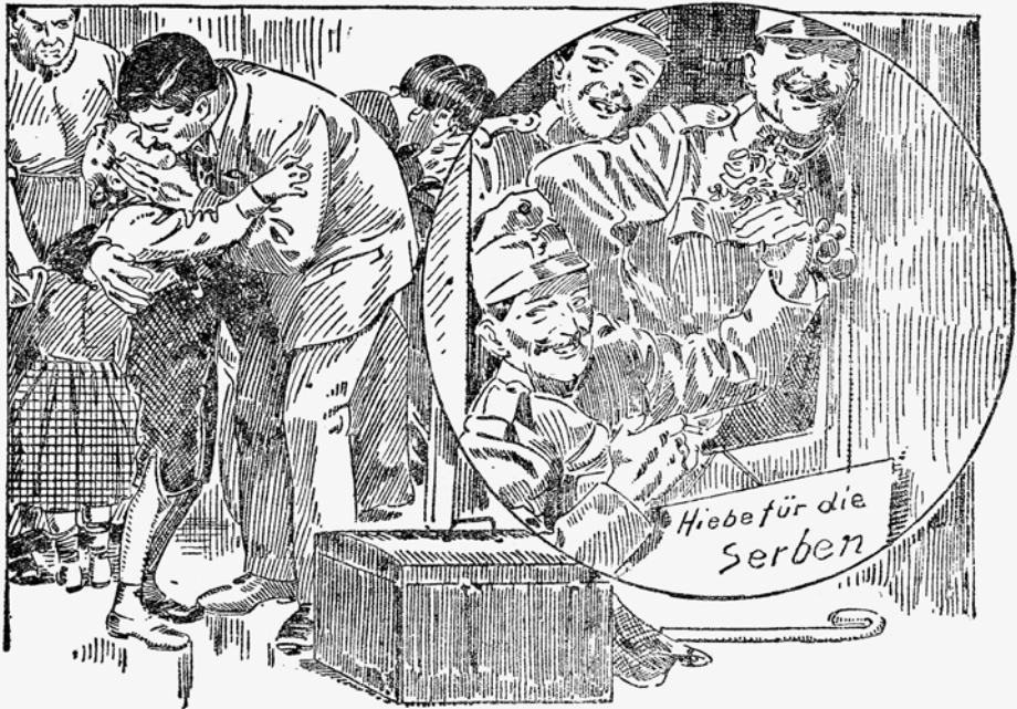
Abb. 3 Hiebe für die Serben, in: Kleine Zeitung, 29.7.1914, 9.