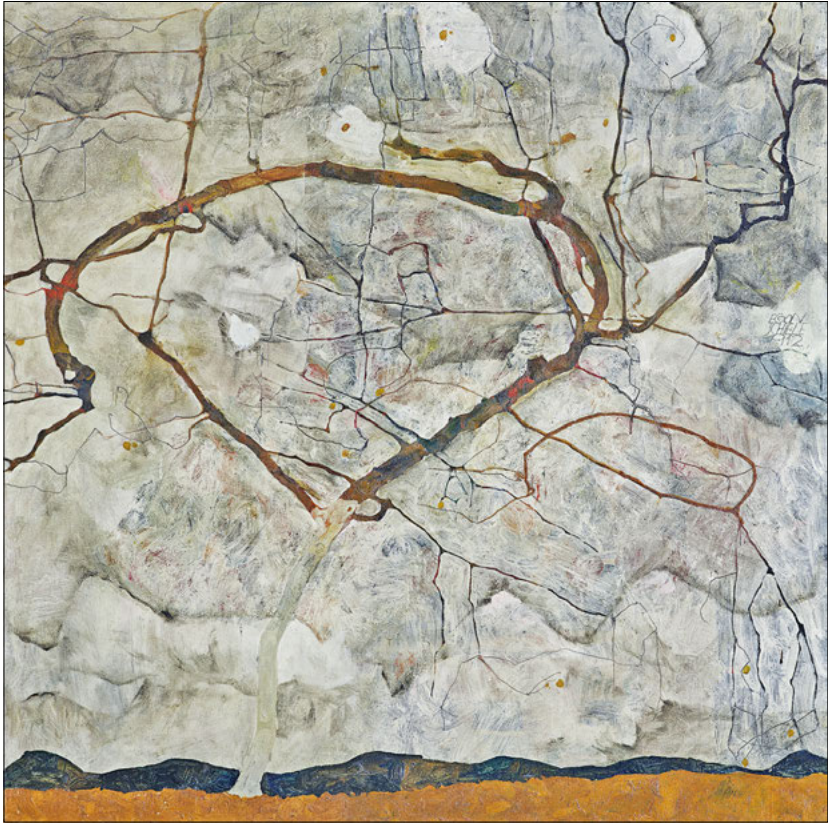
Egon Schiele, Herbstbaum in bewegter Luft (»Winterbaum«), 1912 Leopold Museum, Wien