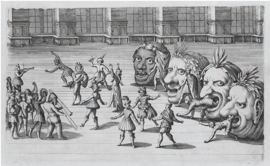
Abbildung 1: Vier übergrosse gebildete Menschenköpfe sog. „4 grosse Weltköpfe“ die Nationen mit ihren Landtrachten und gebräuchlichen Spihlleuten hervorbringend [Kopf-Ballett], Stuttgart 1616. SLUB / Deutsche Fotothek, Inv.-Nr.: Hist.Suev. 44,2. Foto: Ramona Ahlers-Bergner

Il y a des airs allemands, italiens, espagnols, français etc. Les Provinces mêmes ont la plupart des danses particulières. Ce n'est pas une des moindres beautés des ballets que cette diversité, quand on représente les peuples et les nations les plus barbares qui dansent à la manière de leur pays. 15