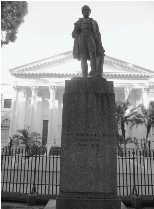
Figure 2: Statue of Sir George Grey in front of the National Library of South Africa, Cape Town, 2012

British imperialism and Apartheid. 53 All see the different races as various developmental stages of civilisation, and argue that the more civilised nations must assume guardianship for indigenous people. How to deal with the European inheritance in the underlying idea of the collection in a postcolonial context, is a question as yet unresolved.