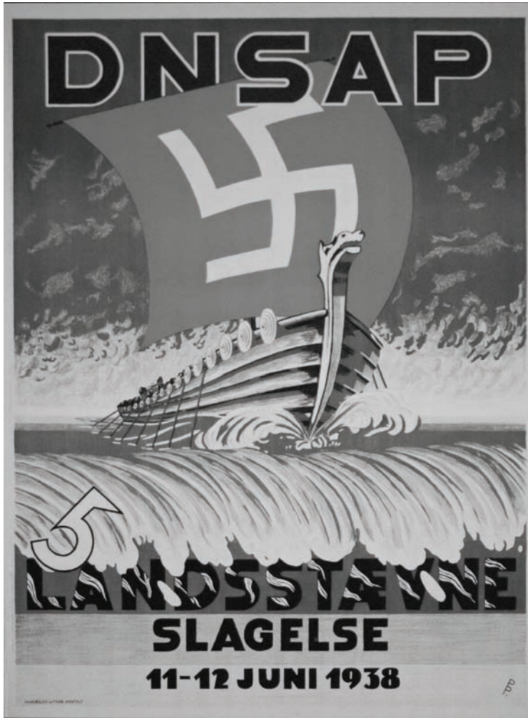
Abbildung 1: Plakat der DNSAP zum 5. Landestreffen der Partei in Slagelse, 1938

nen Krieg 1864 gegen Preußen besonders deutschfeindlich eingestellt. Dies potenzierte sich im Hinblick auf die Deutschen als Besatzungsmacht.