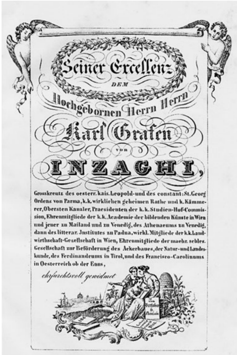
Domenico Ponisio, Die italienische Sprache, nach einer ganz neuen, leicht fasslichen, durch eigene, sechzehnjährige Erfahrung erprobten Methode, Wien, Schaumburg, 2 1846. Widmung an Karl Graf von Inzaghi (Autor)