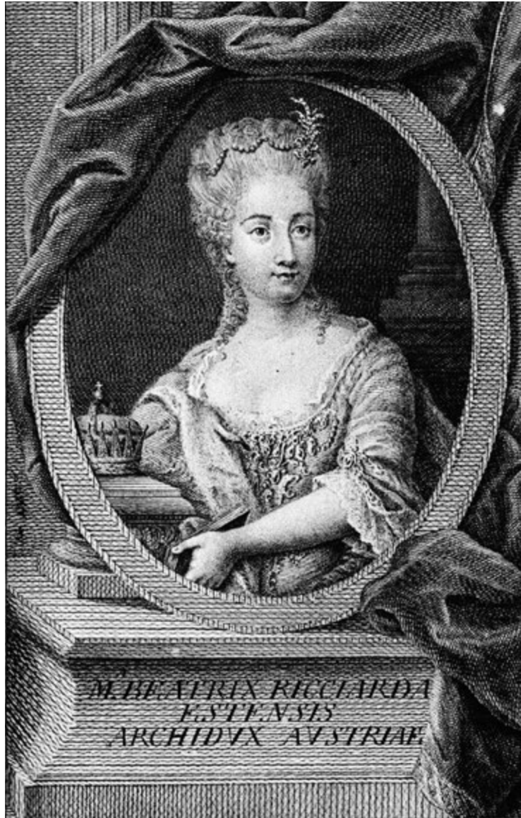
Maria Beatrice d'Este (1750–1829), Erzherzogin von Österreich