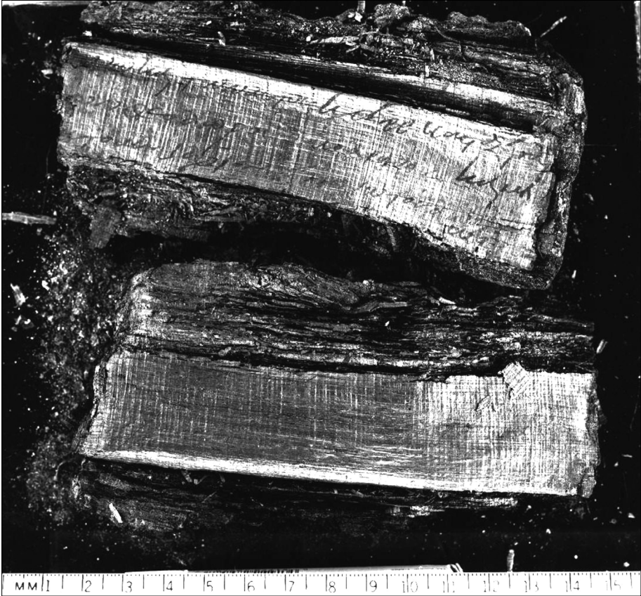
Fig. 2. The papyrus roll cut horizontally at the beginning of conservation. The part of the roll contains the ends of lines 472–74 of P. Petra IV 39 (after P. Petra IV , fig. 2).

of whole lines. On the other hand, the outermost part of the roll is very badly damaged.