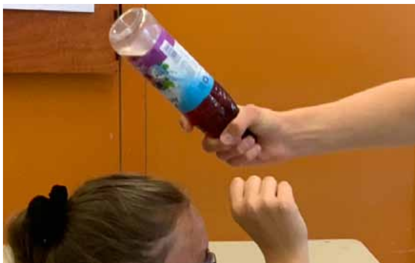
III. 9 Image figée de l'homme mort dans le métro bondé à cause d'une bouteille de vin rouge, illustration propre