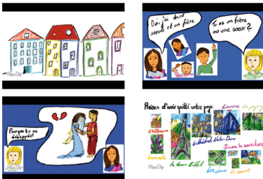
III. 4-8 Extraits de la BD animée de Svenja Hauff, élève de 15 ans à la Real-schule à Bobingen