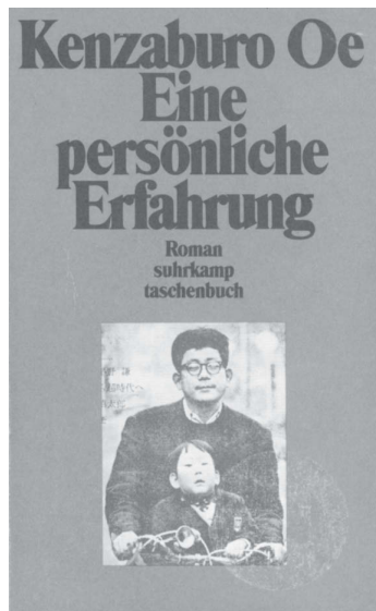
Umschlagfoto »Eine persönliche Erfahrung«

Der Roman »Eine persönliche Erfahrung« von Kenzaburo Oe soll Bild für ein Fremderfahrungs-geschehen sein, wie es diese Arbeit zu thematisieren versucht hat. Dieser Exkurs will am Roman zeigen, wie sich ein Begegnungs-geschehen auf den anderen hin erst öffnen kann, wenn man selbst leiblich mit dem anderen mitgeht, sich auf ihn einlässt und daraus verändert hervorgeht.