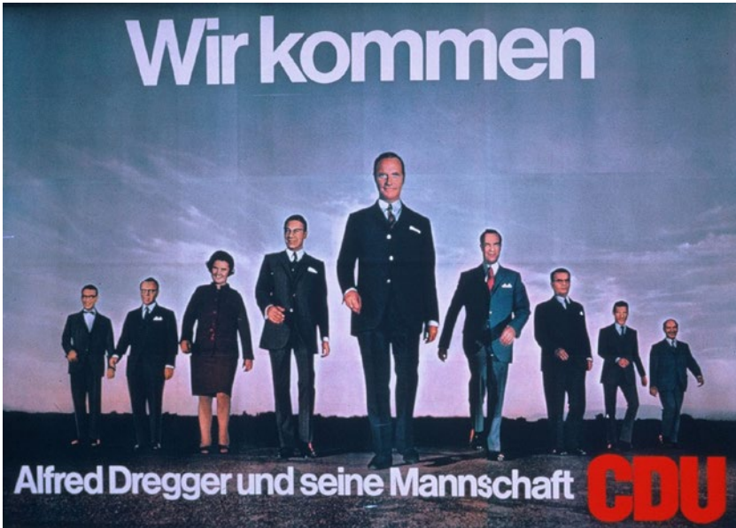
„Django-Plakat“

die Idee der Darstellung der Führungsmannschaft also aufgegeben, der Spitzenkandidat immer klarer herausgestellt wurde. 263