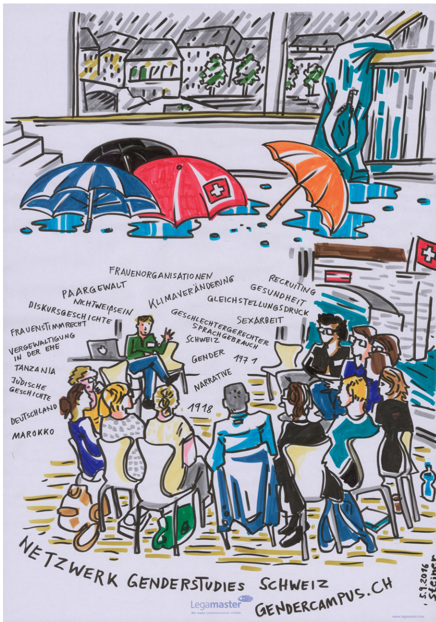
Abbildung 3: Visuelles Protokoll zu einer Einführungsveranstaltung für Doktorierende im interuniversitären Doktoratsprogramm