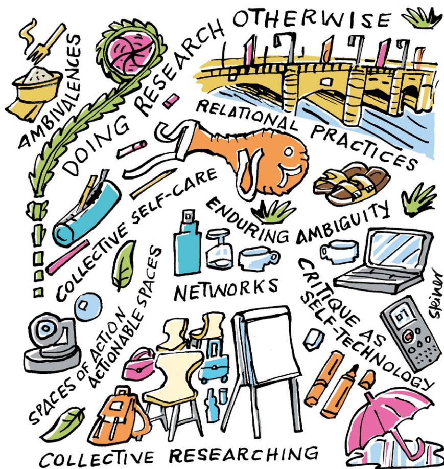
Abbildung 1: Visuelles Protokoll einer Veranstaltung des interuniversitären Doktoratsprogramms zu zentralen Begriffen der Zusammenarbeit