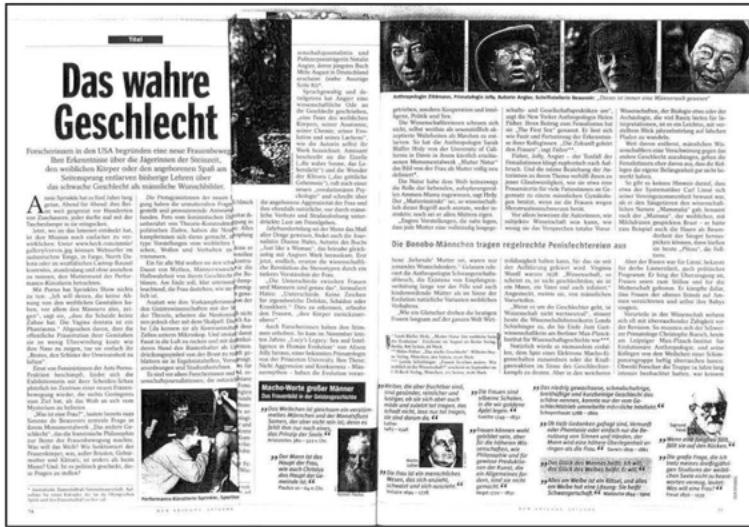
Abb. 2: Femalism feiert das Weibliche (von Bredow 2000).

In welchen Kontext diese gestellt werden, ist allerdings problematisch: Seit etwa 1995 und besonders in den Jahren 1999/2000 wurde eine Fülle an Artikeln veröffentlicht, die wie nie zuvor die Biologie der Frau bejubeln, ihre Fruchtbarkeit; die riesigen, mächtigen Eizellen der Frauen, die nicht mehr passiv auf die Spermien warten, wie noch vor etwa zehn Jahren, sondern sie geradezu aggressiv verschlingen; die vernetzte Intelligenz der Frauen durch ein zwar kleineres Gehirn, dessen Zellen aber untereinander umso stärker vermitteln, wird hervorgehoben und die sprachlich-sensible, soziale Intelligenz betont; ebenso wie die Tatsache, dass Frauen biologisch ein höheres Alter erreichen als Männer als evolutiver Fortschritt gedeutet wird und derlei vieles mehr.