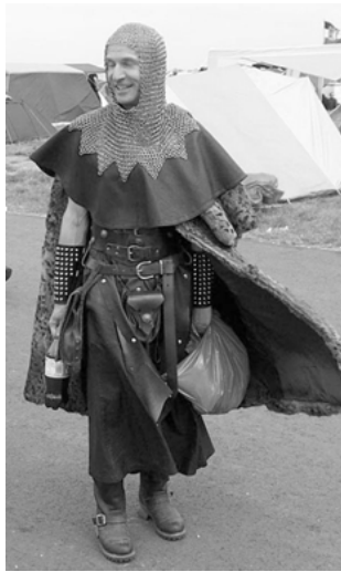
Abbildung 4: Historische Retrofigur: Ritter

ckung, eine Kettenmütze, wie sie die mittelalterlichen Turnier Ritter unter dem Helm trugen. Zeitgenössische Elemente sind schwarze Motorradboots, beide Unterarme sind mit breiten Nietenstulpen bedeckt, wie bei einer mittelalterlichen Panzerung, das Accessoire stammt aus dem Metalbereich. Er ist ein Pseudo-Ritter ohne Pferd, die Diskrepanz zwischen historischer Inszenierung und der Umgebung eines Festivalgeländes, wird deutlich.