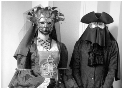
Abbildung 1: Historie 1

Typ 1 Historische Retrofigur: In den 1980er Jahren bezieht sich die Szene nur in ihren Bildwelten auf das Mittelalter (siehe Gotik-Bild der Romantik). In der Gegenwart werden die „mittelalterlichen“ Locations zur konsequenten Umrahmung einer spezifischen Kleidung.