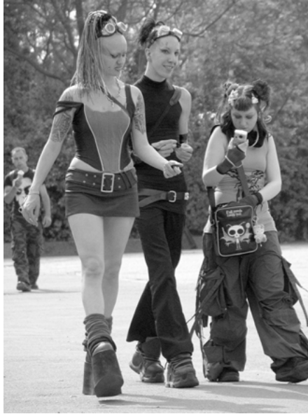
Abbildung 9: Darktechnocrossover