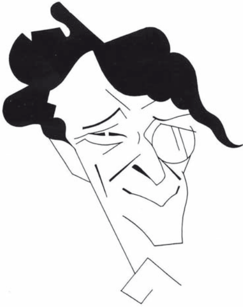
Karikatur von B. F. Dolbin.