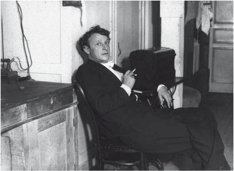
In der Garderobe des Theaters in der Josefstadt kurz vor der Stegreif-Rede »Warum haben wir kein Geld?«, 15.11.1931.