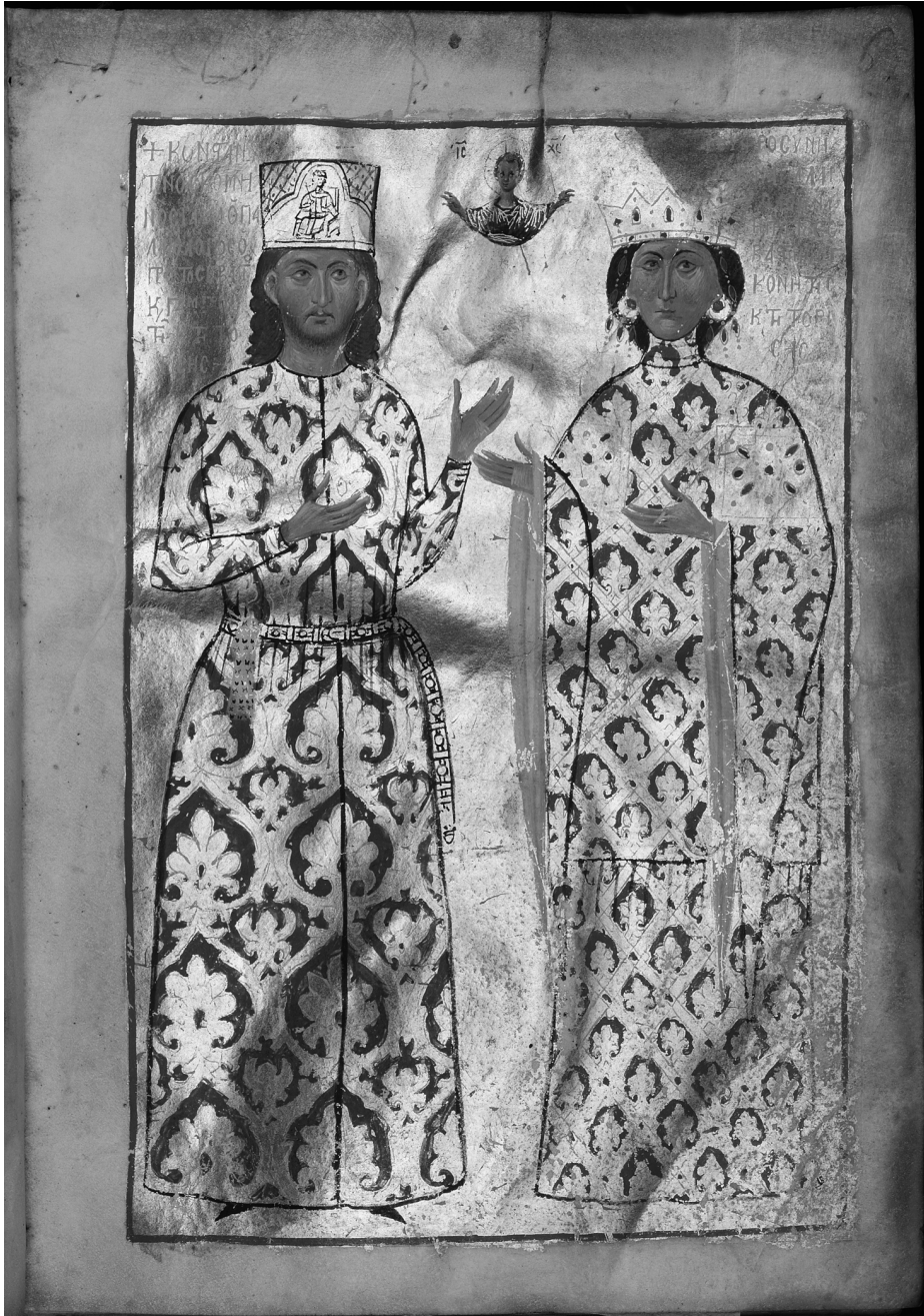
Fig. 20 Constantine Komnenos Raul Palaiologos and Euphrosyne Dukaina Palaiologina (Oxford, Bodleian Library, Lincoln College gr. 35, f.6r)