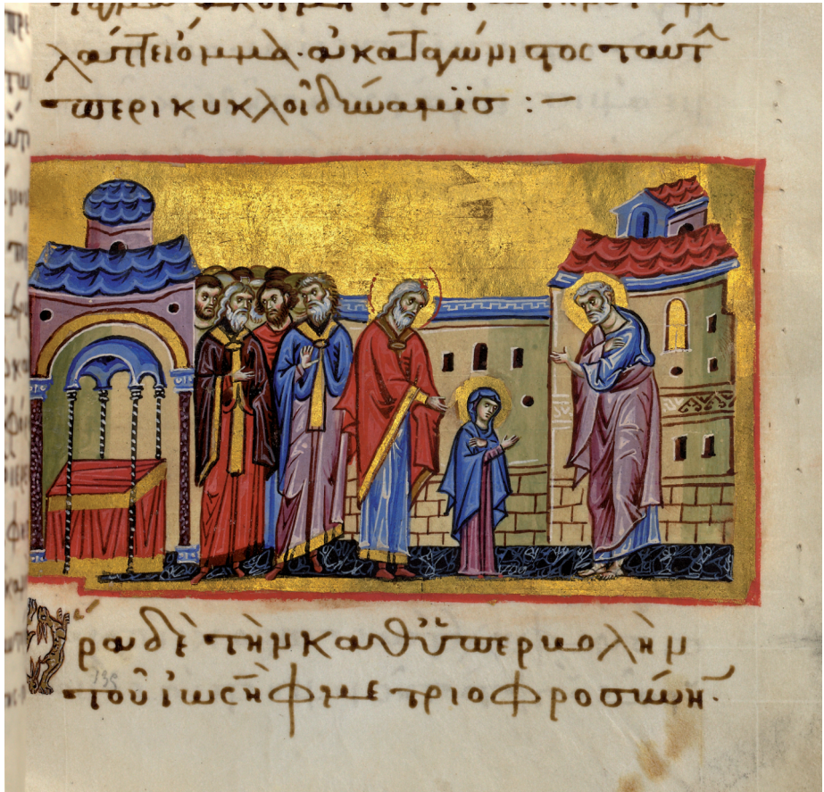
Fig. 6 Mary's betrothal to Joseph (Paris.gr.1208, f.135r); © Bibliothèque Nationale de France