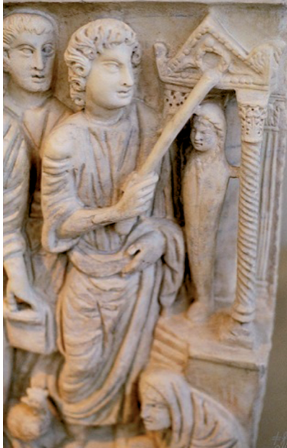
Fig. 14 Sarcophagus of Marcus Claudianus, in the Museo nazionale delle Terme in Rome, dated to 330–40, Museo nazionale delle Terme, Palazzo Massimo, Rome

indeed she is mature in the census scene viewed before. 98 These representations all seem to show a sensitive awareness of coming of age and the transitional phases in life. While the Virgin is dressed from the time of her babyhood in the same blue dress and veil, the nuanced distinctions to her size and facial features reveal a distinct recognition of the stages of maturation.