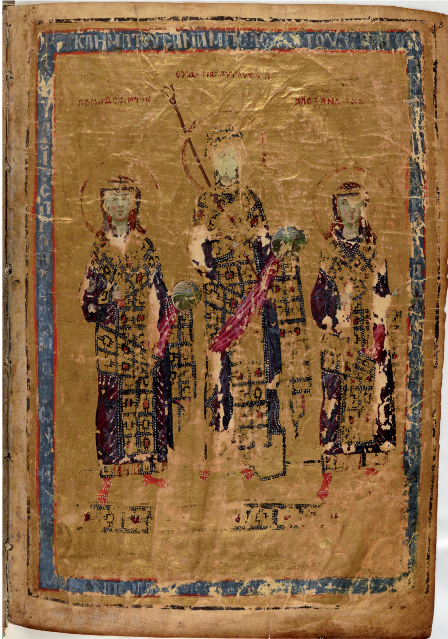
Fig. 3 Leo VI, Eudokia and Alexander (Paris.gr.510, f.Br)