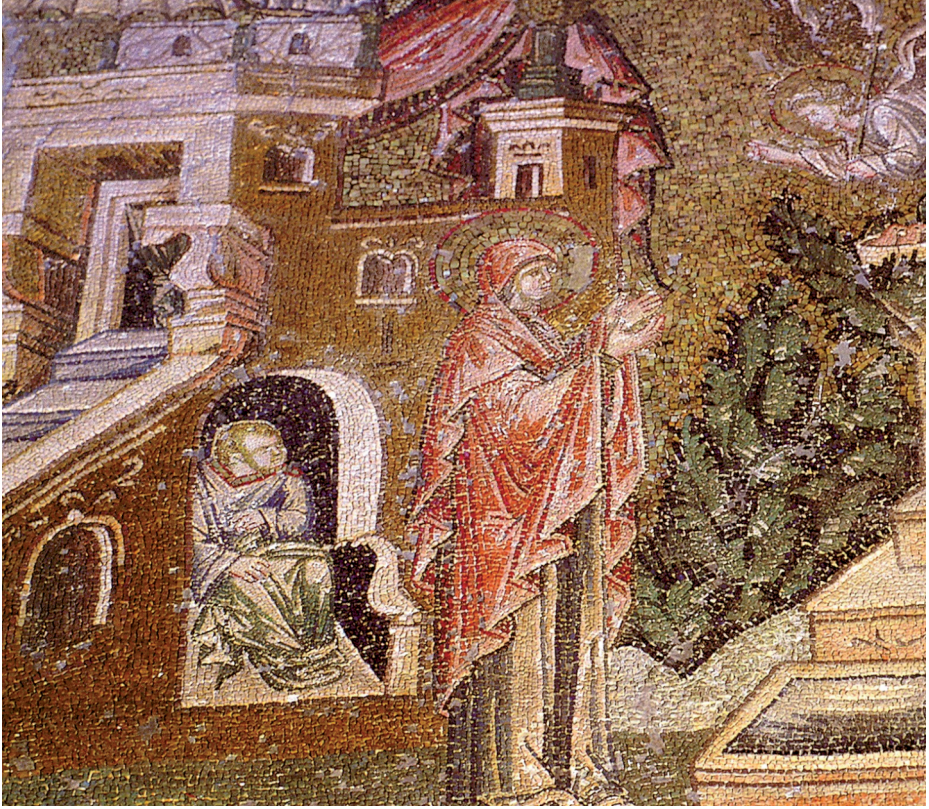
Fig. 8 Annunciation to Anna, former Church of Our Saviour in the Chora, the Kariye Camii, Istanbul

the Story of Joseph the Carpenter , he is described as ‘the pious old man’ and he is supposedly 90 years old at the time of Christ’s birth ( Carpenter 4, 14).