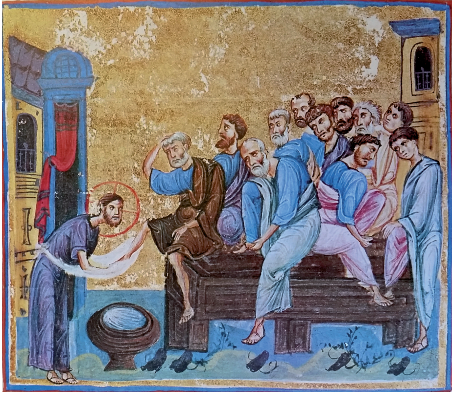
Fig. 1 Christ washing the disciples' feet, Athos, Dionysiou, cod. gr. 587 m, fol. 52r

is nearby taking his sandal off), and John and Philip are typically young (John is at the far right and Philip just above him), beardless and boyish, even one might say adolescent (fig. 1). 19 Judas is also shown as young, as for example in the same manuscript in the Betrayal scene. 20