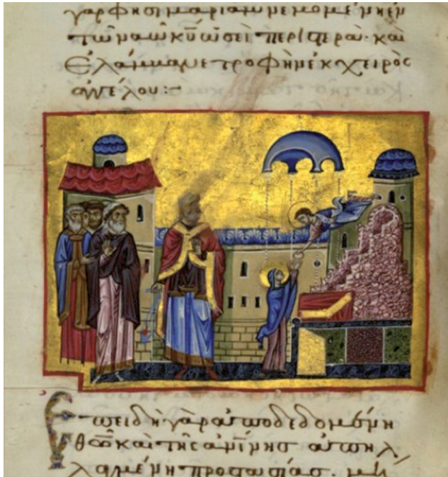
Fig. 12 The Virgin is installed on the altar, Paris gr. 1208, fol. 103v; Paris gr. 1208, fol. 103v

to Emperor Manuel I, the youngest of four sons, who ascended the throne in 1143 aged 25. If this were so, his youth in relation to his brothers might be emphasised. Manuel was twelve years younger than his eldest brother, Alexios (born 1106), and five years younger than the third son, Isaac (born 1113). The inclusion of an image of Christ Emmanuel, in the burning bush might reinforce this theory since Manuel had a particular interest in Christ Emmanuel and put the image on his coins. 92