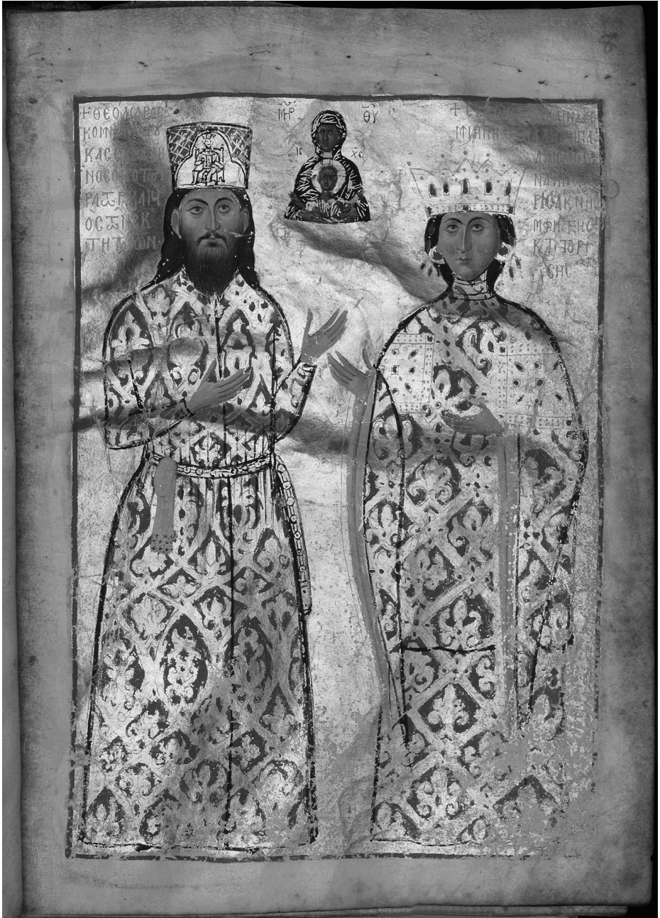
Fig. 19 Theodore Komnenos Doukas Palaiologos Synadenos and Eudokia Doukaina Komnene Synadene Palaiologina (Oxford, Bodleian Library, Lincoln College gr. 35, f.8r)