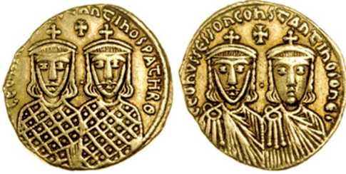
Fig. 16 Leo IV and Constantine VI, age 5 (Birmingham, Barber Institute of Fine Arts, inv. no. B4583)