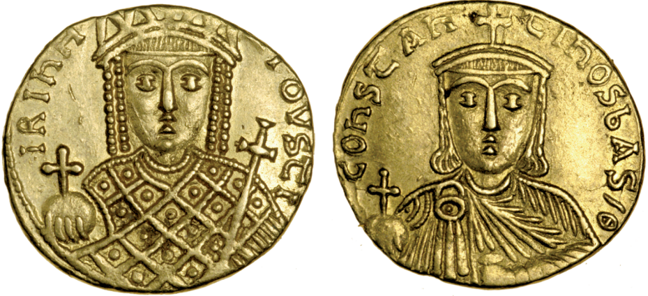
Fig. 17 Constantine VI, age 26 (Birmingham, Barber Institute of Fine Arts, inv. no. B4597)