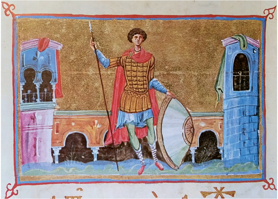
Fig. 2 Saint George, Athos, Dionysiou, cod. gr. 587 m, fol. 151v

one might potentially call adolescence. The beardless face, smooth skin and short hair indicate youth. In literature, beauty is associated with closeness to God, and often it is also linked with youth. The martyrs Demetrios, George, Prokopios, Panteleimon, Sergios and Bakchos are all shown as young, perhaps to convey the idea that their lives were cut short for their love of Christ. 21 Males served in the army from a young age, often from sixteen, so a youthful warrior saint is not necessarily incongruous. One could argue that these figures are aged between sixteen and twenty five, the age of maturity. To return to the lectionary, Dionysiou cod. gr. 587 m., in individual standing portraits of the saints, George is shown as young and elegant and Demetrios as very youthful (fig. 2). 22 In the mid-twelfth-century church dedicated to Saint Panteleimon at Nerezi, several young male saints are exquisitely and attractively portrayed. The church was built in 1164 by a grandson of Alexios I Komnenos, named Alexios Komnenos Angelos. Panteleimon himself is positioned to the right of the apse and appears very young, delicate and sensitive, with pale skin, scarcely more