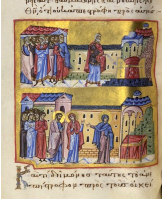
Fig. 11 The Virgin says goodbye to her parents, Paris gr. 1208, fol. Bis 100v; Paris gr. 1208, fol. 103v

he refers to her as ‘a young girl with a divine appearance’. 88 When Joseph returns from his work and sees her pregnant, he is perplexed, but he still calls her ‘girl’ until he realises that indeed she is pregnant, when he addresses her as ‘woman’. 89 In this image, she looks full grown in height (though not ostensibly pregnant). 90 However, later she is referred to again as ‘girl’. As mentioned, many details in the images are not derived from the text and the phrasing may not be directly relevant to the pictorial representation.