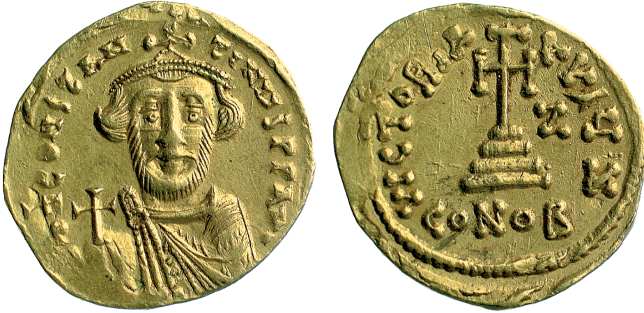
Fig. 10 Constans II, age 18–19 (Birmingham, Barber Institute of Fine Arts, inv. no. B3791)