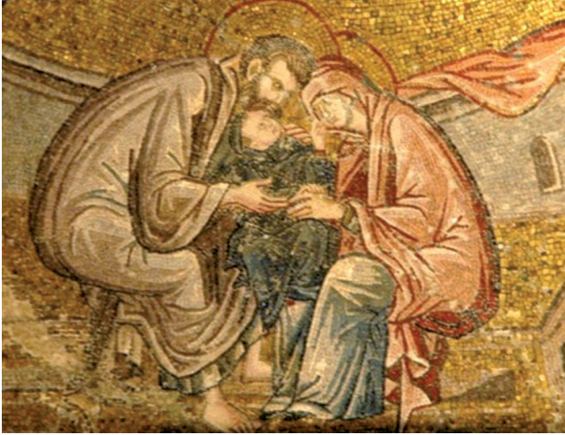
Fig. 13 ‘The fondling of the Theotokos’ former Church of Our Saviour in the Chora, the Kariye Camii, Istanbul

cuddled by her parents in a scene called ‘the fondling of the Theotokos’ (fig. 13). 94 She then appears as a little girl when at the age of three she is presented in the temple and fed by an angel and still as a little girl when Joseph is chosen to betroth her by the sprouting of his rod when she is aged twelve ( Infancy Gospel 8:3; Carpenter 3). 95 But suddenly then, in departing with Joseph to his house in the scene mentioned above, she has entered what one might term adolescence, since she is no longer a little girl, is taller while not full height and slight in body (fig. 9). 96 So she is not fully mature when leaving for Joseph’s house, but when he departs, again with a son, to engage in some carpentry work, she has become mature, although according to the Infancy Gospel text this occurred only shortly after. 97 According to the Story of Joseph the Carpenter , she conceives Christ at the point when ‘after the holy virgin had spent two years in his house her age was exactly fourteen years’ ( Carpenter 4). And