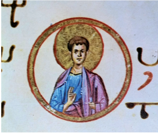
Fig. 4 Christ Emmanuel, Athos, Dionysiou, cod. gr. 587 m, fol. 14v

same clothes. 42 Other examples from about the same date are in the domes at Elmalı and Karanlık churches in Cappadocia, Göreme, dated probably to the mid-eleventh century. 43