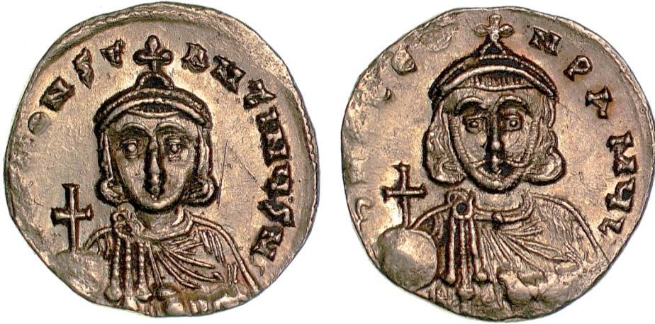
Fig. 14 Leo III and Constantine V, age 2–7 (Birmingham, Barber Institute of Fine Arts, inv. no. B4511); © The Barber Institute of Fine Arts, University of Birmingham