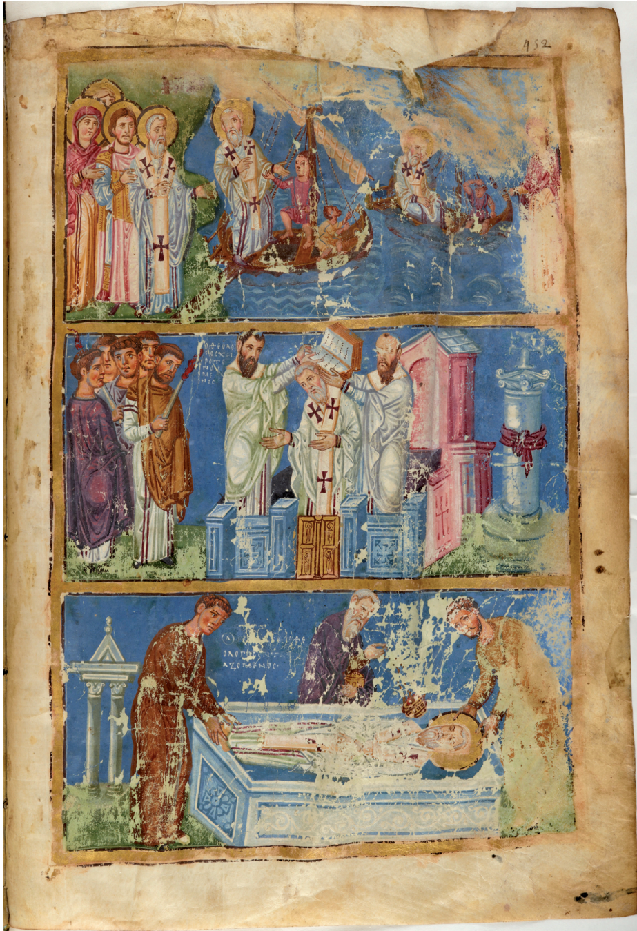
Fig. 1. Burial of Gregory of Nazianzos (Paris.gr.510, f.452r)