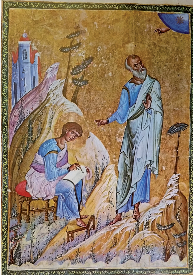
Fig. 3 Saints John and Prochoros, Athos, Dionysiou, cod. gr. 587 m, fol. 1v

As with the male saints, texts often emphasise the beauty of female saints and this beauty is also associated with being young. In images, determining the age of the sanctified girls and women is often problematic. They tend to be portrayed with no signs of aging, perhaps just a certain maturity conveyed through the covering of their hair, but except in unusual cases, with an air of timelessness. Typical examples are the various female saints depicted on the west wall of the narthex at Hosios Loukas, probably datable to the eleventh century, which include Saints Anastasia, Thecla, Febronia, Eugenia, Agatha, Irene, Catherine, Barbara, Euphemia, Marina and Juliania, all relatively young and attractive with smooth skins and large eyes. Could these male and female examples suggest that there are certain conventions in depicting idealised beauty which perhaps can be defined as adolescence?