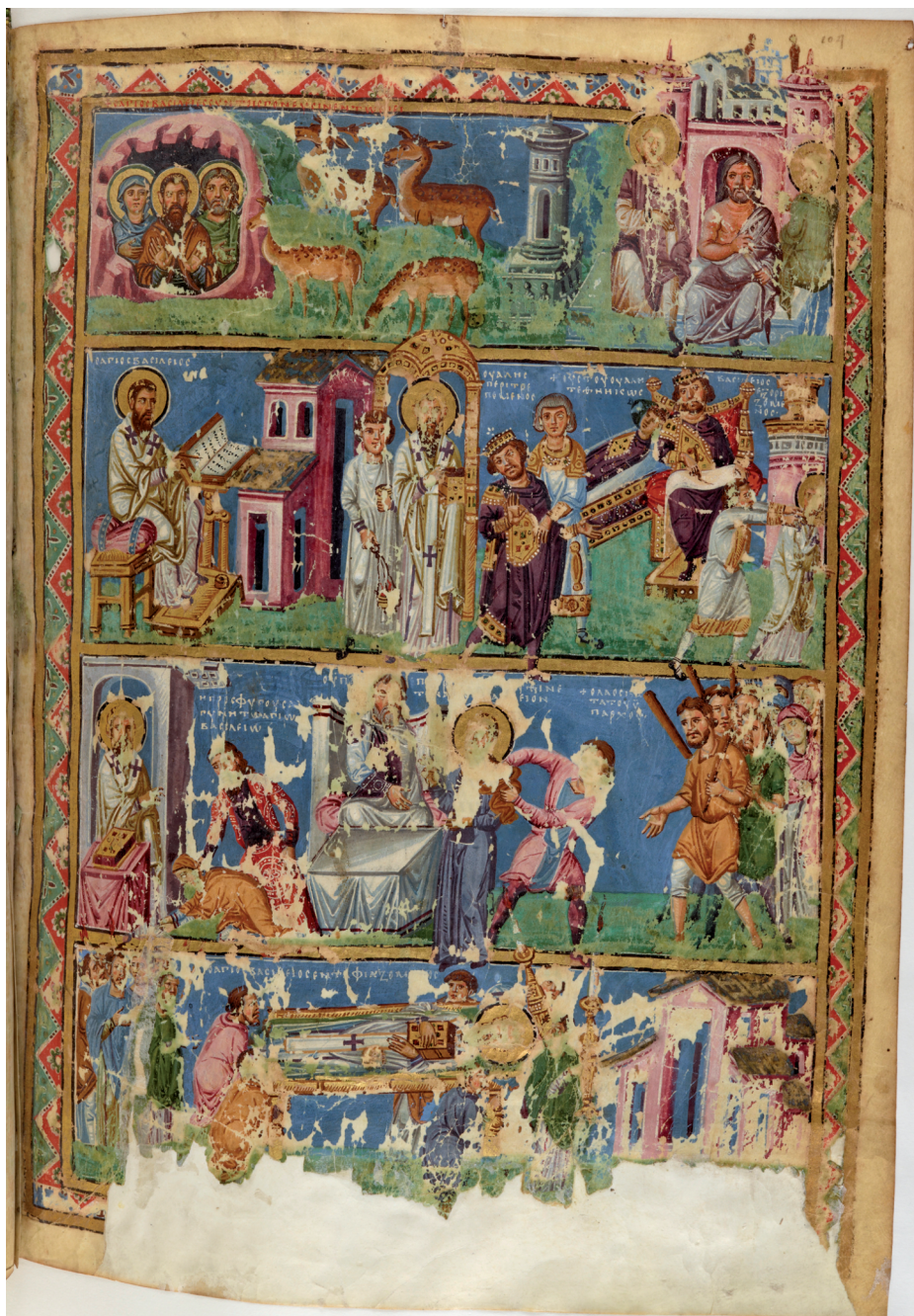
Fig. 2 Life of St Basil (Paris.gr.510, f.104r)