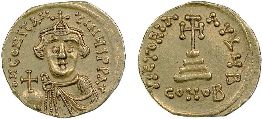
Fig. 8 Constans II, age 11–15 (Birmingham, Barber Institute of Fine Arts, inv. no. B3746); © The Barber Institute of Fine Arts, University of Birmingham