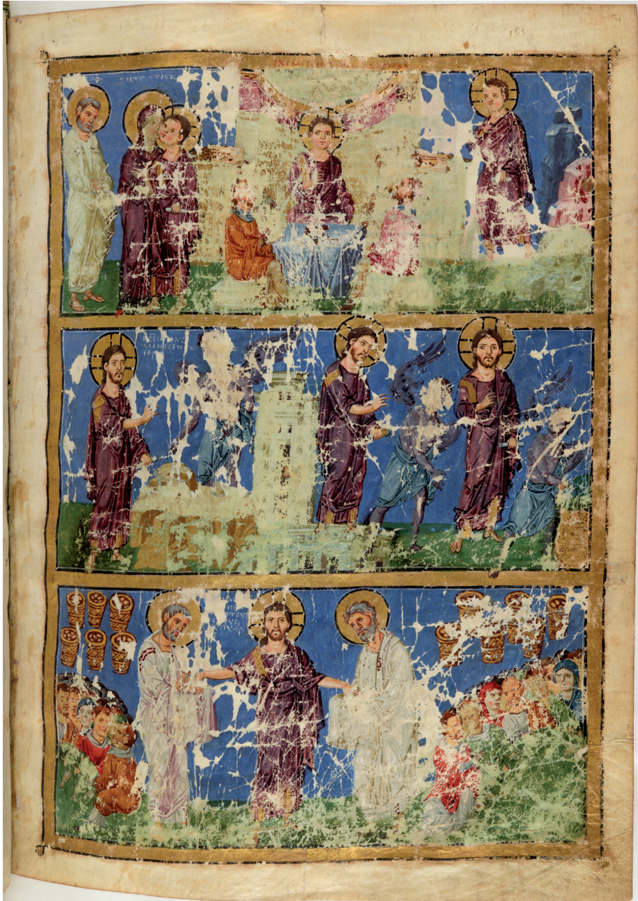
Fig. 5 Christ preaching in the temple (Paris.gr.510, f.165r); ©Bibliothèque Nationale de France