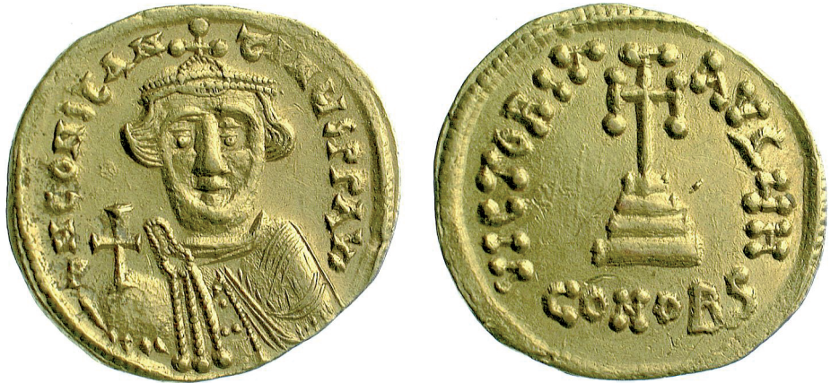
Fig. 9 Constans II, age 17 (Birmingham, Barber Institute of Fine Arts, inv. no. B3773)