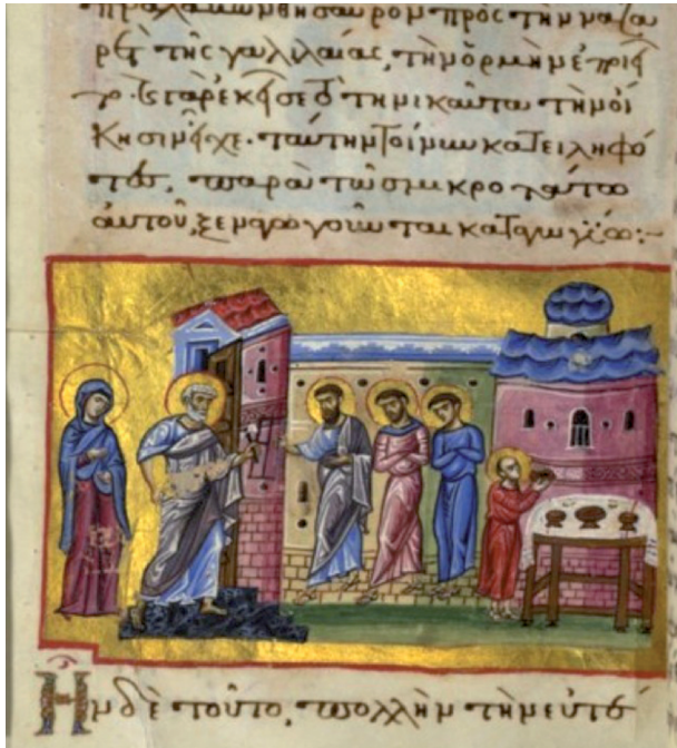
Fig. 10 The Virgin enters Joseph's house, Paris gr. 1208, fol. 142v

ed to Zachariah in the temple and when installed on the altar. 84 Interestingly when she says goodbye to her parents, she seems fully grown (fig. 11). 85 But then when fed by the angel on the altar she is again a little girl (fig. 12). 86 Zachariah decides that when she has reached the age of twelve, it is no longer proper for her to be in the temple, so Joseph is chosen as her betrothed. When she is given to Joseph, she is a child, but when shortly thereafter she leaves with Joseph through Jerusalem, she has become much more grown up, and when she enters his home and meets the sons, she is mature. 87 The text of the homilies refers to her with various terms, aware of the delicate situation evoked by her reaching the age of twelve. For instance, in a speech made by Joseph after he has been chosen to betroth the Virgin,