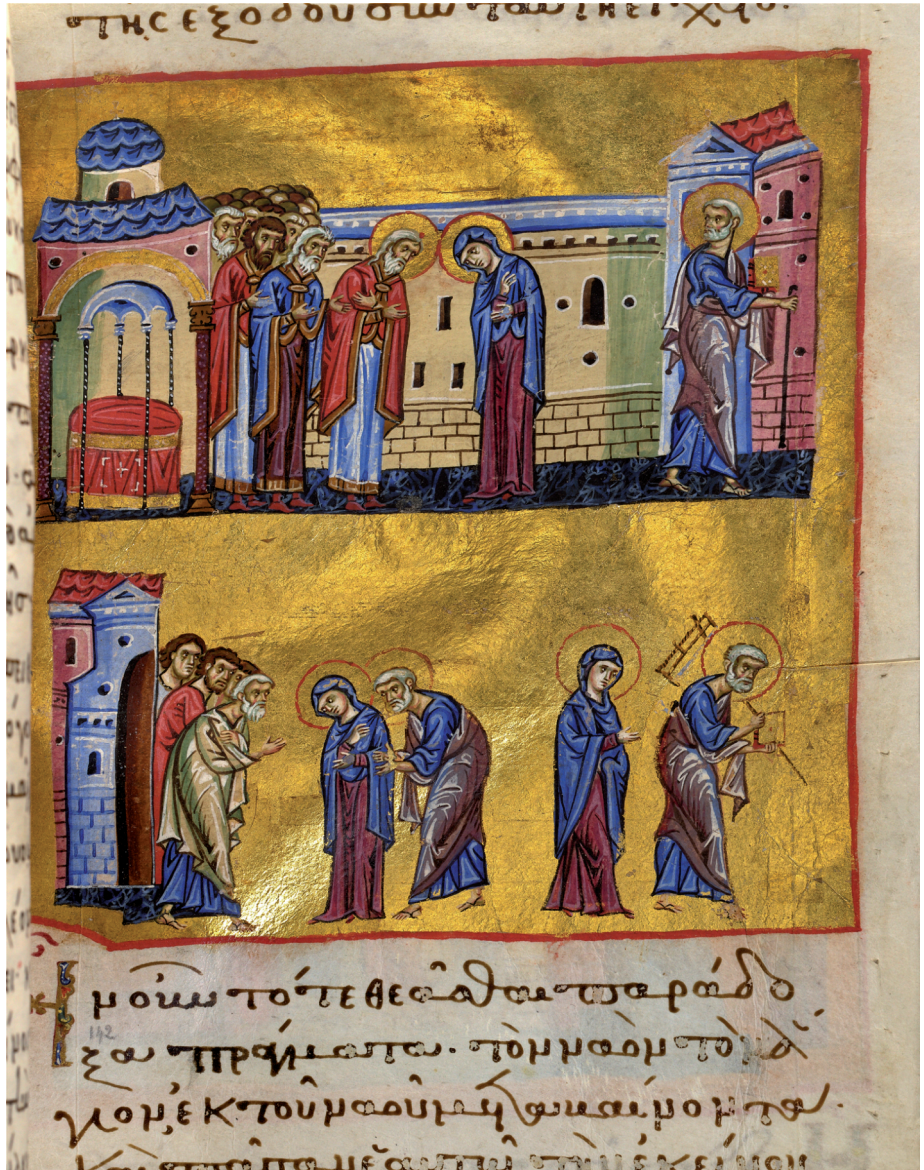
Fig. 23 Mary leaving the temple with Joseph (Paris.gr.1208, f.142r); © Bibliothèque Nationale de France