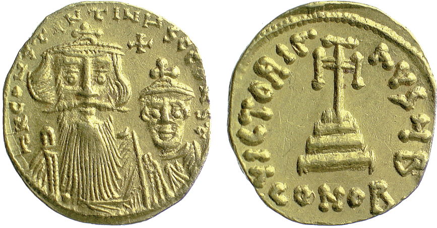
Fig. 12 Constans II with son Constantine IV (Birmingham, Barber Institute of Fine Arts, inv. no. B3832)