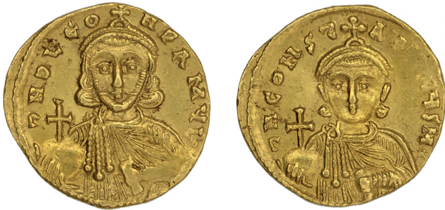
Fig. 13 Leo III and Constantine V, age 2 (Washington, DC, Dumbarton Oaks, inv. no. BZC.1948.17.2445)