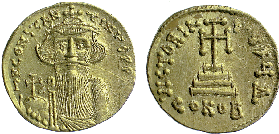
Fig. 11 Constans II, age 20–21 (Birmingham, Barber Institute of Fine Arts, inv. no. B3812); © The Barber Institute of Fine Arts, University of Birmingham