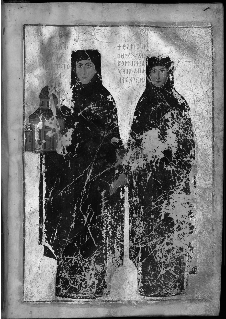
Fig. 7 Theodoule and Euphrosyne offer the monastery and typikon to the Virgin (Oxford, Bodleian Library, Lincoln College gr.35, f.11r)