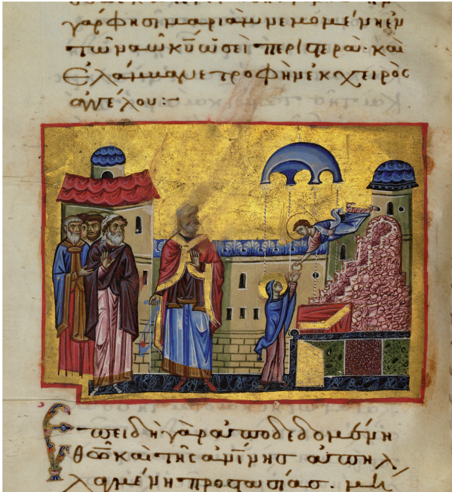
Fig. 22 Mary being fed by an angel in the temple (Paris.gr.1208, f.103v)