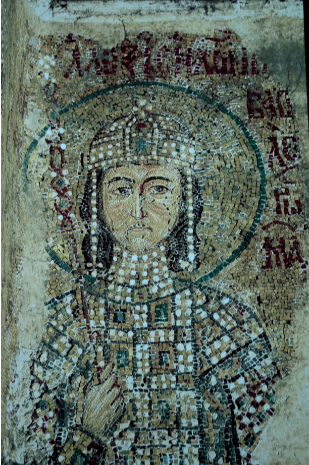
Fig. 5 Alexios, upper gallery, Hagia Sophia, Istanbul

shows Euphrosyne, who is the great niece of Michael VIII and the daughter of the foundress as an adolescent. 45 It has a series of portraits on twelve folios. In one, Euphrosyne is depicted with her mother, Theodora, and is shown shorter than Theodora, with a smaller, more youthful face, clearly not fully grown, yet not a child