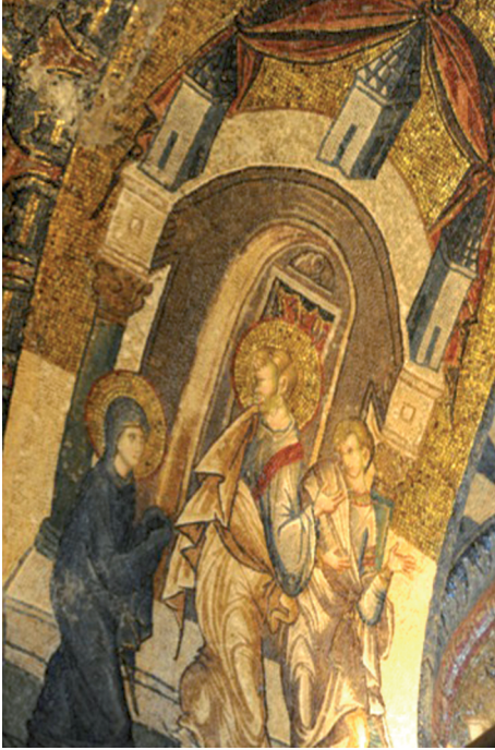
Fig. 9 Joseph takes the Virgin to his home, former Church of Our Saviour in the Chora, the Kariye Camii, Istanbul

seph carries the child on his shoulders and a son, clearly youthful and dressed in a short tunic, follows the donkey. 77 When Christ is taken by his parents to Jerusalem at the age of twelve, he is accompanied by two of the brothers, one bearded and one beardless who wears a short tunic. 78 Christ is dressed in a long gold garment, which has no reference to youth but rather to his importance or sanctity. However, he appears fresh faced and youthful.