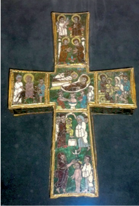
Fig. 7 Paschal Cross, Vatican

all the figures on the box, and he appears to be a youth, shown as smaller than Joseph, since size is often used to distinguish stature, and with a beardless face, cropped hair and short tunic. The boy is placed in a position of servility or responsibility guiding the donkey. Moving to the early tenth century, in Cappadocia, in the Old Church at Tokalı kilise, Jacob is depicted and named, simply as Iakobos, leading the donkey on the road to Bethlehem and also in the Flight to Egypt. 68 The Flight to Egypt is not included in the Infancy Gospels , but none the less, Jacob has kept up his previous role. There are numerous other examples. In each, his adolescent stage is apparent, shown too tall to be a boy, but without facial hair and wearing the tunic of youth. No examples in Cappadocia, however, show more than one