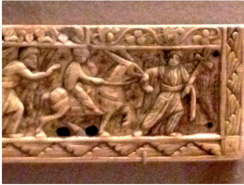
Fig. 6 An angel leading the donkey in the Journey to Bethlehem, Ivory panel, sixth century, Louvre OA 11149

Mary and then ‘the angel ordered the beast to stand, for the time when she should bring forth was at hand’. 64 The angel is pictured in a similar location and pose on the ivory on the Chair of Maximianus, a scene where there are no sons, and on an ivory panel in the Louvre, the angel strides forward holding a cross and leading the donkey (fig. 6). 65 It is possible that the angel in this type of image is transposed into Jacob in later examples. A further early example where Jacob is shown is in the paintings at Castelseprio, which are probably dated to the ninth century and include apocryphal scenes. 66 In the Journey to Bethlehem, a boy is in front of the donkey, now only partially visible, and so again his age is indeterminate, although he appears to be wearing a short tunic, something usually worn by servants, children, or youths. In a further ninth-century example, an enamel reliquary box, the Paschal Cross in the Vatican, dated 817–24, one son is shown (fig. 7). 67 He is unnamed, as are