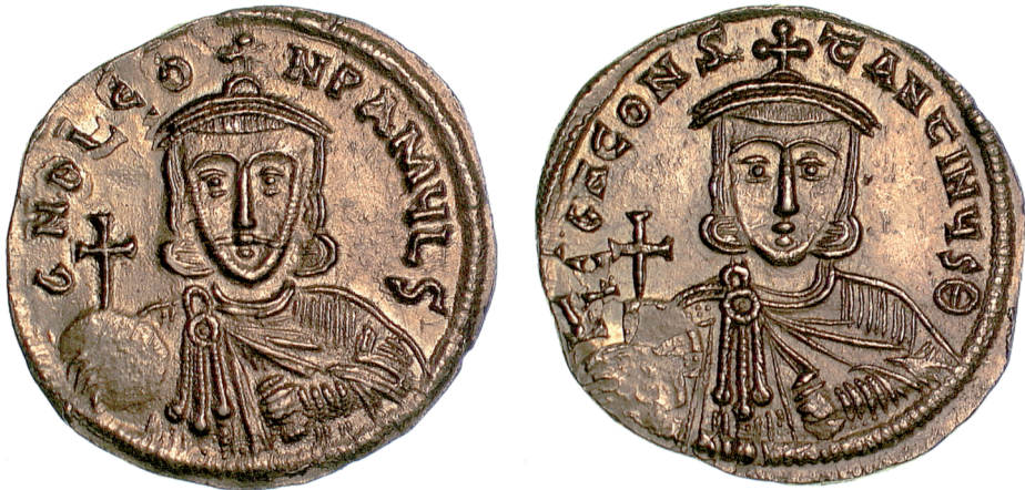
Fig. 15 Leo III and Constantine V, age 14–22 (Birmingham, Barber Institute of Fine Arts, inv. no. B4510)