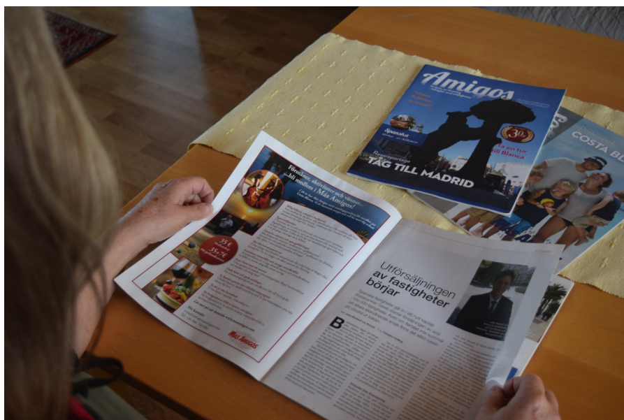
Figur 6. Bulletinen/Amigos är den största svenskspråkiga medlemstidningen i södra Spanien.

karaktär eller om det helt enkelt rör sig om företagssponsrad information eller reklam. Under åren 2013–2014 publicerade Bulletinen en serie artiklar om juridiken kring arvsskiftet, som är värd att nämna här. Signaturen Ábaco Advisers förklarar i dessa artiklar något av det snåriga regelverket som reglerar arven och de förändringar som var på gång vid den här tiden. Dessutom ger artikelförfattaren råd om hur det går att undvika de negativa effekterna av de nya reglerna. Detta är uppenbart användbar information för många som uppnått hög ålder och vill försäkra sig om att barnen har rätt att arva deras fastighet utan alltför stor skattesats. Signaturen Ábaco Advisers är emellertid ingen privat skribent utan visar sig vara en advokatfirma (vilket inte helt framgick av artikeln). Företaget har ett avtal med Más Amigos (vilket jag återkommer till senare i kapitlet) som erbjuder rabatt till föreningens medlemmar och annonserar regelbundet i Bulletinen/Amigos. Ábaco Advisers informativa inlägg sätter fingret på den mix mellan reklam och information i föreningens utbud som jag nämnde ovan.