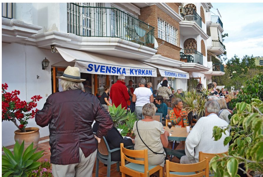
Figur 5. Julbasar i Svenska kyrkan, Fuengirola i november 2014. Foto: Jonny Ericson. Fotot är reproducerat i boken med tillåtelse av fotografen.

Lokalernas lämplighet och geografiska läge tycktes vara ett ständigt huvudbry för Más Amigos, som är den största föreningen för svenskar i södra Spanien (i hela världen, hävdar en del). Som sådan har föreningen många aktiviteter och hundratals besökare varje vecka. Föreningens klubblokal är inte bara en social träffpunkt utan också en arbetsplats för flera anställda. Lokalen utgörs av en relativt stor lägenhet i bottenvåningen av en fastighet i utkanten av Torrevieja. I denna lokal rymms en entré – med soffor, fåtöljer, hyllor och anslagstavlor – en expedition, som varje dag under säsongen har öppettider mellan klockan 10 och 15, kontorsutrymmen för föreningens personal och ett rum som är kombinerat bibliotek och serverings-/samlingsrum. Det är ett tiotal personer som har sin arbetsplats här. Till dessa hör de som arbetar i kansliet och