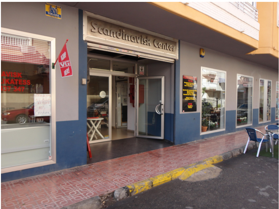
Figur 3. På bilden ses entrén till den skandinaviska gallerian i Torre Vieja.

Det tycks med denna bakgrund uppstå allt större möjligheter att leva ett "svenskt" liv i Spanien eller åtminstone ha ett vardagsliv på svenska. Tack vare att tjänstesektorn hittat en nisch bland svenskar och andra nordbor kan migranterna leva ett förhållandevis bekvämt liv även under omständigheter då man behöver omfattande hjälp och stöd och inte kan det lokala språket. Företag/serviceleverantör och individ/konsument måste emellertid "hitta" varandra för att det ska uppstå en "ekonomi" som driver fram en diasporisk gemenskap kring detta. Här kommer föreningar in som ett slags förmedlande länk. I föreningarnas verksamhet märks rollen som mäklare i all den reklam som förekommer i till exempel medlemstidningar och på hemsidor. På olika sätt förmedlar föreningar information som leder direkt till företagets utbud av tjänster och service. De företagare som vill marknadsföra sig i de svenska nätverken kan i gengäld sponsra aktiviteter och, som exemplen ovan visat, stödja föreningsverksamheten. Som exemplet ovan säger har företag i något fall också startat en förening och låtit denna ta hand om