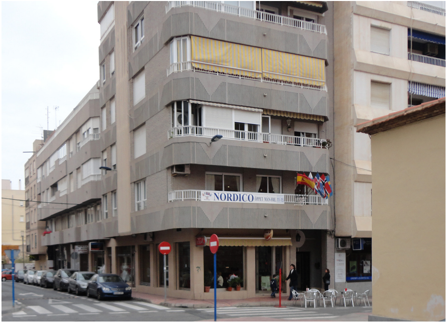
Figur 4. Gatuvy i Torrevieja. I bakgrunden till höger syns Club Nórdicos lokal.

är profilen ett uttryck för vad som uppfattas som svenskt i detta sammanhang (eller rättare sagt det som föreningsaktiva tror kan vara det svenska i nätverken) men är samtidigt ett slags görande av det svenska.