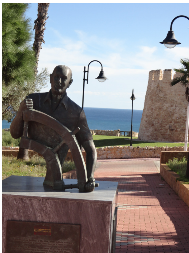
Figur 2.