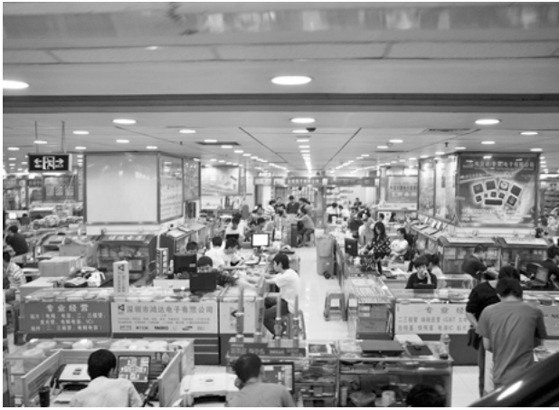
SEG Electronics Market, ein zehngeschossiger Marktplatz für den weltweiten Handel von Elektronikkomponenten, Shenzhen, 2011

entlang der Auseinandersetzung mit informellen Märkten deutlich ablesen. In ökonomischer Hinsicht richtet sich der Begriff der Informalität auf Einnahmen, deren Generierung nicht von gesellschaftlichen Institutionen geregelt wird und in einer rechtlichen und sozialen Umgebung stattfindet, in der ähnliche Aktivitäten einer genauen Regelung unterworfen sind. (Portes/Haller 2 2005) Je nach politischer Motivation, unmittelbaren Profiterwartungen oder langfristigem ökonomischen Kalkül werden informelle Märkte als Bereicherung oder als Übel betrachtet. In manchen Fällen gilt ihre Informalität als nutzbringend für eine gewinnbringende Entwicklung, in anderen Fällen dagegen als dem allgemeinen Wohlstand abträglich, obwohl sich die gesetzlichen, räumlichen und materiellen Umstände nicht unterscheiden. Diese Elastizität von Wertmaßstäben ist ein zentraler Parameter in der Debatte über die politische Ökonomie urbaner Informalität, aber auch in der mit den neuen Protestbewegungen entflammten Diskussion über die Gestalt von politischer Öffentlichkeit. Gerade angesichts der offenkundig zunehmenden Privatisierung von öffentlichen Räumen und der schleichenden Privatisierung des komplexen Gefüges der Öffentlichkeit durch das neoliberale Wirtschaftsmodell sind die weltweiten Besetzungen von Stadträumen nicht nur als konzertierte