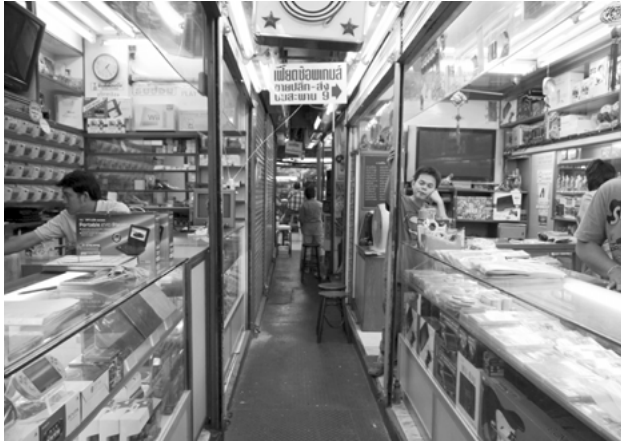
Informeller Markt Saphan Lek, eine von Bangkoks »roten Zonen«, 2012

betrifft aber eine Maßnahme, die den von informellen Märkten verursachten Schaden mediengerecht präsentiert, indem nur ein paar ausgewählte Fälle in einem »außerplanmäßigen Bericht zu berüchtigten Märkten« (out-of-cycle review of notorious markets) öffentlich angeprangert werden. Der seit 2011 jährlich veröffentlichte Kurzbericht besteht aus wenigen Seiten und wird jeweils kurz vor dem Erscheinen des umfangreicheren Special 301-Berichts der Öffentlichkeit präsentiert. Diese Hitparade informeller Märkte listet so unterschiedliche Marktplätze wie La Salada in Buenos Aires, Tepito in Mexiko-Stadt, Pekings Seidenmarkt, die Urdu Bazare in Karatschi und Lahore, den Petrivka Markt in Kiew, das Shoppingcenter Harco Glodok in Jakarta oder das Einkaufszentrum Lo Wu in Shenzhen. Mit ihrer unkomplizierten Botschaft und ihrer Ignoranz gegenüber Details ist diese Auswahlliste mittlerweile zu einer weltweit rezipierten Quelle für Medienberichte über illegale ökonomische Aktivitäten geworden. Ohne die darin enthaltenen Behauptungen und Forderungen untermauern zu müssen, beinhaltet dieser kurze Bericht die passende Dosis an Information für Twitter-Feeds oder für Blitzmeldungen im Fernsehen – das ideale Regierungsinstrument für staatliche und gewerbliche Akteure, um der Öffentlichkeit zur richtigen Zeit das richtige Signal zu geben und eine Einmischung in Marktplätze außerhalb der USA vorzubereiten.