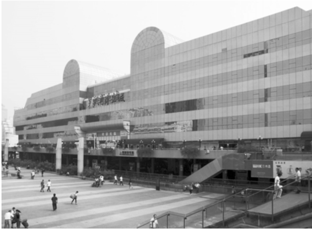
Lo Wu Shoppingcenter, Shenzhen, an der Grenze zu Hongkong, 2011, Foto: Peter Mörtenböck

In diesen Jahresberichten finden sich auch minutiöse Aufzeichnungen zu physischen Marktplätzen, die als »berüchtigt« (notorious) bezeichnet werden, weil sie Rechte zum Schutz des geistigen Eigentums von US-Firmen oder Staatsbürgern verletzen. Seit 2005 sind diese Aufzeichnungen nicht mehr Teil der Länderberichte, sondern werden in einem eigenen Dokument mit dem Titel »Berüchtigte Märkte« (Notorious Markets) zusammenfasst. Mit diesem Wechsel wurden auch die Kriterien flexibilisiert, die einen Markt für den jährlichen Bericht qualifizieren. Als berüchtigt gelten Märkte nun schon, wenn verabsäumt wird, den eigenen Umgang mit dem Diebstahl geistigen Eigentums zu überdenken 6 (Turkewitz 2010) Die einschneidendste Veränderung in der Entwicklung des Special-301-Berichts