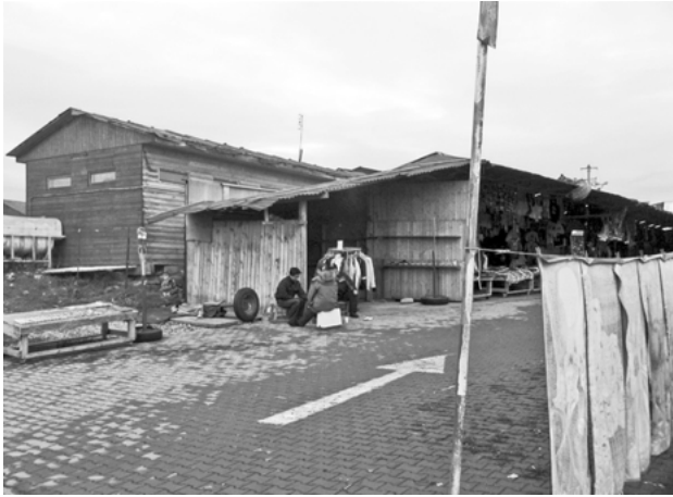
Vietnamesischer Markt an der tschechisch-österreichischen Grenze, 2010

Doch trotz der gemeinsamen ökonomischen Betroffenheit von vielen Teilen der Bevölkerung fällt es nach wie vor schwer, im Rahmen von raumpolitischen Überlegungen eine größere Perspektive aufzumachen, die dem von einer gut ausgebildeten jungen Generation in der westlichen Welt getragenen Protestgeschehen der jüngsten Zeit und den vielfältigen Protestformen informell organisierter Stadtbevölkerungen ein gemeinsames Interesse am Herstellen von Öffentlichkeit zuordnet. So wie der in Mohamed Bouazizi personifizierte Konflikt um nicht lizenzierten Straßenhandel – ein pars pro toto im Streit um die Grundlagen heutiger Zivilgesellschaft – zum Zündfunken des arabischen Frühlings wurde, bildet gerade auch in der Debatte um alternative Öffentlichkeitsmodelle die Frage, wie der historisch begründete Zusammenhang zwischen ökonomischer und stadträumlicher Ordnung in einer zeitgenössischen politischen Praxis aufgenommen werden kann, einen der markantesten Konflikttherde.