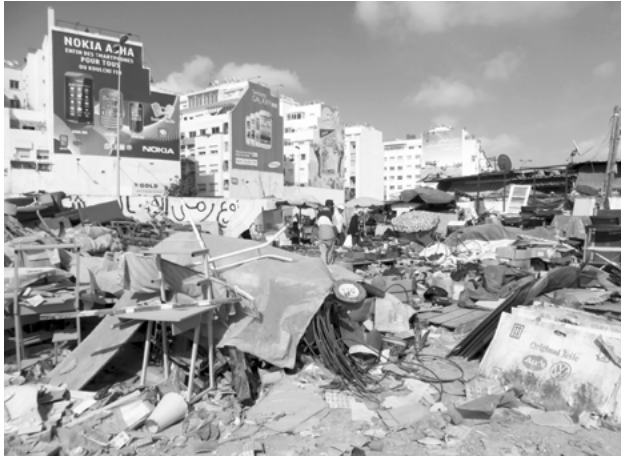
Derb Ghallef, ein wichtiger Schauplatz der informellen Wirtschaft Marokkos, Casablanca, 2013

denen Güter und Waren transportiert werden. Produkte werden so in eine Vielzahl kleinerer Lokalitäten verstreut, wo sich feinmaschige Netzwerke an informellen Handelsstrukturen beteiligen können.