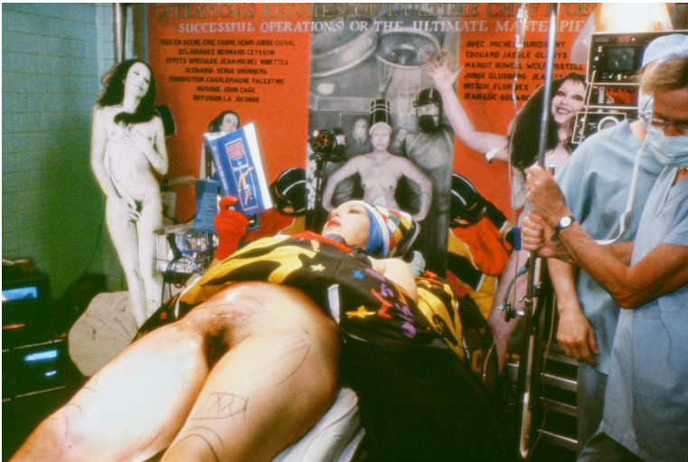
Bild 13. ORLAN, I'm reading, he's operating me . Serie: 5th Surgery-Performance Titled Operation Opera. Date: 6 july 1991. Cibachrome diasec mount. 65 × 43 inch.