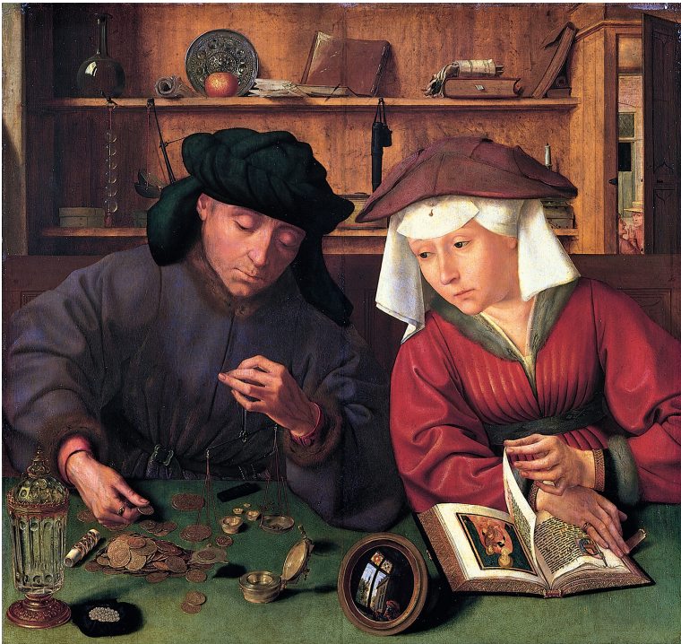
Bild 9. Quentin Matsys, Myntväxlarna , 1514. Olja på pannå. 71 × 67 cm. Louvren, Paris (Frankrike).

Stämningläget är mycket mer stillsamt här än i Susannabilden och allt tycks till att börja med vara i bästa harmoni (bild 9). 8 Två personer sitter vid ett