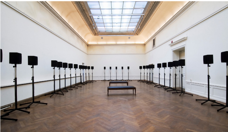
Bild 7. Janet Cardiff Forty-Part Motet (A reworking of "Spem in Alium" by Thomas Tallis 1573) (2001), 2006.

Cardiffs ljudinstallation Forty-Part Motet på Konstnärshuset 2006 kan förstås som en dubblering av den så kallade vita kuben. I det följande kommer jag dock att vända på begreppen. Snarare än att betrakta det rum som verket inrättade som isolerat – och därmed som en närmast per definition politiskt impotent plats – argumenterar jag för att Cardiffs installation visst kan förstås som en plats för just politik. För att göra denna tolkning kommer jag att skifta fokus en aning, från verket och dess olika beståndsdelar (högtalarstativen, bänkarna i mitten av salen, den inspelade musiken) och mot den tänkta betraktaren och dess handlingsutrymme i verket. Jag kommer med andra ord att koncentrera mig på verkets performativa tilltal .