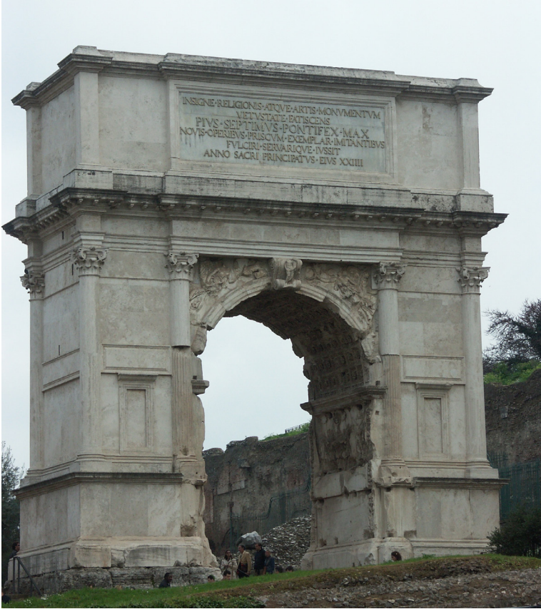
Bild 1. Titusbågen i Rom, uppförd 82 e.Kr.

Jerusalem år 70 efter Kristus. I triumftåget längs Via Sacra färdades fältherren tillsammans med sin far kejsar Vespasianus, sina romerska soldater, judiska krigsfångar och erövrade troféer, främst bland dem menoran, den sjuarmade ljusstaken från templet i Jerusalem som lagts i ruiner. Passagen genom en triumfbåge gjorde triumfen tydlig och påtaglig samtidigt som den markerade en övergång från krigets värld till den civila världen i huvudstaden