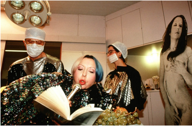
Bild 12. ORLAN, Lacan Operates: Reading and Proceed to Act with Paco Rabanne dress . Serie: 4th Surgery-Performance Titled Successful Operation. Date: 8 december 1991. Cibachrome diasec mount. 65 × 43 inch. Fotograf/institution: ORLAN (Copyright CC-BY- NC-ND)