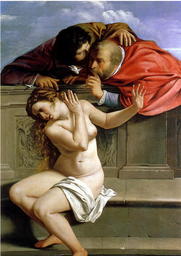
Bild 8. Artemisia Gentileschi, Susanna i Badet , 1610. Olja på duk. 170 × 119 cm. Schloss Weißenstein, Pommersfelden (Tyskland).

I bildkonsten är blickar i hög grad aktiva agenter. Det gäller blickar som fälls, möts och agerar inne i bilderna, i det estetiska rummet. Men också blickar som rör sig i det reella rummet, utanför och kring konstverken. Spelet mellan det estetiska