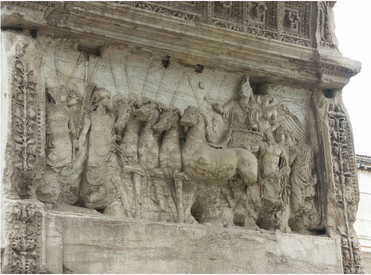
Bild 2. Reliefen på Titusbågens nordöstra sida, 82 e.Kr.