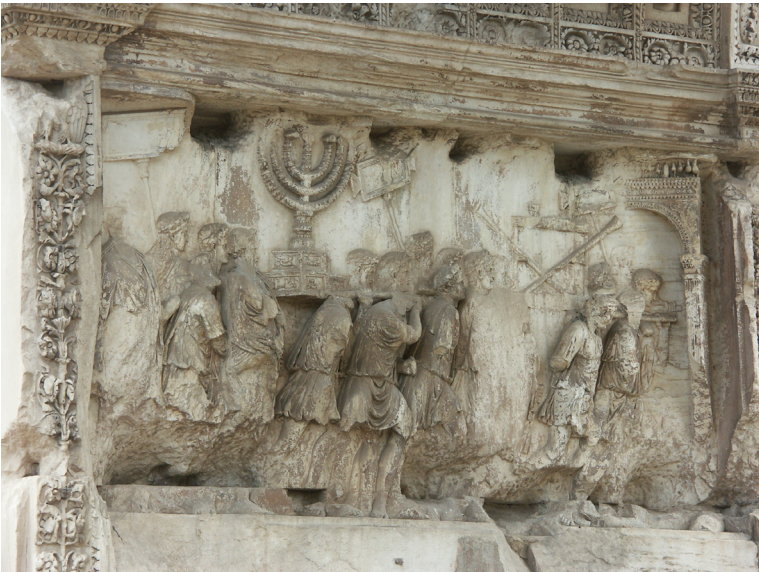
Bild 3: Reliefen på Titusbågens sydvästra sida, 82 e.Kr.