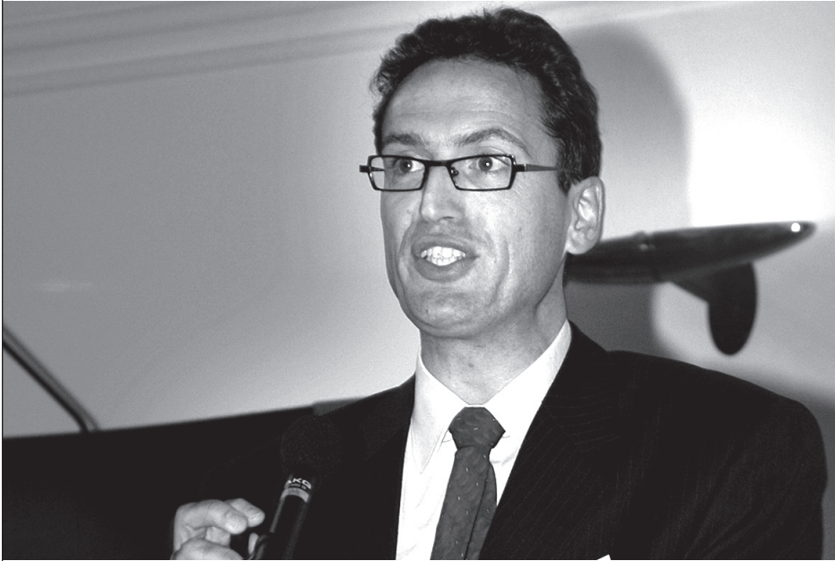
Maarten van Bottenburg