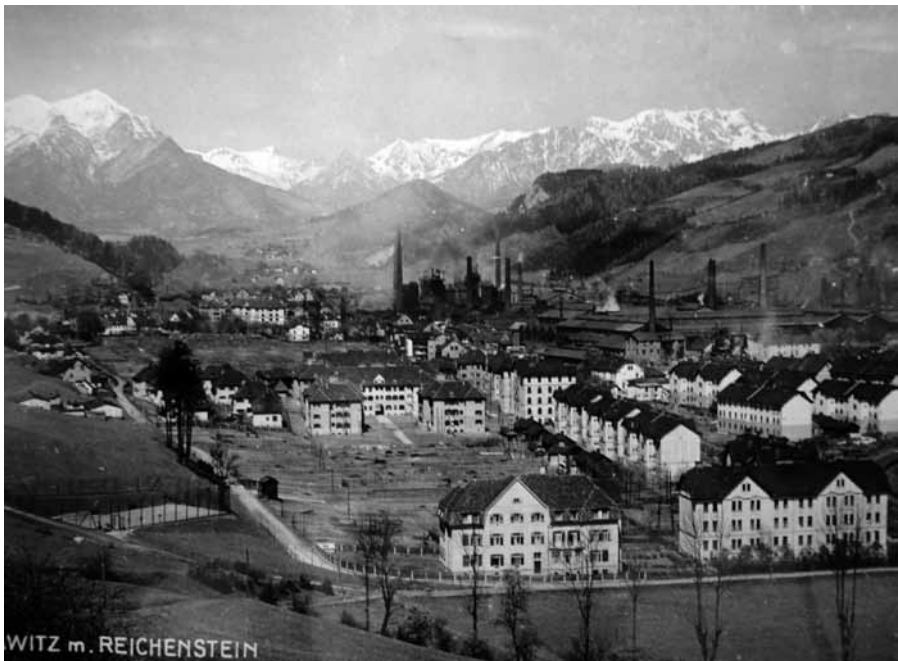
Abbildung 2: Donawitz in den 1920er Jahren mit den Hochöfen im Hintergrund vor der prächtigen Kulisse des Eisenerzer Reichensteins.

dieses Wertes. In den ersten Nachkriegsjahren geriet die ÖAMG wegen des Mangels an Brenn- und Rohstoffen in enorme Schwierigkeiten und musste den Grundstoff Kohle teilweise aus der nunmehrigen Tschechoslowakei teuer importieren. Um die Kohlen- und Koksversorgung zu sichern, kaufte das Management Beteiligungen am polnischen Bergbaurevier; nach 1921 wurde die ÖAMG vom Stinnes-Konzern mit Koks versorgt, was eine Steigerung der Roheisenproduktion zur Folge hatte. Im Jahr 1928 erreichte die Roheisenproduktion mit rund 450.000 Tonnen einen vorläufigen Höhepunkt vor der ab 1930 beginnenden Wirtschaftsflaute. Anfang der 1930er Jahre sah sich die ÖAMG gezwungen, vier ihrer insgesamt fünf betriebsfähigen Hochöfen niederzublasen oder zu dämmen. 1933 sank die Roheisenproduktion auf einen unerlichen Tiefstand von nur rund 87.000 Tonnen. In Eisenerz, wo einer der Hochöfen bereits 1928 niedergeblasen worden war, ruhte der gesamte Hochofenbetrieb bis 1937. Wie aus einem im Juni 1932 verfassten Behördenbericht hervorgeht, waren die Folgen in der ganzen Region verheerend: