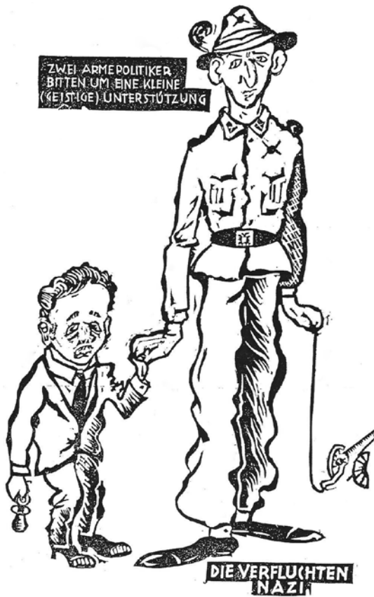
Abbildung 9: Nazi-propaganda: Dollfuß und Starhemberg.

prangerte die Massenverhaftungen an und fragte, ob es überhaupt einen Hochverrat in Österreich gebe, in einem Staat, in dem nichts Hohes zu verraten sei. Was sei die Gründung der Republik anders gewesen als Hochverrat? Mit einer verbalen Attacke gegen Innenminister Winkler, der mit seiner Parlamentsrede nur „Stunk in den Heimatschutz“ hineingebracht habe, fuhr Starhemberg fort: Wenn Sie von mir erwarten, dass ich putsche, dann erwarten Sie etwas falsches. Wir wollen unsere (...) Bataillone nicht zum Putsch, sondern zur Revolution führen (...) . Die schneidigen Sprüche des Bundesführers sollten auch von dem ungünstigen Eindruck ablenken, den er infolge seiner mangelnden Unterstützung für den Pfrimer'schen Putsch hinterlassen hatte. 832 Den etwa 3000 Versammelten verkündete er, die „Revolution“ bis zum siegreichen