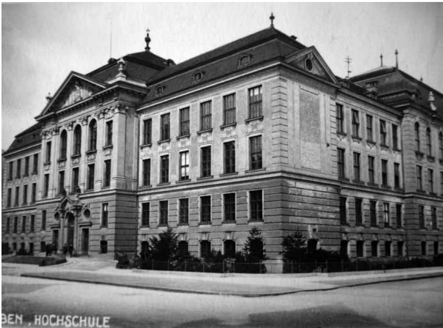
Abbildung 8: Das im Jahr 1910 bezogene Gebäude der „Montanistischen Hochschule“.

Der Opfertod hat auch in unserer Bergstadt Leoben reiche Saat gehalten. Aber aus den Gräbern floß Kraft und Mut und Zähigkeit, ergriff und ließ nicht locker und schmiedete und formte die Männer der ständig anwachsenden Bewegung zu den eisernsten Streitern der Steiermark, die nichts anderes kannten als kämpfen für Deutschland und seinen Führer Adolf Hitler bis zum Sieg! 576