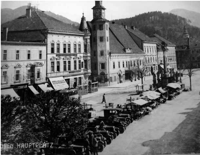
Abbildungen 3a+b: Der Leobener Hauptplatz um 1930; die Stadt Leoben (unten um 1912) wurde im 13. Jahrhundert in einer Schleife der Mur angelegt.