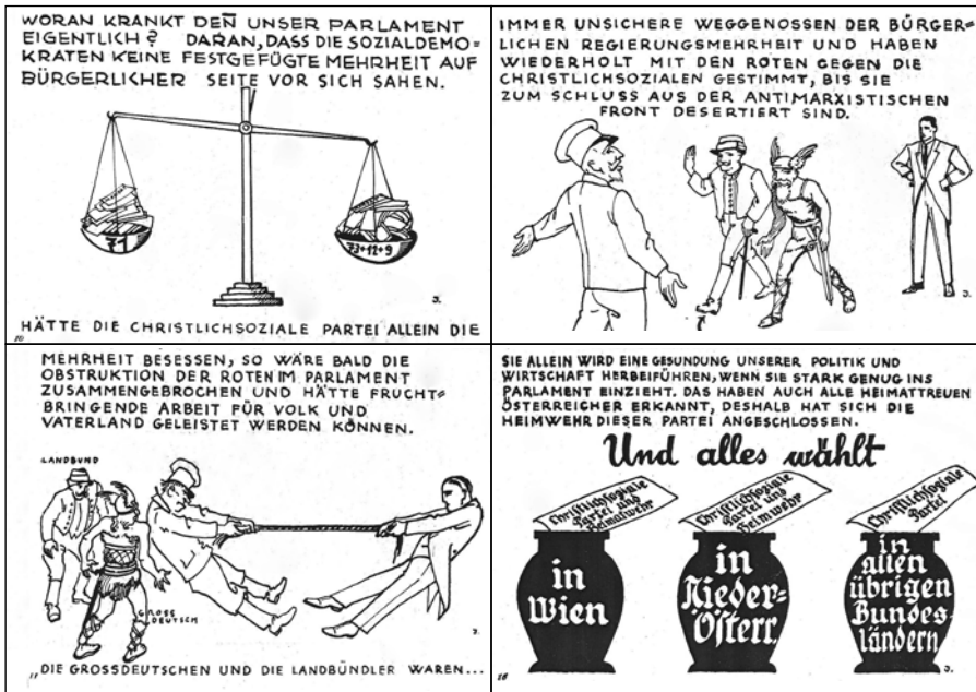
Abbildung 6: Wahlpropaganda der CSP 1930.