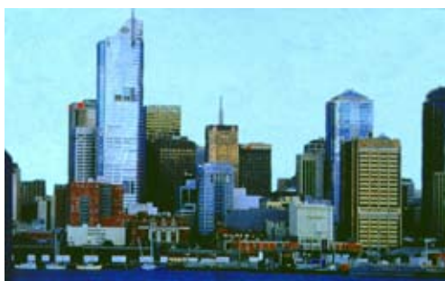
Fig. 8. Melbourne, nel 1999.