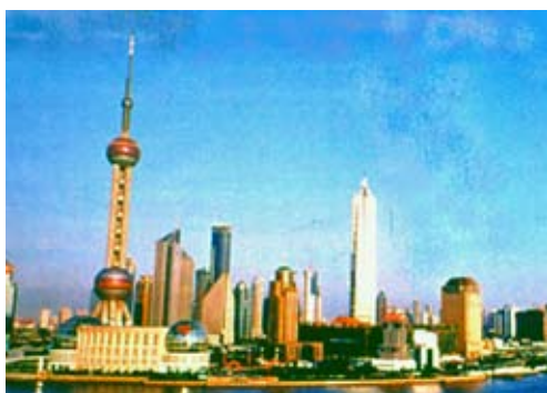
Fig. 7. Shanghai, nel 2002.

un gruppo oligarchico, composta da rappresentanti anche di regioni lontanissime, capaci di organizzarsi sul piano finanziario, tecnico,