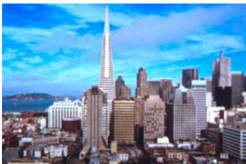
Fig. 4. San Francisco, nel 2003.