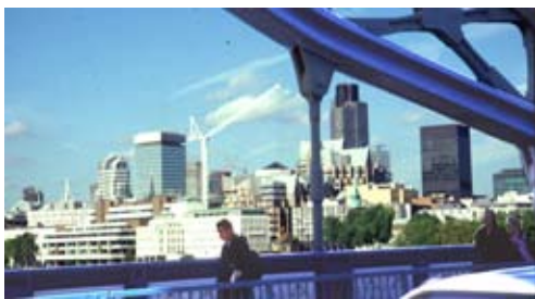
Fig. 3. Londra, nel 2000.

In questo modo, i luoghi – una volta luoghi-città e luoghi-