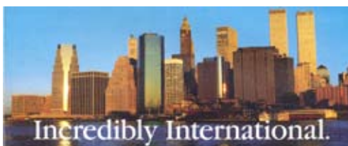
Fig. 1. Incredibly International : Manhattan Skyline, New York (prima dell’11 settembre 2001 con ancora le Twin Towers) - da pagina pubblicitaria del Credit Suisse pubblicata sulla rivista « Newsweek » del 1991.

Contrapposto all’ Incredibly International c’è l’ Incredibly Local che, in questo esempio pubblicitario specifico, è dato da un’immagine dell’ Incredibly Swiss : i monti innevati della Svizzera, appunto (fig. 2). Non una città, o un monumento, o un volto/personaggio