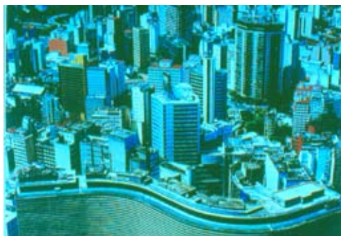
Fig. 9. San Paolo del Brasile, nel 2003.