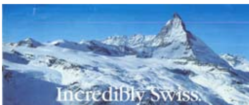
Fig. 2. Incredibly Swiss : Matterhorn (cima del monte), dalla stessa precedente pagina pubblicitaria del Credit Suisse del 1991.