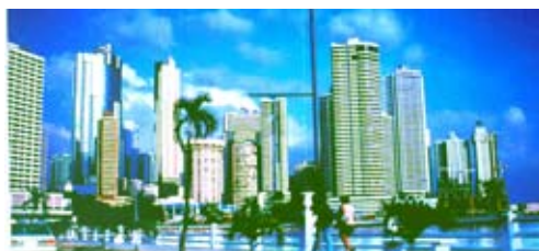
Fig. 5. Panama City, nel 2003.