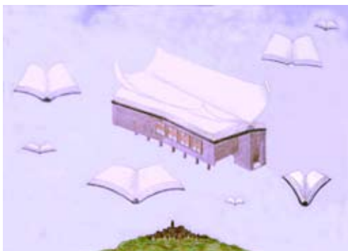
Fig. 13. Cristina Colantonio (studente), disegno critico-esplicativo dell'idea di progetto (per una biblioteca a Sutri) a.a. 2002/03.

Perché, come «la poesia non vola alta e non sormonta la terra con lo scopo di sfuggirla e di dominarla (la poesia è colei che per prima porta l'uomo alla terra, rendendolo appartenente ad essa, e così lo induce ad abitare)», 13 così anche l'architettura non sormonta la