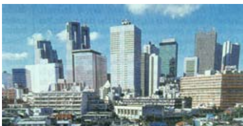
Fig. 6. Tokio, down town e veduta delle torri degli uffici, nel 1991.

linguaggio proposto in quel luogo/occasione di realizzazione, anche se ognuno luogo reale, con proprie precipue caratteristiche fisiche e geografiche, individuali specificità di luce, colore, clima, paesaggio, architettura, storia, linguaggio, relazioni: ma la moderna 'alta tecnologia' è