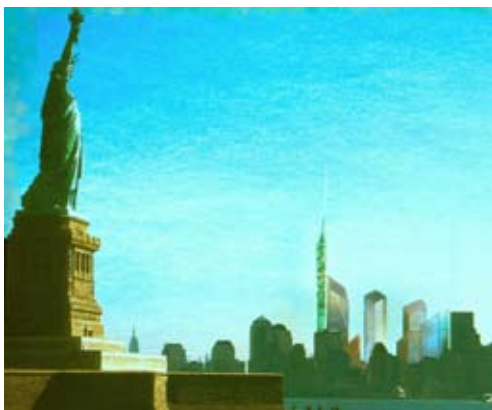
Fig. 12. New York e il progetto di Daniel Libeskind per il Memorial all'11 settembre, 2003.