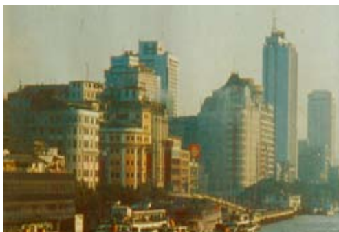
Fig. 10. Hog Kong, 2004.

amministrativo», 10 ma disinteressati a qualunque altra forma di dialogo con il mondo che non sia l'affermazione del loro prodotto.