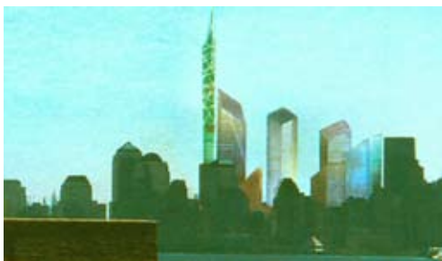
Fig. 11. Daniel Libeskind, Memorial all'11 settembre alle Twin Towers a New York – progetto vincitore al concorso del 2003.

E tutto ciò non può che ripercuotersi, anche, sul mai risolto problema della tutela della memoria – e delle memorie – e delle minoranze – pari opportunità dei luoghi e delle culture alla salvaguardia delle proprie caratteristiche di forma, paesaggio, linguaggio – pur nell'incentivazione vitale verso il nuovo e il progresso.