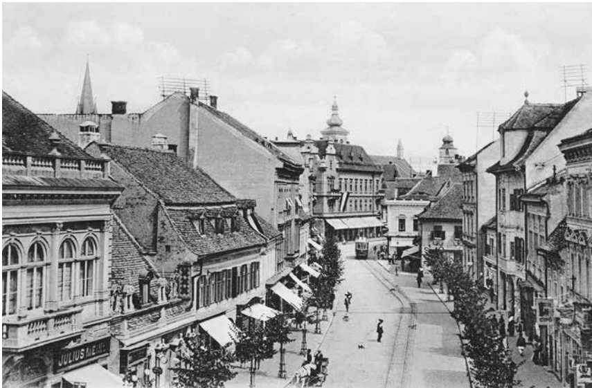
Abb. 2: Hermannstadt: Heltauergasse (mit Straßenbahn) 1915. Kunstanstalt J. Drotleff (Hermannstadt). Quelle: Bildarchiv des Siebenbürgen-Instituts an der Universität Heidelberg, Gundelsheim/Neckar.

Die Ermittlung der Berufsstruktur in den siebenbürgischen Zentren der Ausgleichsepoche und jene des Entwicklungsstandes des Bürgertums erweist sich als schwierig. Quantitative Angaben, die sich auf die jeweilige Kommune und nicht lediglich auf das Komitat beziehen, sind selten; spärlicher noch sind Angaben über eine Verteilung der Berufe nach ethnischen Kriterien. Außerdem sind zwischen 1860 und 1914 bestimmte Berufskategorien mehrmals umbenannt worden. Nicht unproblematisch ist schließlich die Kategorisierung der »bürgerlichen« Berufe. Vorausgesetzt, die siebenbürgischen Zentren konnten eine nachständische, selbstbestimmte und emanzipationsfähige Formation aufweisen, 157 stellt sich die Frage, wer zum Bürgertum gehörte und wer nicht. Zu den Kennzeichen der Bürgerlichkeit zählten im Allgemeinen die Selbstständigkeit, ein stetiges Einkommen, das einen als bürgerlich einzustufenden Lebensstil ermöglichte, eine akademische Laufbahn, das soziale Ansehen, die Berufung auf Leistung und Bildung und letztendlich das Bewusstsein und die Eigenwahrnehmung, zu einer bürgerlichen Gesellschaftsklasse zu gehören. Betrachtet man all diese Zeichen, beschränkte sich das Bürgertum im 19. Jahrhundert auf einen überschaubaren Teil der Gesellschaft bzw. – in Berufs-