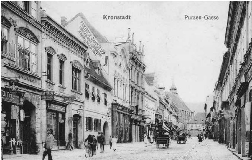
Abb. 3: Kronstadt: Purzengasse 1907. H. Zeidner Verlag (Kronstadt).