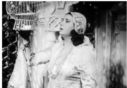
9 a-f WEDAD (Fritz Kramp, ET 1936): Statisch gefilmte Gesangspassagen begeistern Zuschauerinnen und Zuschauer in Ägypten und spalten in Deutschland

galeerenartigen Passagierboot. Während sich Wedad den Schleier vors Gesicht hält und sich suchend umschauf, singen die übrigen Bootsreisenden inbrünstig den Refrain des Lieds «'ala balad el maḥbūb / Bring mich in das Land meines Geliebten» und klatschen im Rhythmus der Musik.