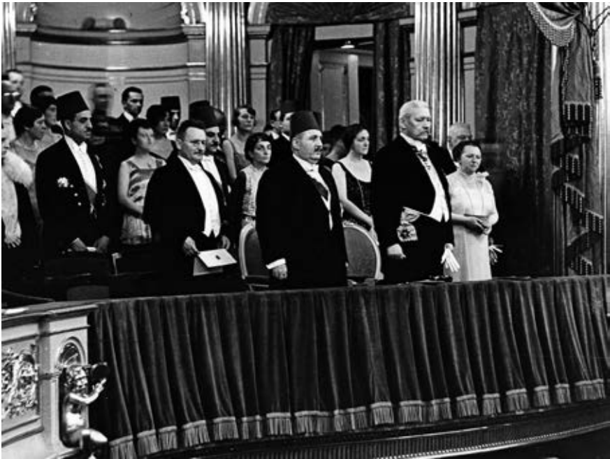
3 Annäherung zwischen Ägypten und Deutschland: König Fuad besucht eine Galavorstellung in der Berliner Staatsoper mit Reichspräsident von Hindenburg (r.) und Reichstagspräsident Paul Löbe (l.), 1929

schen Vertretung in Kairo mündete. Er schreibt, in den Folgejahren hätte es viele Staatsbesuche ägyptischer Politiker in Deutschland gegeben. Diese wären mit dem Ziel nach Deutschland gereist, Handelsbeziehungen aufzubauen und die Voraussetzungen für deutsche Investitionen in Ägypten auszuloten.