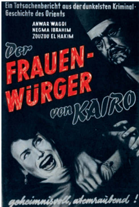
15 a-b RAYA W SEKINA / DER FRAUENWÜRGER VON KAIRO (Salah Abu Seif, ET 1953): ägyptische und deutsche Werbebroschüre