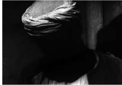
7 a–d WEDAD (Fritz Kramp, ET 1936): Theatralisches Schauspiel und expressionistische Lichtdramaturgie in der Aufopferungsszene

anzunehmen. Er argumentiert, dass Wedad, die an ein luxuriöses Leben gewöhnt sei und nun unter Bahirs Bankrott zu leiden habe, verkauft werden müsse, damit sie dem Elend entkomme.