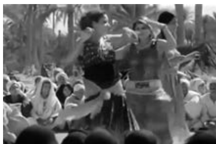
14 a-d DURCH DIE WÜSTE (Johann Alexander Hübler-Kahla, D 1936): Der Film mischt kammerstückartig inszenierte Szenen mit ethnografisch anmutenden Aufnahmen

melmusik, die die Authentizität der visuellen Darstellung unterstützt. Ein Düsseldorfer Filmkritiker, der insgesamt die fehlende Spannung des Films bemängelt, beschwert sich, der Film sei «streckenweise in den Rang eines Kulturfilms erhoben» ( Der Film , 22.02.1936) worden. An anderer Stelle lobt er indes «die Lust und Leidenschaft, mit der die orientalische Komparserie bei der Sache war» (ebd.). Deren unverfälschtes Auftreten schien allerdings nicht auszureichen, um einen groben Fauxpas in puncto Authentizität wettzumachen, den ein Mitarbeiter des Filmdienst 13 Jahre nach der Erstaufführung kritisiert: