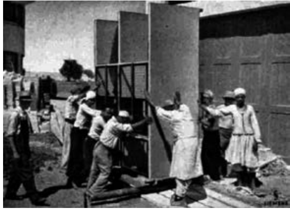
6 «Beförderung eines Teiles der Hochspannungszellen», aus Siemens-Zeitschrift 11, 1937

dass es mangels einer modernen Infrastruktur – auf dem späteren Studio- gelände am Rande der Wüste existierten weder ausgebaute Straßen noch ein Stromnetz – eine logistische Meisterleistung darstellte, ein solches Großprojekt zu realisieren. Nachdem diese beiden Berichte die technische Zusammenarbeit mit Deutschland, wenn auch unterschiedlich gewichtet, herausgestrichen haben, ist es interessant zu betrachten, wie die mir vor- liegenden ägyptischen Berichte die Studioeröffnung schildern.