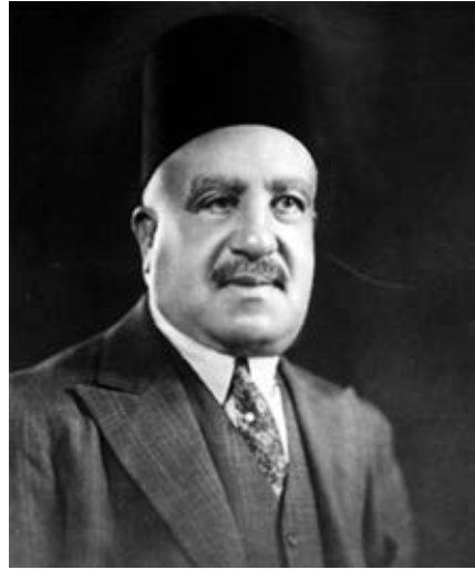
4 Talaat Harb (1867–1941), undatiert