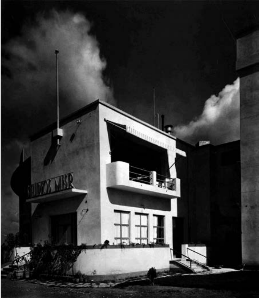
5 Stolz präsentiert Siemens das neu erbaute Studio Misr, aus: Siemens-Zeitschrift 8, 1936

In der November-Ausgabe des Jahres 1937 findet sich in der Siemens-Zeitschrift ein mehrseitiger Bericht über die technische Ausstattung des Studio Misr. Darin heißt es, es sei in den deutschsprachigen Medien euphorisch über die Eröffnung des Studio Misr berichtet worden, dabei sei allerdings die Schilderung der technischen Besonderheiten des Studios vernachlässigt worden ( Siemens-Zeitschrift , 11/1937). Die ausführliche Schilderung versteht sich als eine Ergänzung zur Berichterstattung in der Tages- und Fachpresse. Zunächst zählt der ebenfalls anonyme Autor die dem Studio zugehörigen Bauten auf, darunter die moderne Zentrale, die Garagen, Werkstätten, die beiden Tonfilm-Ateliers sowie die Umformerstation des Studios,