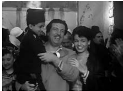
17a-f RAYA W SEKINA (Salah Abu Seif, ET 1953): Parallelmontage und spannender Showdown mit Happy End

denmitglieder verhaften und seinen Ermittlungserfolg von den applaudierenden Schlachthof-Angestellten vor dem Haus feiern lassen. Dabei trägt er Soads stolzen kleinen Bruder, der zur Rettung beigetragen hat, auf dem Arm. Dieser sagt zu Yusry, jetzt habe er es verdient, seine Schwester zur Frau zu nehmen. In der allerletzten Einstellung ist ein Schattenwurf der erhängten Schwestern Raya und Sekina zu sehen.