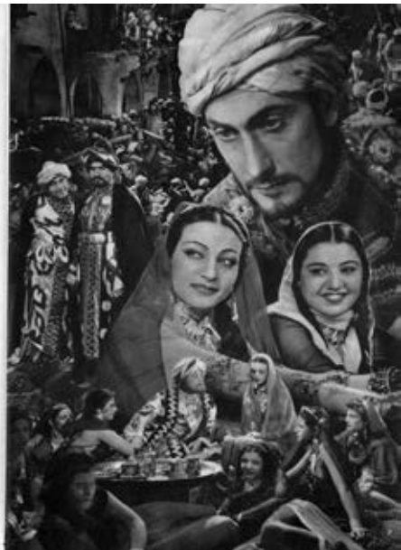
13 VERRÄTER AM NIL (Fritz Kramp, ET 1938) als «Sinnbild des Kampfes» gegen die Briten, aus dem Presseheft der Ufa 1941

in einen «mode moralisant» (ebd.) um, dessen Zweck es ist, Wertmaßstäbe zu kommunizieren. Der Film LASHIN wird so von der deutschen Filmkritik, die durch die Propaganda des Dritten Reichs bereits auf die Befreiung Ägyptens