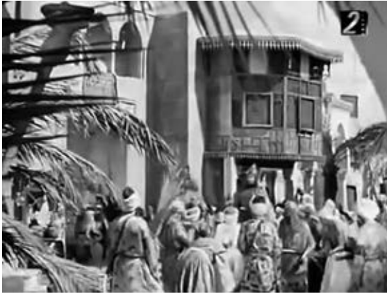
2 LASHIN (Fritz Kramp, ET 1938): Viele aus dem Fernsehen abgefilmte arabische Filmklassiker sind mit Senderlogo bei Youtube zu finden