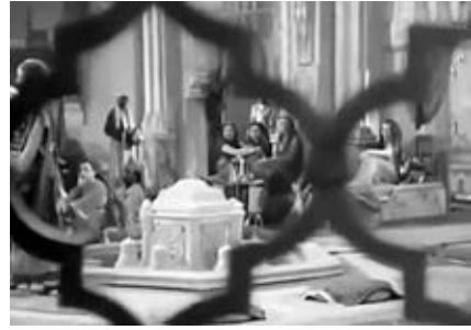
11 a–b LASHIN (Fritz Kramp, ET 1938): Unterschiedliche Blickführungen. a: Frauen aus Lashins Harem als aktiv Sehende und Handelnde inszeniert; b: Frauen im Harem des Sultans werden als Objekte dargestellt

schen Blick des Sultans, Eunuchen oder eines anderen männlichen Palastbewohners. Während der Harem Lashins als durchlässiger Raum, der von Subjekten bewohnt wird, charakterisiert ist, gleicht der Wohnbereich der Frauen des Sultans, die nicht durch die Gitter gefilmt werden und nicht zurückschauen, einem undurchdringbaren Raum, einem Gefängnis. Der Film stellt also dar, dass – entgegen abendländischer und US-amerikanischer Klischees – eine Bandbreite unterschiedlicher Harems existierte. Ich vermute, dass dies einer der Aspekte war, der den Kritiker al Sharbini dazu bewog, die Haremsdarstellungen als authentisch zu erachten.