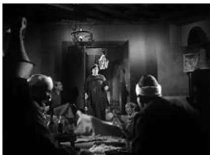
19a-d RAYA W SEKINA (Salah Abu Seif, ET 1953): In den hellen, ordentlichen Räumen der Mittelschicht herrschen Tugend und Anstand, in den dunklen Behausungen der Unterschicht blüht das Laster

Bedingungen erinnern an Foucaults Überlegungen zum Panoptikum, dessen «wichtigste Funktion [...] darin bestanden habe, zusammen mit den Disziplinen nicht nur die moderne Seele, sondern überhaupt das Subjekt der Aufklärung und damit das neuzeitliche Individuum der Aufklärung zu generieren», wie Sarasin zusammenfasst (Sarasin, 2005, 142). Doch, wie erwähnt, kann eine tugendhafte junge Frau, die versehentlich in solche Sphären gerät, so suggeriert es zumindest der Film, durch die Polizei gerettet werden. Der Film betreibt auch hier eine «Rückprojektion»: Die Einwohner*innen der späten 1910er- und frühen 1920er-Jahre sind bereits «moderne Seelen», die sich in der Transparenz ihrer Umgebung nur moralisch verhalten können, während in der Unübersichtlichkeit der dunklen Räume das Verbrechen blüht.