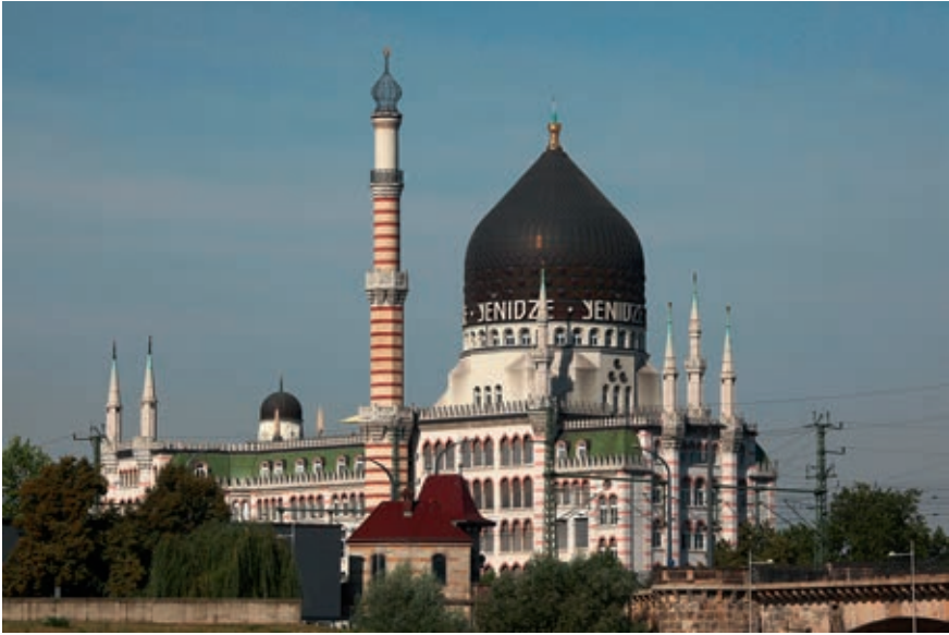
12 Die Dresdner «Tabakmoschee» Yenidze: Ein Hauch von Tausendundeiner Nacht

des Orientalismus vertraut waren, die Bauten sowie Dekors und Kostüme des Films als Zeichen des «Märchenhaften und Sinnlichen» wahrnahmen. Somit unterschied sich ihr sinnliches Erleben der Filmarchitektur und anderer Ausstattungselemente mit hoher Wahrscheinlichkeit von der Art und Weise, wie ihre ägyptischen Kollegen, für die der architektonische Historismus einen Hauch von Unabhängigkeit verströmte, diese empfanden.