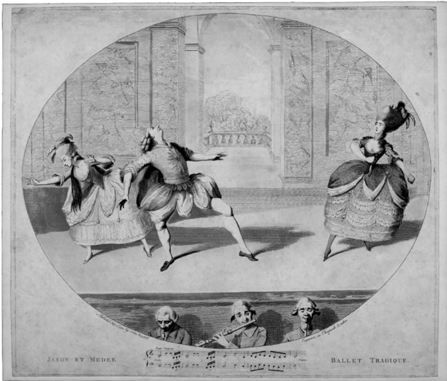
Abb. 9: Jason et Medée , Stich von Francesco Bartolozzi (1781).

Auch wenn Plassard diesen Stich nicht weiter quellenkritisch kommentiert: Die gestische Koinzidenz zwischen der darin abgebildeten dezentrierten Arm- und Körperhaltung Vestris' und der von Herrn C. beschriebenen tänzerischen Aktion der Tänzerin P. ist auffällig. Von besonderem Interesse ist dabei der Hinweis der Tanzwissenschaftlerin Sabine Huschka, die in Bezug auf ebendiesen Stich darauf aufmerksam macht, dass das Ballett Jason et Medée im Zuge einer ab den 1770er-Jahren wachsenden Kritik an Noverre eine zunehmend parodistische Rezeption erfahren habe. 423 Dieser «durchaus [...] mit der Couleur des Komischen [überzeichnete]» 424 Stich lässt sich also durchaus als bildhistorische Quelle ebenjener parodistischen Rezeption der pantomimischen Darstellungskonventionen des Ballet en action ansehen, wie Plassard ihn verwendet. Zugleich erweist sich damit der erwähnte Hinweis Gunhild-Oberzaucher-Schüllers, Kleist referiere mit der Figur des Herrn C. auf einen sich ab Mitte des 18. Jahrhunderts langsam vollziehenden Paradigmenwechsel von den