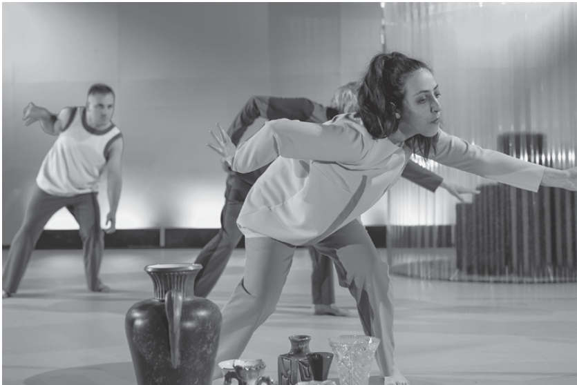
Fig. 19: Die Butterblumen des Guten , 2019 (G. Hartmann/M. Clausen)

Bewegungen, Tanz etc. miteinschließt. Dieser Text bearbeitet sich insofern selbst, als alle Akteure mit ihren Aktionen das Geflecht ständig verändern. Individuelle Autorenschaft löst sich damit wohl nicht komplett auf, wird aber nebensächlich und unwichtig. Vielteiligkeit und Vielstimmigkeit sind das Ziel, Diversität im besten Sinn, als eigensinniger Beitrag zur allgemeinen kulturellen Debatte. In einem gesellschaftlichen und künstlerischen Labor, als das Theater Thikwa sich versteht. Nicht mehr und nicht weniger.