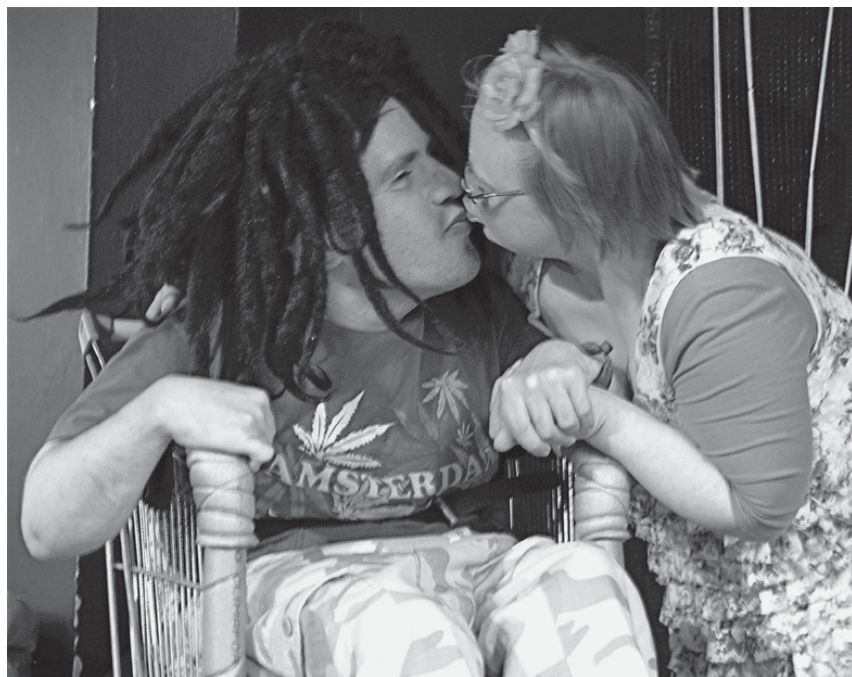
Fig. 12: Crazy Sommernachtsträume , 2008 (A. Eggers) © Kirsten Heer.