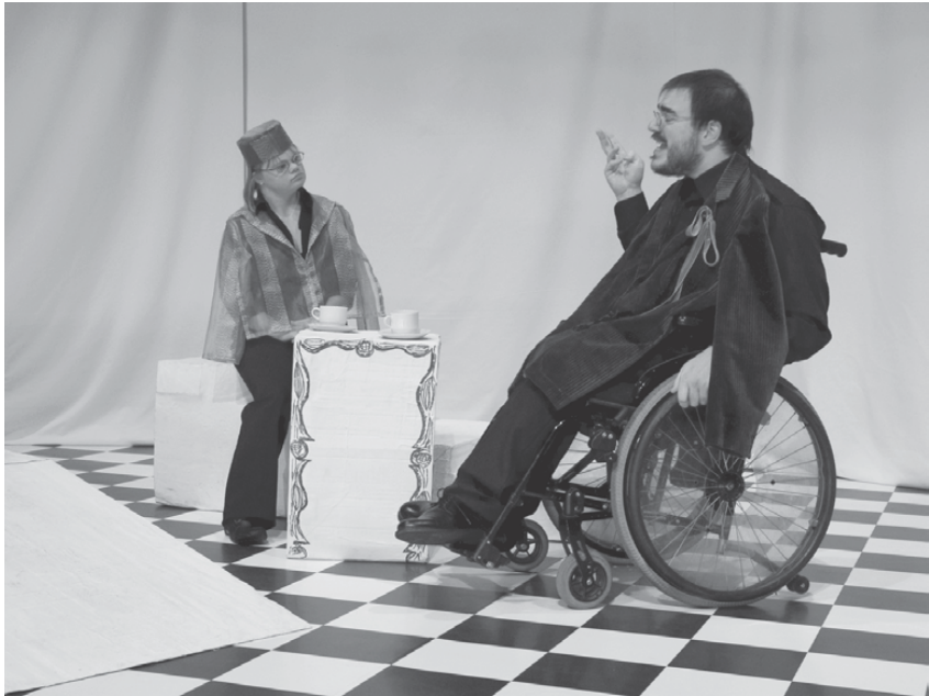
Fig. 13: Andersisches Kaleidoskop , 2004 (A. Eggers) © Astrid Eggers.

Alle krank geprobt. Einige Schauspieler:innen hielten online Kontakt miteinander. Aber das konnten nicht alle. Es war schon schwer, einige waren ganz allein zu Hause, zwei zogen wieder bei den Eltern ein. Erst Ende Juni fanden wieder Proben statt. Die Räumlichkeiten wurden stark verändert. Jede/jeder brauchte mehr Platz um sich herum. Im September gab es die Möglichkeit, Alle krank aufzuführen. Es wurde im Zuschauerraum gespielt, für die Zuschauer würde eine Tribüne mit Platz für maximal 20 Personen gebaut – in einem Raum, in den normalerweise achtzig Zuschauer passen.