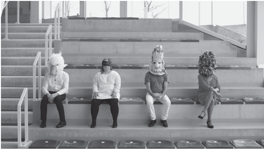
Fig. 6: Madisoning , 2018 (A. Poirier) © Justine Pluvinaige.

The training process lies at the heart of L'Oiseau-Mouche and is often inseparable from the company's creation process: artists are invited to give workshops to the group's actors, which is incidentally where the journey of future projects has often begun. These workshops are also the meeting point of long-term-employed actors and newcomers. The training program is centred around three elements: dancing, object theatre, and hybrid forms or music. Plastic and visual arts blend in theatre in a transdisciplinary manner.