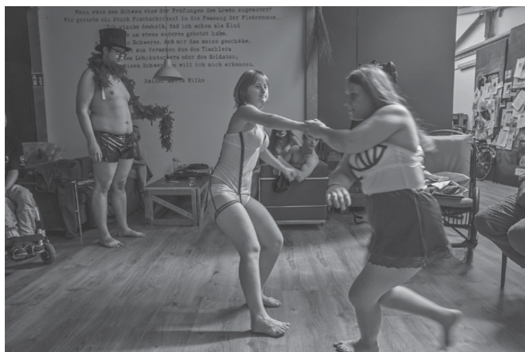
Fig. 26: Rehearsal of Un peep show per Cenerentola , 2020 (A. Viganò) © Vasco Dell'Oro.