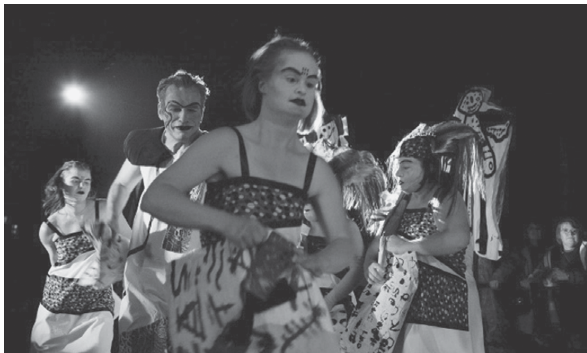
Fig. 15: Der Frieden , 2010 (G. Höhne).

inkluisiven Theaters von großem Wert. Sie könnte beim Aufbau entsprechender Studiengänge von großem Nutzen sein. Aber auch die Frage: Was müsste sich in den vorhandenen Strukturen der großen Institutionen ändern, dass Künstler:innen mit kognitiven Behinderungen ein selbstverständlicher und kompetenter Teil einer künstlerischen Struktur sein können?