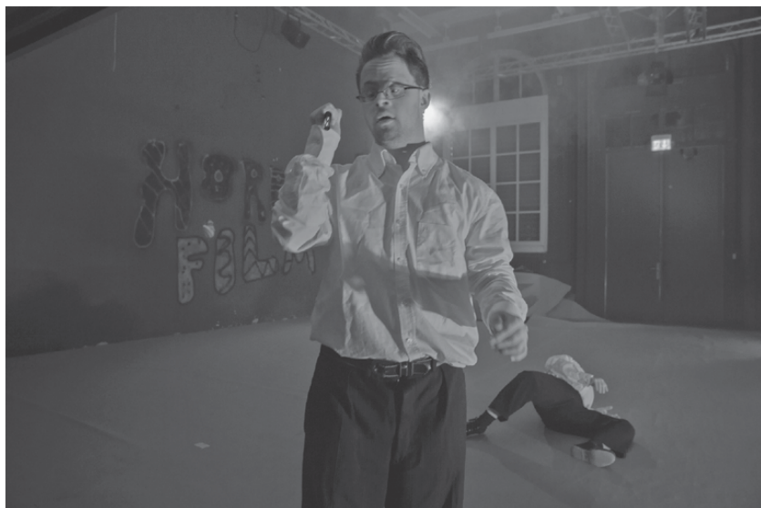
Fig. 36: Randen Saft Horror , 2016 (T. Pagliaro) © Niklaus Spoerri.