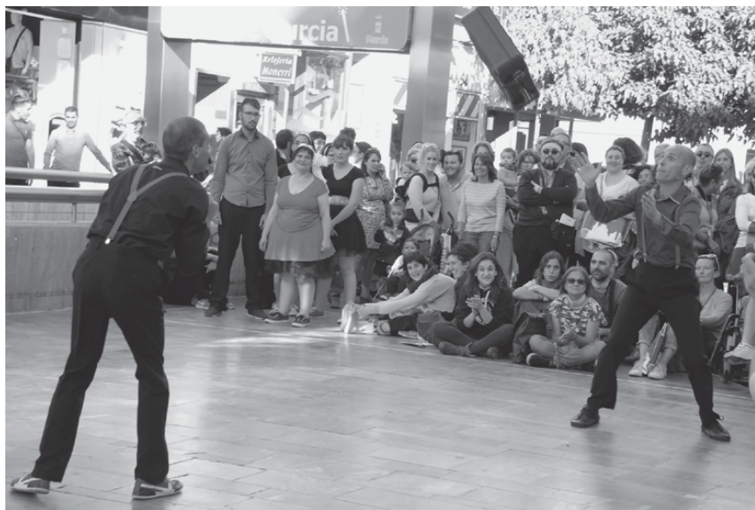
Fig. 29: Viájame , 2018 © Angel C. Santos.