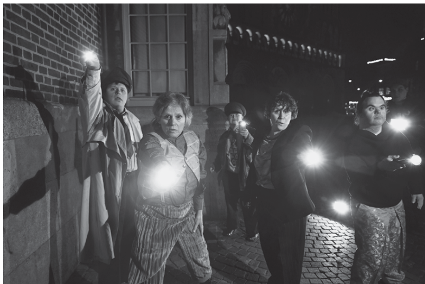
Fig. 10: Unfassbar , 2021 (B. Weste/M. Pollkläsener)