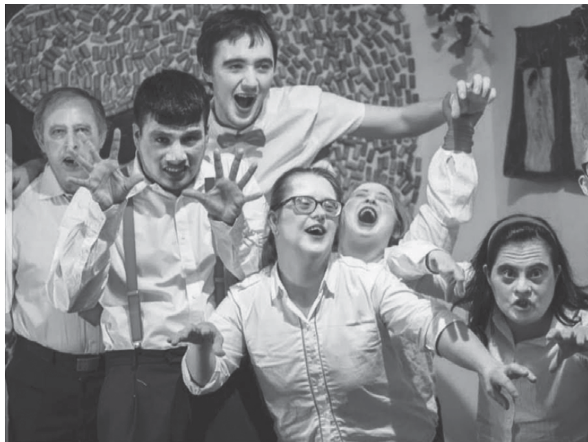
Fig. 30: Palmyra Teatro – Asociación ARGADINI © Jorge Gimeno Barrón.

Palmyra Teatro aims at sensibilizing university as well as school students in order to raise awareness and support for the theatre's vision: a cultural and scenic vision of theatre art, available and enjoyable by all audiences and without excluding people with disabilities. By catering to the diversity and personal vision society consists of, every show is converted into an improvement for said. This way, leisure and culture are interwoven in a universal human dimension.