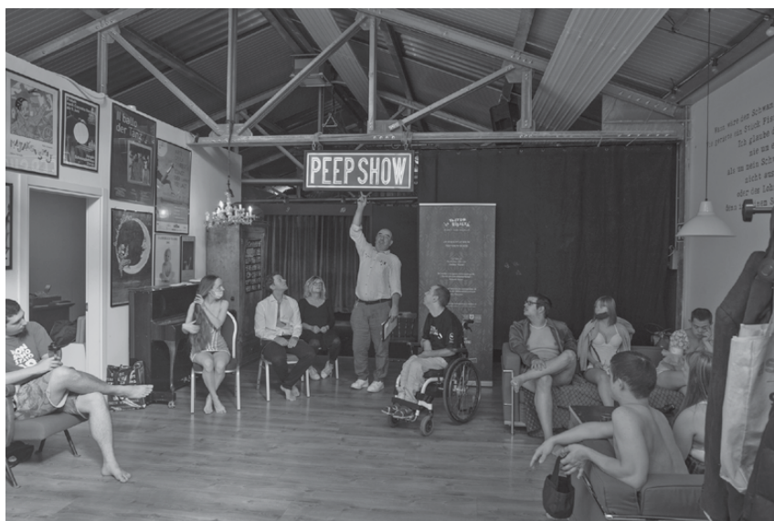
Fig. 27: Rehearsal of Un peep show per Cenerentola , 2020 (A. Viganò) © Vasco Dell'Oro.

E quando tutto è pronto si va in scena davanti al pubblico con serietà ed entusiasmo ed inizia anche la tournée che non solo è il momento più importante dal punto di vista artistico ma anche dal punto di vista sociale. È una comunità che vive e lavora e viaggia assieme.