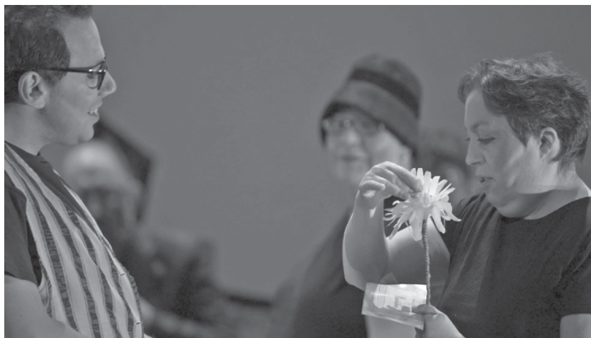
Fig. 31: ENKI Teatro (ENKI Inclusión + Cultura) – Asociación ENKI