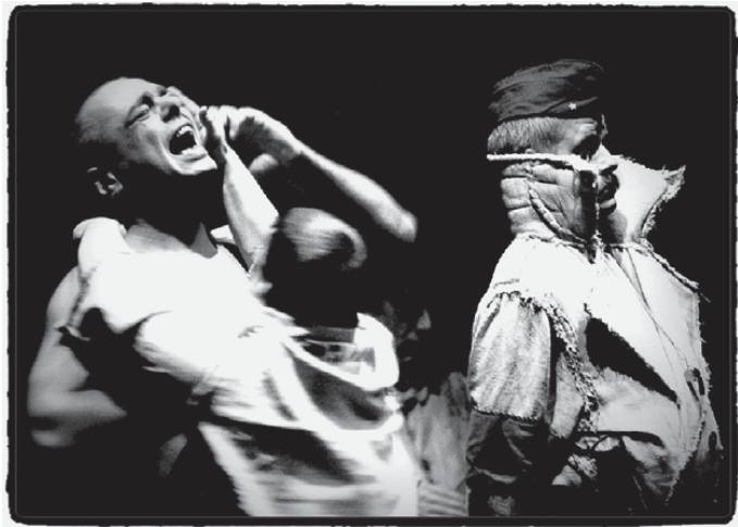
Fig. 5: Zoll , 2003 (M. Géniaux/Ph. Flahaut).

Philippe Flahaut : Très belle question. Puisque c'était formation professionnelle, les comédiens en France ont pu venir en présentiel. En visioconférence, je n'ai pas voulu travailler parce que le théâtre, c'est vivant. Moi, je me suis dit : « Bon, ils peuvent me téléphoner quand ils veulent pour dire 'Je vais bien, je ne vais pas bien', mais travailler le théâtre, c'est complètement impossible ». Et j'étais assez furieux de voir des collègues qui faisaient des spectacles de théâtre en visio pour vendre. Nous, on n'a pas joué. Mais le 19 mai, on recommence.