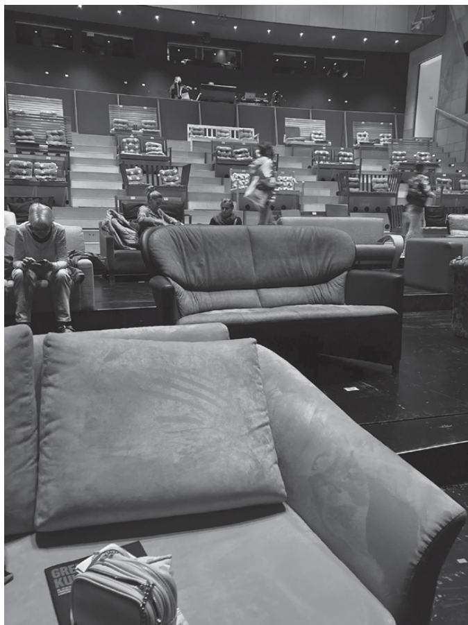
Fig. 1 Blick auf das Parkett in der Der Ring von RambaZamba beim Grenzenlos-Festival.