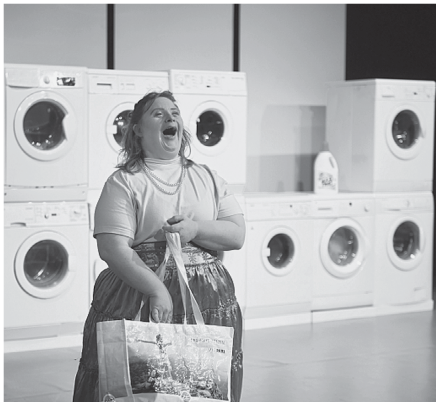
Fig. 11: 30°60°90° – Blaumeiers theatrale Betrachtung der Zeit , 2019 © Marianne Menke.