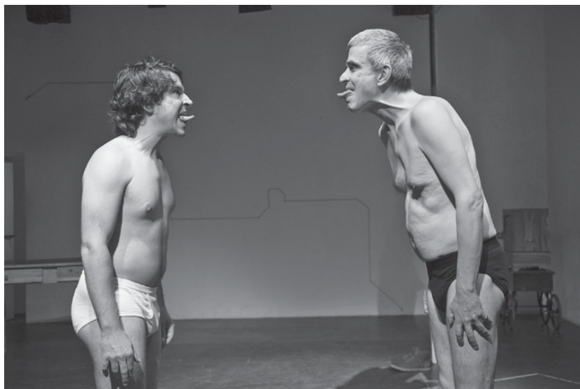
Fig. 18: Subway to Heaven , 2014 (G. Hartmann) © David Baltzer.