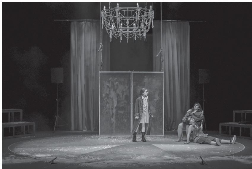
Fig. 4: Cendrillon , 2017 (J. Pommerat/Ph. Flahaut) © G.Zinanovic.