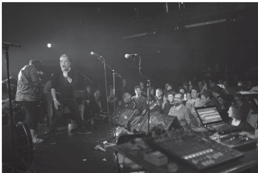
Fig. 7: Humming Dogs , 2017 (D. Bausseron)