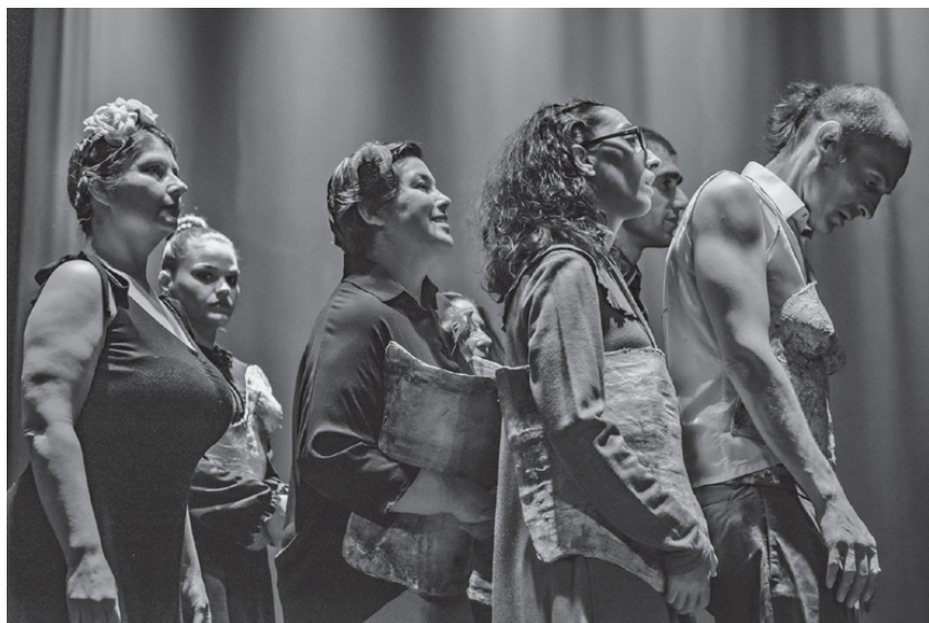
Fig. 28: Y me busco , 2020 (J. Martínez Lorca/S. Olmo Bau)