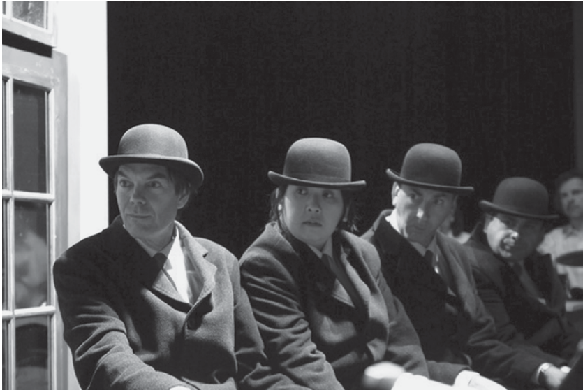
Fig. 8: Le dernier cri , 2009 (O. Couder)