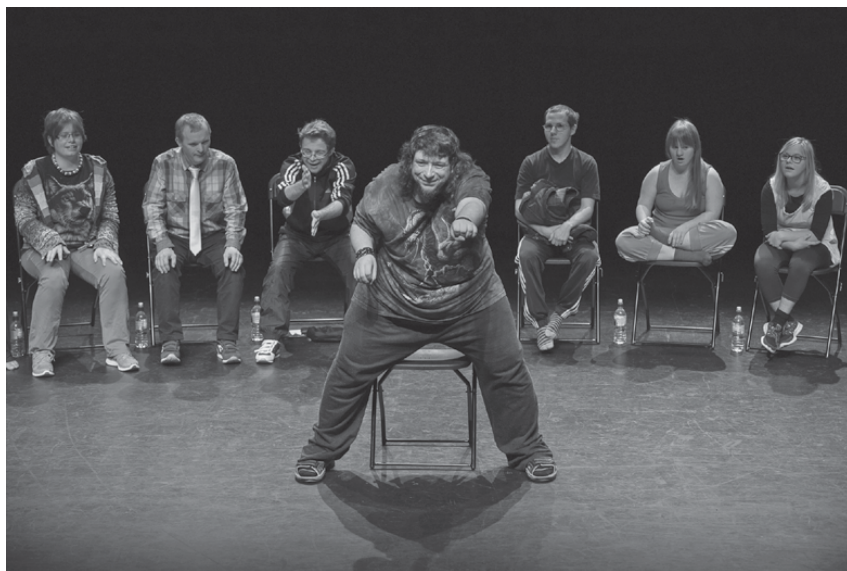
Fig. 37: Disabled Theater , 2012 (J. Bel)

Remo Beuggert: Hoffentlich freut es auch sie.