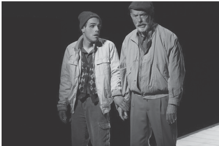
Fig. 9: Les missions d'un mendiant , 2015 (R. Leteurtre/O. Couder) © Anne Gayan.

particulier et construire à partir de là. Ensuite, il m'apparaissait évident qu'il fallait avoir la même exigence qu'avec n'importe quel acteur."