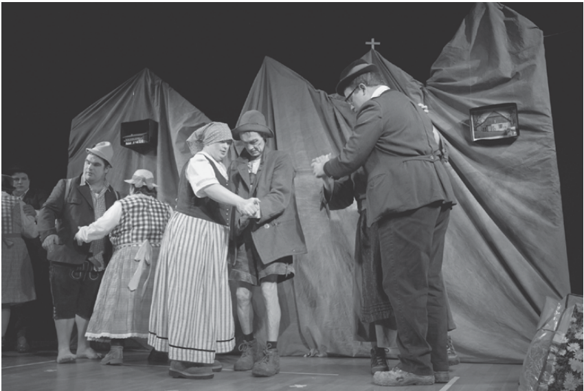
Fig. 16: Muuuh!