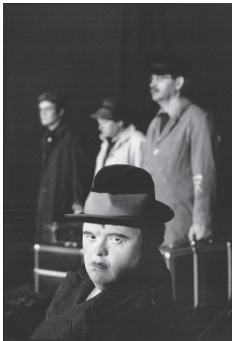
Fig. 17: Abfahrt 28.76 Uhr