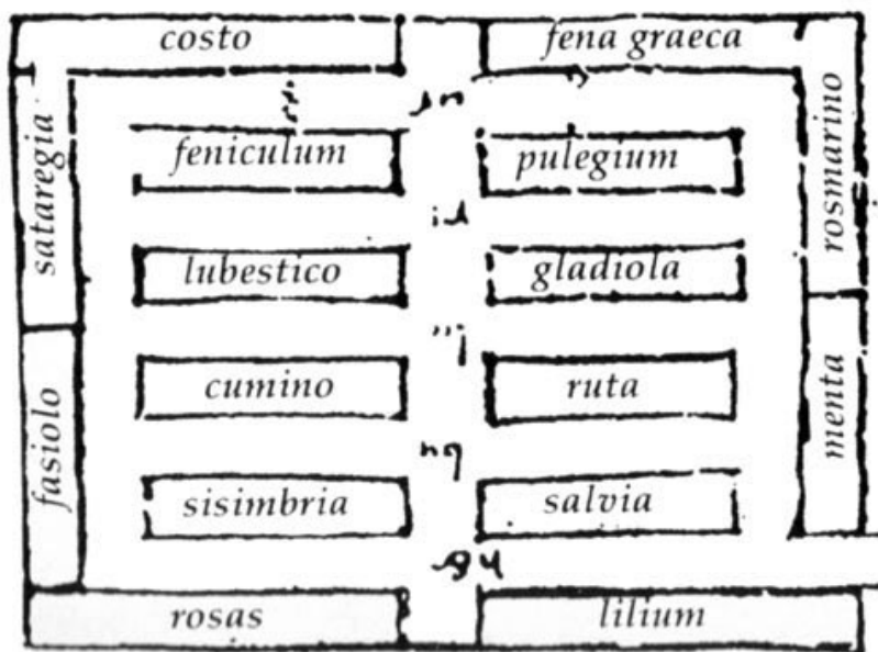
Figura 6. Herbularius, particolare (elaborazione) dalla planimetria dell'Abbazia di San Gallo (v. Fig. 5).

( domus medicorum et mansio medici ipsius ) - vi sono 8 aiuole laterali dove si coltivano i gigli, le rose, i fagioli, la santoreggia, il costo, la trigonella o fieno greco, il rosmarino e la menta; più al centro altre 8 aiuole con la salvia, la ruta, i gladioli, il puleggio o mentuccia, la sisimbria (forse menta acquatica), il cumino, il levistico o sedano di monte e il finocchio 12 . Nell'orto, le specie edibili sono distribuite in 18 rettangoli che accolgono: agli, scalogni, prezzemolo, cerfoglio, lattuga, crescione, carote, cavolo, nigella, cipolle, porri, sedano, coriandolo, aneto, papavero sonnifero, rafano, papavero, bietole.