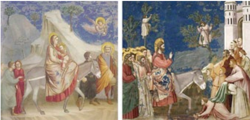
Giotto, La fuga in Egitto (1303-1305 circa), Padova, Cappella degli Scrovegni.

Emergono sensazioni di sicurezza e tranquillità fuori dalle mura come vediamo nel disegno in cui Boccaccio rappresenta la lieta brigata che ritorna nella città di Firenze: i giovani serenamente si possono spostare per recarsi in altri palazzi, o in altri luoghi.