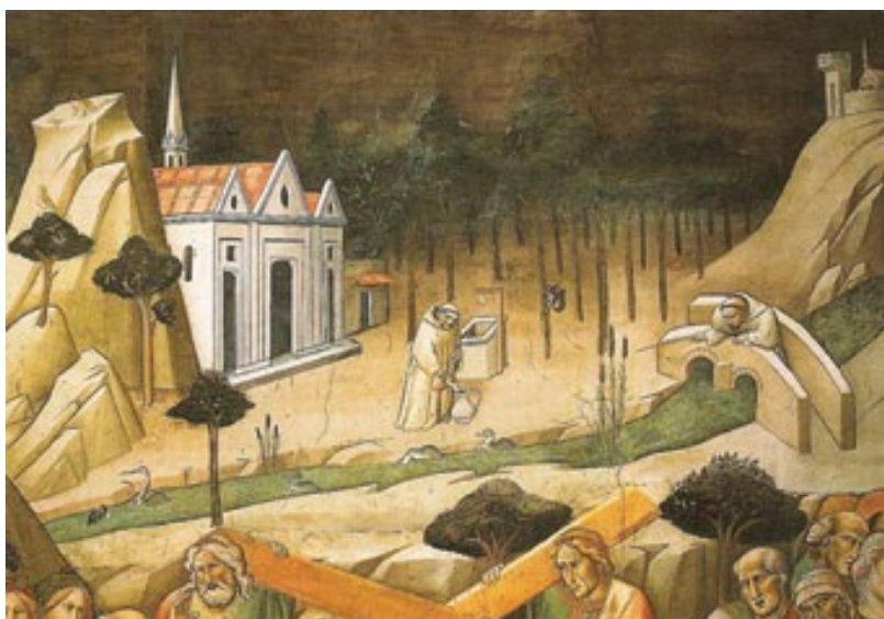
Agnolo Gaddi, Il ritrovamento della Vera Croce , metà XIV sec., Chiesa di Santa Croce, Firenze.