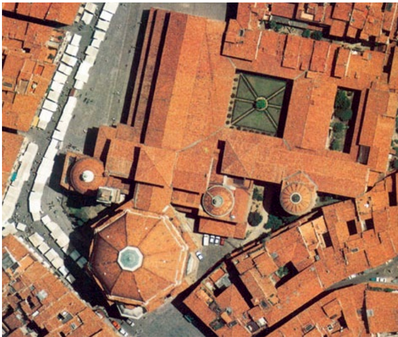
Figura 3. San Lorenzo, Firenze (foto aerea).

A destra: Figura 2. Il chiostro di Ognissanti, Firenze.