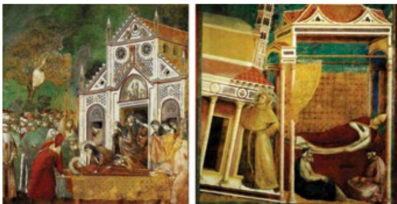
Giotto, Il pianto delle Clarisse (1290-1295 circa), Assisi, San Francesco, Basilica S.

Agostiniani, Carmelitani e Serviti (o Servi di Maria), risiedendo nella città diventarono portatori di pace e collaborazione fra le diverse classi sociali. Le loro regole imponevano l'assenza di proprietà fondiaria e quindi vivevano nelle città, e seppur appartenenti a diversi ordini, agivano non isolatamente ma di comune accordo, dividendosi lo spazio urbano in settori utili per chiedere le elemosine senza entrare in concorrenza.