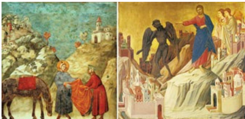
Giotto, Il dono del mantello (1290-1295 circa), Assisi, Chiesa di San Francesco, Basilica superiore.

Duccio di Buoninsegna, Tentazione di Cristo (1308-1311), New York, Frick Collection.