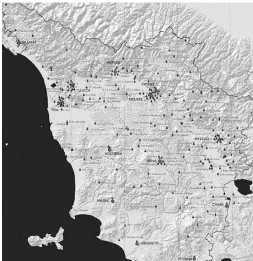
Figura 1. La distribuzione degli Enti monastici in Toscana fra 1295 e 1304.

Un altro dato che emerge a livello qualitativo - ovvero senza bisogno di andare a scomodare le formule analitiche della geografia quantitativa - è come la rete dei monasteri andasse ad occupare l'intero arco appenninico. Di 223 luoghi, qualcosa come più di 150 siti si trovano nell'arco settentrionale tra Luni e Chiusi.