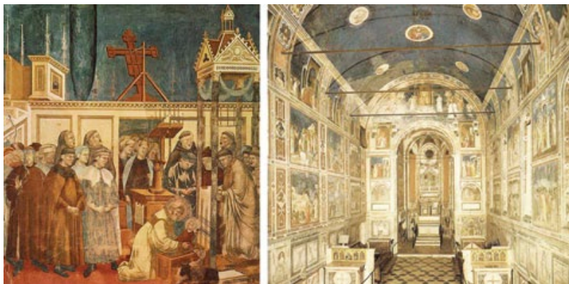
Giotto, Il Presepe di Greccio (1290-1295 circa), Assisi, San Francesco, Basilica superiore. (In quest'opera Giotto si esprime con una sapienza compositiva nuova, nella creazione dello spazio, architettonico o paesistico, e in un più preciso rapporto fra questo spazio e le figure). Giotto, Cappella degli Scrovegni (1303-1305 circa), Padova.

Lo sviluppo economico aveva stimolato un aumento delle attività, dei commerci, dei mercati, dei porti, dei contatti con luoghi anche lontani, portando uno scambio di tecniche e conoscenze.