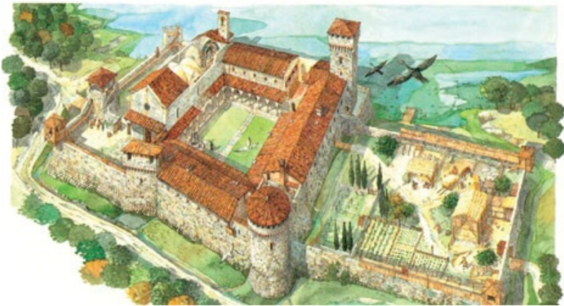
Figura 4. San Leonardo (Siena) alla fine del XIII secolo; disegno di M. Tosi in MORETTI, NENCI, PINTO 2003.

Più o meno negli stessi anni, San Teilo (512-563) pianta un frutteto vicino a Dol in Inghilterra, del quale si hanno notizie ancora dopo 500 anni. E, nondimeno, siamo di fonte ad imprese ‘eroiche’, tanto che ancora nel VII secolo, abbattere un bosco per realizzare un orto/giardino è considerata un’impresa così eccezionale da valere la santità: è il caso di Saint Fiacre, oggi protettore degli orti e giardini di Francia, che per costruire il giardino del suo monastero a Breuil, non lontano da Maux, abbatte appunto una foresta.