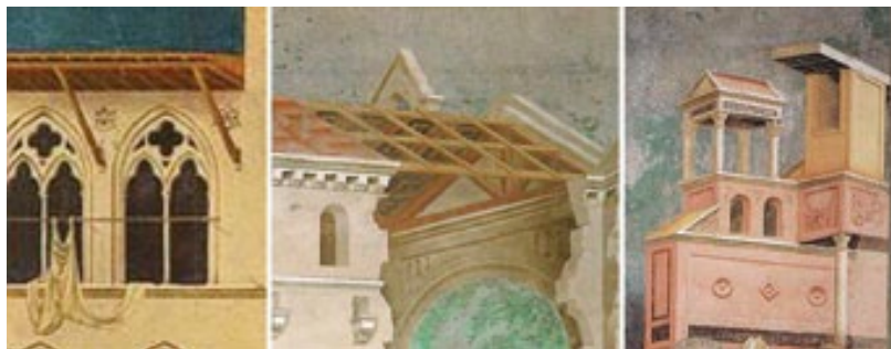
Giotto, L'omaggio dell'uomo semplice (1295 circa), Assisi, San Francesco, Basilica superiore.

La città si sviluppava grazie a nuove strategie urbane, agli strumenti di gestione, alle modifiche degli elementi costitutivi primari (le mura, le strade, le piazze, le case, le attrezzature). Emerge qui un nuovo tipo di cultura urbana, con una precisa caratterizzazione degli spazi fisici. Vi è un'attenzione rinnovata per l'architettura con la realizzazione di imponenti progetti grazie all'elevato livello di concentrazione di ingenti capitali. Il rifacimento del perimetro murario cittadino avveniva sia per un accrescimento fisico dell'abitato, sia anche che per le nuove esigenze difensive. Oltre alle mura, anche i palazzi municipali avevano grande importanza, ed erano espressione di orgoglio civico.