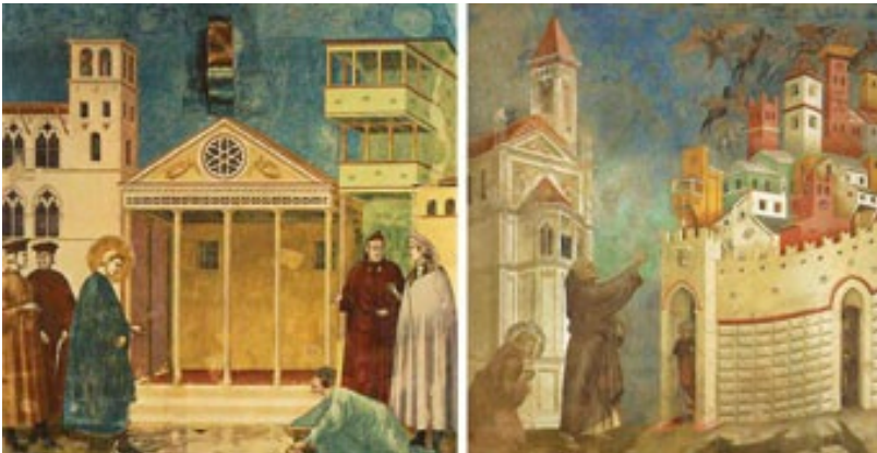
Giotto, L'omaggio dell'uomo semplice (1295 circa), Assisi, San Francesco, Basilica superiore.

La rinascita economica, lo sviluppo della libera concorrenza, la nascita della prima organizzazione bancaria, l'emancipazione della borghesia urbana, derivano dal nuovo modo di pensare e vivere. Il mondo cittadino, nelle rappresentazioni, appare in movimento e pieno di energie.