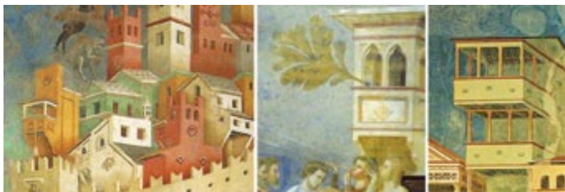
Giotto, La cacciata dei diavoli da Arezzo (1290-1295 circa), Assisi, San Francesco, Basilica superiore. Giotto, Corteo Nuziale (1303-1305 circa), Padova, Cappella degli Scrovegni. Giotto, L'omaggio dell'uomo semplice (1295 circa), Assisi, San Francesco, Basilica superiore.

Nel paesaggio urbano e rurale risaltavano elementi della vita collettiva e individuale, l'armonia dell'insieme e la sottolineatura del dettaglio. Gli edifici erano sviluppati in altezza ed avevano in cima ampie finestre o l'ogee, che davano la possibilità di guardare il paesaggio fuori dalle mura. Gli sporti, diffusi all'inizio del Trecento, che consentivano l'ampliamento delle abitazioni ai piani alti, erano delle parti aggiunte a sbalzo rispetto alla sagoma degli edifici e poggiavano su sostegni infissi obliquamente in apposite aperture nei muri; vi erano anche delle mensole di pietra, che dovevano garantire la resistenza al peso dell'ampliamento. Tali sporti toglievano aria e luce alle strade già di per sé strette. Se non vi erano sporti, a volte si trovavano davanti alle case dei balconi di legno o delle terrazze, come vediamo ne L'omaggio dell'uomo semplice : nell'edificio verde notiamo l'ardita costruzione di due balconi sovrapposti, e in quello più in alto si può addirittura ammirare il soffitto cassettonato. Gli edifici vicini, appartenenti alla stessa famiglia o confraternita, erano collegati solitamente da ponti di legno 3 .