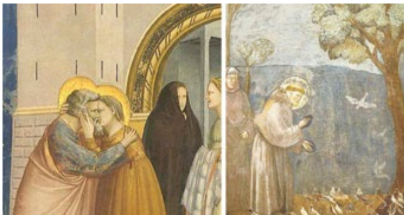
Giotto, Incontro di Gioacchino e Anna alla Porta Aurea (1303-1305 circa), Padova, Cappella degli Scrovegni.

La ricchezza culturale del periodo deve la sua grandezza anche agli occhi attenti dello spettatore. Gli artisti consapevoli dell'epoca di cambiamento che stavano vivendo, riscoprono nel loro lavoro la forza di essere comunicatori e diffusori di una società aperta nei confronti della realtà e del mondo intorno. Ciò si riconosce nei gesti descritti, nei luoghi dettagliatamente ritratti e nelle rappresentazioni fisiche e spirituali che trasmettono una vera e propria scoperta emotiva. L'uomo racconta emozioni che coinvolgono e testimoniano quotidianità e spiritualità. Le mani di San Francesco che offrono cibo agli uccelli, il dono del mantello al povero o la dolcezza del bacio fra Gioacchino e Anna (il primo bacio ad essere rappresentato nella storia dell'arte) avvicinano il fedele alla vita reale: le immagini hanno una prospettiva religiosa che segue il pensiero francescano e i gesti vengono rappresentati nella terra, lì dove sono avvenuti. Scompare il fondo d'oro, il cielo acquista il suo colore naturale, e anche il paesaggio viene mostrato in tutta la sua concretezza.