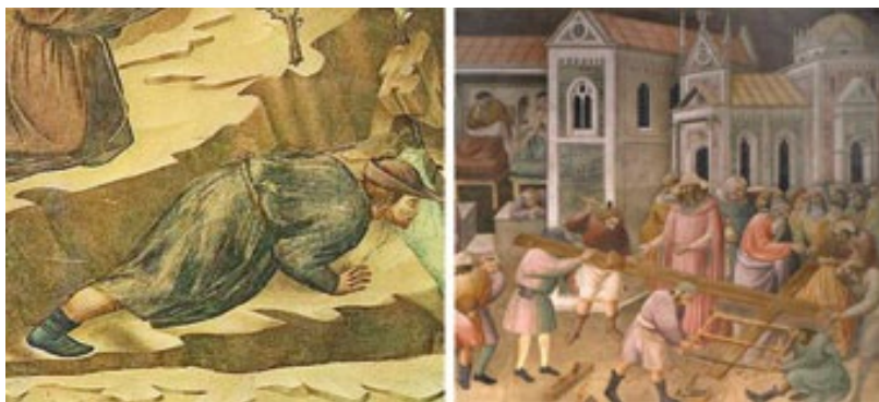
Giotto, Il miracolo della fonte (1290-1295 circa), Assisi, San Francesco, Basilica superiore. Agnolo Gaddi, Le storie della vera croce (metà XIV sec.), Firenze, Chiesa di Santa Croce.

È un periodo nel quale l'interesse verso la cultura e verso le arti si rafforza e si diffonde: Dante, Petrarca e Boccaccio elogiano Giotto che disegnava "si simile" alla natura, e Giotto stesso, come dice Vasari (1991, 118), ritrae "nella cappella del Palagio del Podestà di Fiorenza, l'effigie di Dante Alighieri".