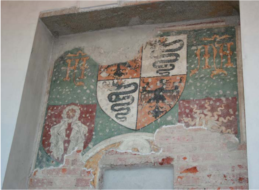
Fig. 10. Stemma e imprese di Filippo Maria Visconti , Milano, Sant'Eustorgio, Chostro dei morti