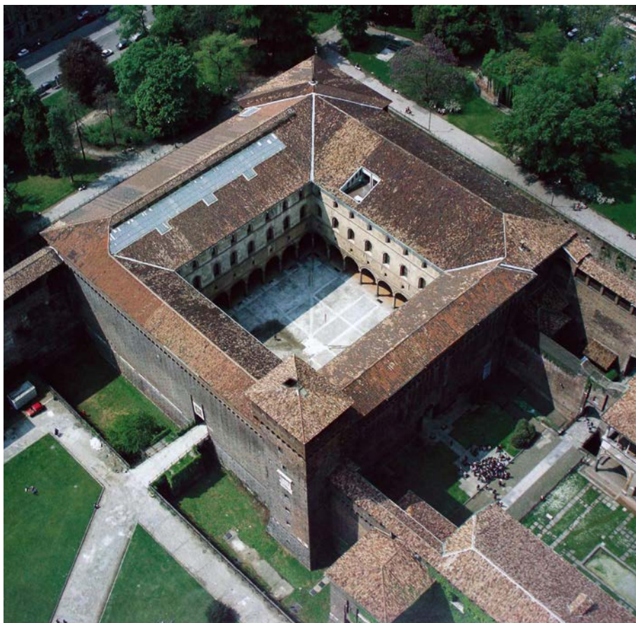
Fig. 3. Milano, Castello Sforzesco, veduta aerea della Rocchetta

tare di San Biagio), in San Lazzaro a Soncino, in Santa Maria a Caravaggio 51 , in Santa Maria Nuova ad Abbiategrasso 52 , in Santa Domenica a Delebio 53 , in