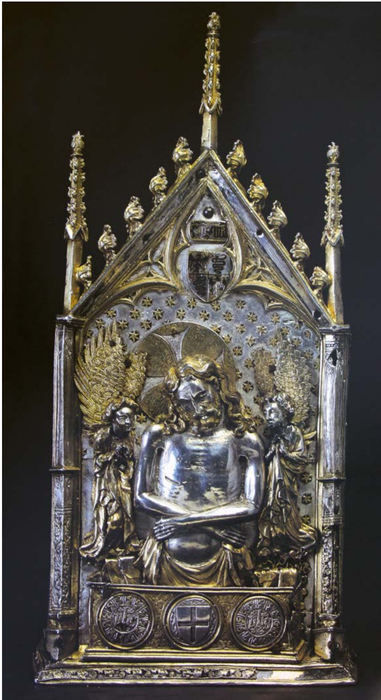
Fig. 7. Pace di Filippo Maria Visconti, Milano, Basilica di Sant'Ambrogio, recto