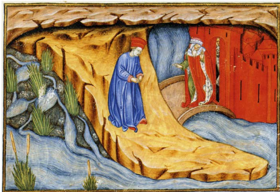
Fig. 13 (in basso). Maestro delle Vitae Imperatorum , Pagina dell'Inferno di Parigi-Imola, Parigi, Bibliothèque nationale de France, ms. It. 2017, f. 102r, particolare