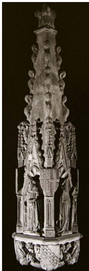
Fig. 9. Tabernacolo della colonna di Sant'Antonio abate, Milano, Musei di Arte Antica del Castello Sforzesco

L'attenzione dell'ultimo Visconti per la Cattedrale di Milano, spesso minimizzata dagli studiosi, dovette essere – come specifica Decembrio – notevolissima. Lo ricordano, purtroppo a fronte della perdita pressoché completa degli altari e della suppellettile tardomedievale del Duomo, diverse attestazioni contemporanee 71 . Si trattò non tanto o meglio non solo di committenza di opere, quanto di tutto un insieme di agevolazioni e permessi rilasciati in modo da arricchire e far progredire più velocemente la macchina del cantiere: solo a titolo d'esempio, la cessione dei diritti dell'imbottato di Volpedo 72 , la possibilità di recuperare i crediti esattamente come la camera ducale, le esenzioni, le oblazioni obbligatorie. Particolarmente importante, tra le oblazioni, era quella concessa dal Visconti alla Fabbrica del Duomo il 18 ottobre 1414: la dovevano versare, in vista della festività dei santi Quirico e Giulitta (il 16 giugno), anniversario dell'ingresso solenne di Filippo Maria a Milano,