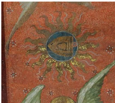
Fig. 1 (in alto a sinistra). Le Mans, Saint Julien, cappella della Vergine Fig. 2 (in alto a destra). Le Mans, Saint Julien, cappella della Vergine, particolare Fig. 3 (a fianco). Le Mans, Saint Julien, cappella della Vergine, particolare

Perché il vescovo è Sole tra gli angeli? Possono forse aiutare a dare una possibile interpretazione di questa scelta iconografica le parole dell'eremita