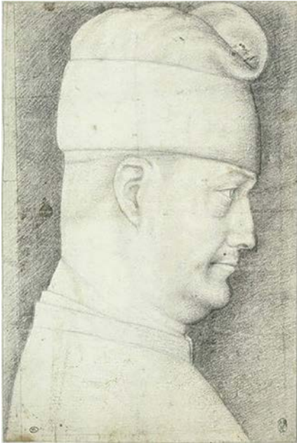
Fig. 2. Pisanello, Ritratto di Filippo Maria Visconti , disegno, Paris, Musée du Louvre, Département des Arts Graphiques, Inv. 2484

in Santa Maria presso San Celso (cinque) 47 , San Giovanni alla Vepra 48 , San Giorgio in Palazzo 49 , San Bartolomeo e nell'oratorio della Santissima Annunciata presso Santa Maria Podone 50 ; moltissime sono fuori dal capoluogo, in sei chiese cremonesi (nella cattedrale presso l'altar maggiore, in San Prospero all'altare di Sant'Ippolito, in S. Luca, S. Arealdo, S. Maria in Betlemme, in S. Bassiano all'al-