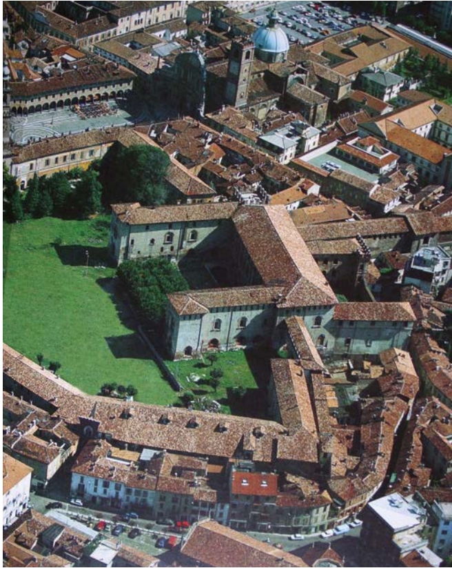
Fig. 5. Vigevano, Castello, veduta aerea