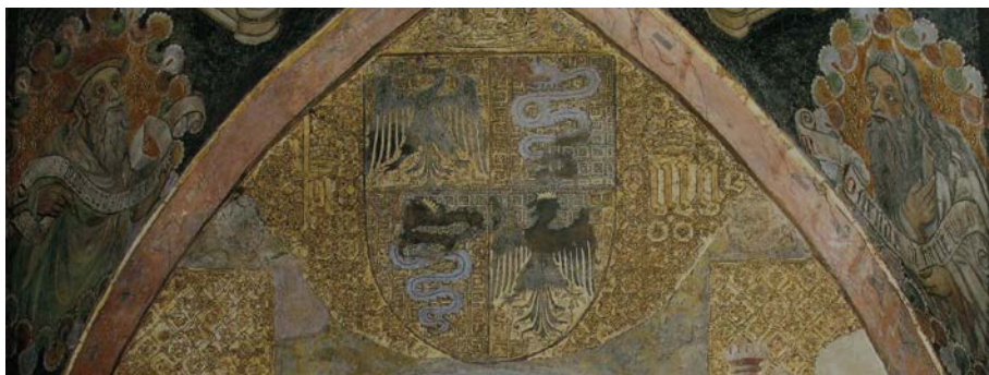
Fig. 8. Bottega degli Zavattari, Stemma in quartato di Filippo Maria Visconti , Monza, Duomo, cappella di San Vincenzo

e finanziate in prima persona dal duca, come sembrerebbe confermare il dispiegarsi dell'araldica ducale, oppure se si debbano alla committenza dei canonici del duomo ansiosi di ringraziare e ingraziarsi il signore di Milano per le elargizioni e le facilitazioni concesse.