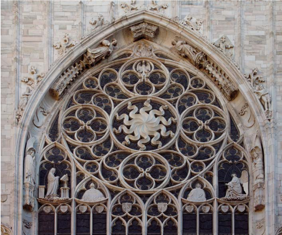
Fig. 4. Milano, Duomo, finestra centrale dell'abside

Sofferamoci rapidamente sul doppio registro, teologico e politico, che lo Spirito Santo in forma di aquila imperiale introduce e che la sottostante raza ripropone in questa processione trinitaria. Agostino, nel definire «la semplice e immutabile Trinità di Dio Padre, di Dio Figlio e di Dio Spirito santo, unico Dio, in cui qualità e sostanza sono la medesima cosa», ricapitola così un già ampio e condiviso insieme liturgico-teologico destinato a lunga vigenza: