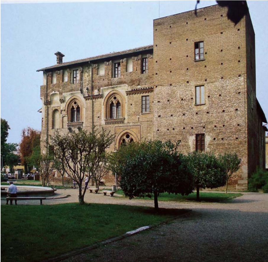
Fig. 4. Abbiategrasso, Castello

Santa Maria del Monte sopra Varese 54 , in San Sisto a Piacenza 55 , in Santa Maria Incoronata a Genova 56 , in San Martino a Lucca 57 . Per provvedere alle neonate