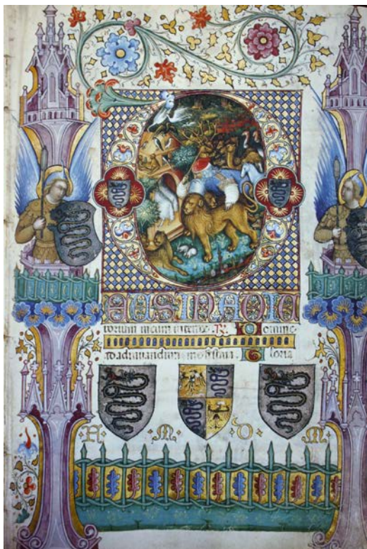
Fig. 12 (a fianco). Belbello da Pavia, Noè raduna gli animali, stemmi e iniziali di Filippo Maria Visconti , Offiziolo di Gian Galeazzo Visconti, Firenze, Biblioteca Nazionale, ms. LF 22