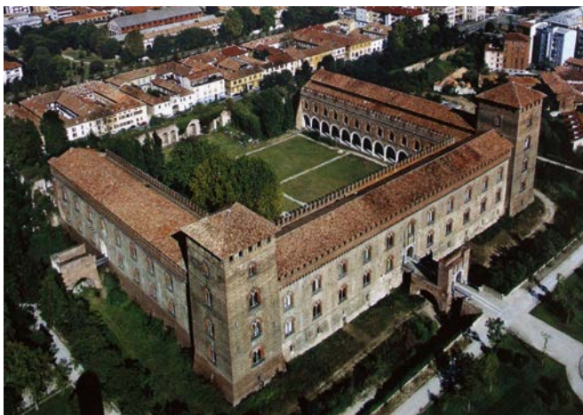
Fig. 6. Pavia, Castello, veduta aerea