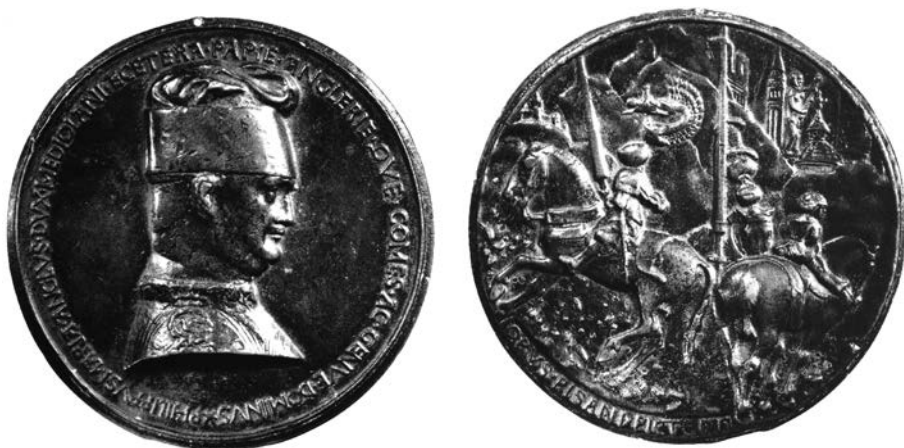
Fig. 1. Pisanello, Filippo Maria Visconti , medaglia, Paris, Bibliothèque nationale de France, Cabinet des Médailles Armand-Valton I

faccia riferimento Decembrio, quando nella sua biografia, a proposito dell'aspetto fisico del Visconti, ricorda come all'immagine del duca, «quamquam a nullo depingi vellet, Pisanus ille insignis artifex miro ingenio spiranti parilem effingit» 39 . Diversamente da quanto afferma Decembrio, esistono altri ritratti di Filippo Maria Visconti, nessuno però fedele al vero: l'esempio forse più noto è nel manoscritto della Bibliothèque Nationale di Parigi Lat. 6041 D con l' Historia Angliae di Galasso da Correggio, opera del Maestro dei Giochi Borromeo 40 . L'affermazione dell'umanista può quindi avere un fondo di verità, solo se intendiamo il ritratto del duca come "dal naturale". La medaglia era certo in quel preciso momento storico l'oggetto artistico più ambito dai signori dell'epoca, un oggetto immortale: ad essa fu affidata l'effigie ufficiale di Filippo Maria, utilizzata in seguito come modello per tutti i ritratti postumi dell'ultimo Visconti.