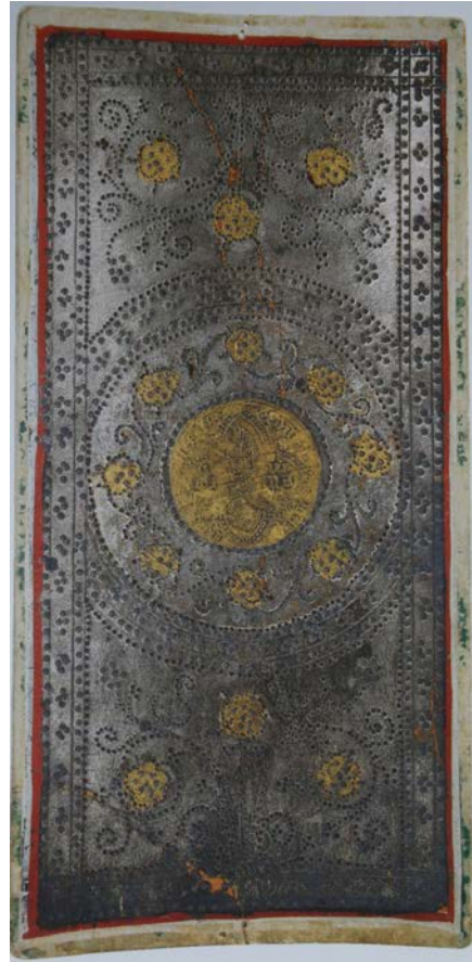
Fig. 14. Bottega degli Zavattari (?), Fante di denari , carta da tarocco, Milano, Pinacoteca di Brera, Reg. Cron. 4982/5029