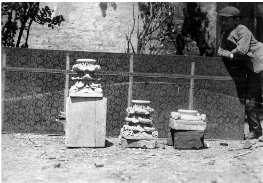
Fig. 11. Capitelli e basi dell'antico recinto di San Pietro martire in Sant'Eustorgio, fotografia della fine dell'Ottocento, Milano, Soprintendenza ai Beni Architettonici e Ambientali, Archivio fotografico

artista nutrito da tanti apporti – toscani, veneti, emiliani – e caratterizzato a quest'altezza cronologica da una incontenibile verve 92 .