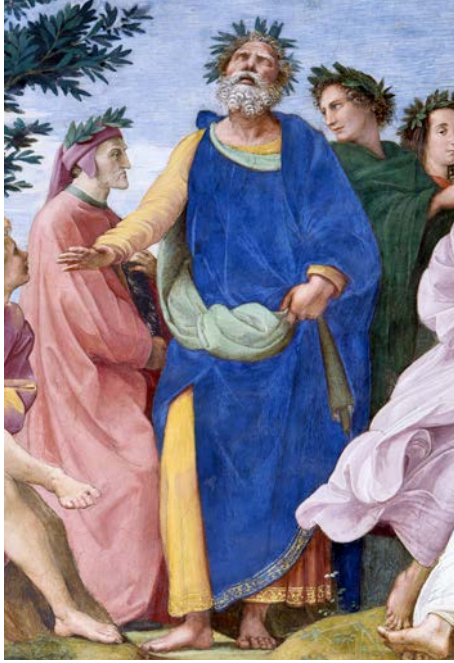
Fig. 6 – Raffaello Sanzio, Parnaso , Omero (particolare).