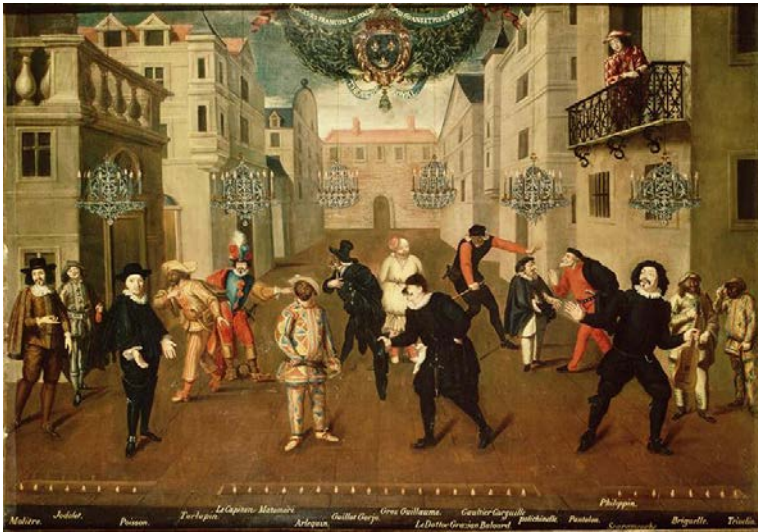
Fig. 13 – Anon. (attrib. a Verio), Farceurs Français et Italiens , olio su tela, 138x39 cm, Comédie Française, Musée du Louvre, Paris 1670.

mondo delle Lettere e delle Arti appartenenti ad un passato più o meno recente, e a cui la Rivoluzione aveva attribuito un nuovo status. Molière e Lesage, Racine e Piron, Rousseau e Gallet, Voltaire e Favart, Préville e Dominique, e tutti gli altri Benefattori della Patria che di volta in volta furono offerti all'ammirazione degli spettatori del Théâtre du Vaudeville 40 andarono a formare una «grande famiglia di fratelli», che a distanza poteva rispecchiarsi idealmente in quel bel ritratto d'insieme intitolato Farceurs Français et Italiens realizzato nel 1670. Osservato attraverso gli occhi di quei drammaturghi che con le loro pièces à auteurs entrarono nel repertorio del teatro della rue de Chartres, il quadro riveste nondimeno un significato particolare: Molière, considerato autore di prim'ordine, vi appare in perfetta armonia con quei «farceurs français et italiens» a cui la Rivoluzione aveva tolto il marchio d'infamia (etica e artistica) che li aveva segnati durante l'antico regime. Un ritratto di famiglia idilliaco, destinato a mutare ben presto d'aspetto dopo gli anni Venti dell'Ottocento, a partire dai quali i drammaturghi dettero vita a nuovi Pantheon mentali.