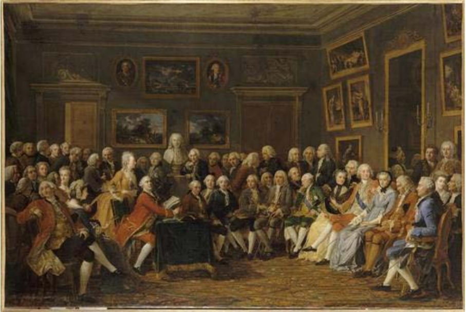
Fig. 1 – Anicet Charles Gabriel Lemonnier, La lecture de l'orphelin de la Chine , olio su tela, 129,5 x 196 cm, Musée du Louvre, Paris 1761.

2 C. Cadet Gassicourt, Le souper de Molière ou la soirée d'Auteuil , cit., sc. 15, p. 49.