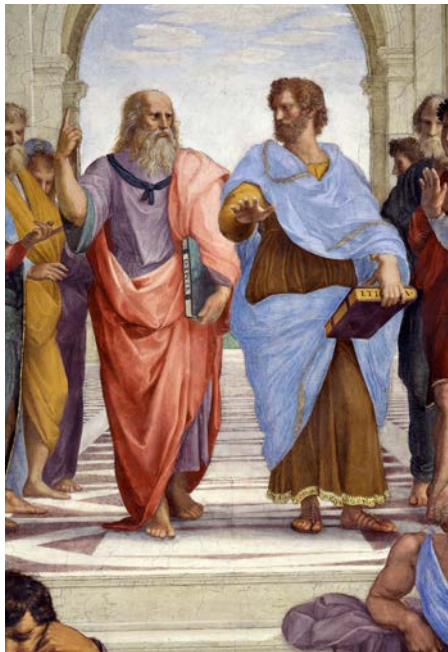
Fig. 3 – Raffaello Sanzio, Scuola di Atene , Platone ed Aristotele (particolare).