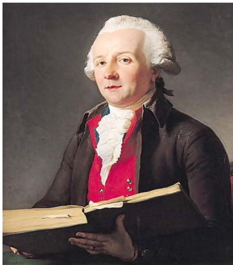
Fig. 12 – François-André Vincent, Portrait du comédien Dazincourt , olio su tela, 73x60 cm, Musée des Beaux-Arts, Marseille 1792.

La volontà, da parte del pittore, di assimilare la funzione dell'attore a quella dell'intellettuale è palese. Dazincourt, in posa, non è dipinto con indosso abiti di scena; nessun elemento richiama alla mente il teatro, se non il titolo dell'opera stessa ( Portrait du comédien Dazincourt ). Il volume che l'attore tiene aperto fra le mani fa intuire che il suo è un mestiere d'intelletto, praticato da un uomo di Genio che poteva ormai fregiarsi, al pari degli autori, dell'appellativo di Benefattore della Patria.