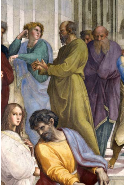
Fig. 4 – Raffaello Sanzio, Scuola di Atene , Socrate (particolare).