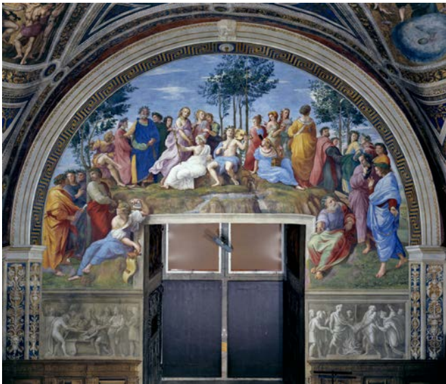
Fig. 5 – Raffaello Sanzio, Parnaso, affresco, «Stanza della Segnatura», Musei Vaticani, 1510-1511.