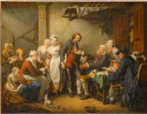
Fig. 9 – Jean-Baptiste Greuze, L'Accordée de village , olio su tela, 92x117 cm, Musée du Louvre, Paris 1761.

Mathurin (à Greuze et à Lemierre): Messieurs, vous serez les témoins de l'union et du bonheur de mes enfants. 192