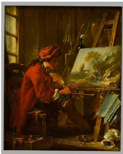
Fig. 10 – François Boucher, Le peintre dans son atelier , olio su tela, 27x22 cm, Musée du Louvre, Paris seconda metà del XVIII sec.

al salon del 1798, intitolato Réunion d'artistes dans l'atelier d'Isabey , rende conto proprio di quella profonda trasformazione sopra descritta che si era operata in seno alla società. Ascrivibile ad un 'genere' molto in voga all'epoca (quello della raffigurazione dell' atelier d'artiste ), l'opera di Boilly si impose all'attenzione di critica e pubblico per le sue caratteristiche doppiamente rivoluzionarie. Dando prova di possedere una minuziosa abilità di riproduzione pittorica, Boilly rappresentò, con un realismo che fu definito impressionante, alcuni degli artisti contemporanei nell'atto di conversare amabilmente nell' atelier del pittore miniaturista Isabey. Il significato di cui il quadro si faceva portatore era chiaro: si trattava non solo di rendere omaggio ad alcuni Grandi Uomini contemporanei (fra cui figuravano pittori, scultori, attori e musicisti) 5 , ma anche di rendere conto di una diversa funzione dell'artista 6 , non più raffigurato, come da tradizione, nella sua veste di artigiano 7 (si consideri ad esempio il quadro di François Boucher intitolato Le peintre dans son atelier ), bensì nel suo ruolo di intellettuale. L' atelier del pittore Isabey, che fa da sfondo al quadro di Boilly, è comparabile ad un salotto in cui gli artisti, ben vestiti, sembrano conversare a loro agio (figg. 10, 11); un salotto che può essere preso a simbolo della più vasta società dell'epoca, in cui essi avevano ormai assunto una funzione di primo piano.