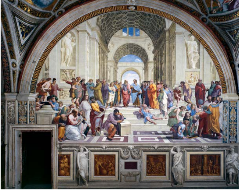
Fig. 2 – Raffaello Sanzio, Scuola di Atene, affresco, «Stanza della Segnatura», Musei Vaticani, 1509-1511.