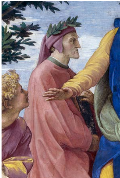
Fig. 7 – Raffaello Sanzio, Parnaso , Dante (particolare).