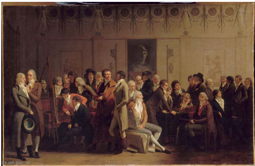
Fig. 11 – Louis-Léopold Boilly, Réunion d'artistes dans l'atelier d'Isabey , olio su tela, 72x111 cm, Musée du Louvre, Paris 1798.

Alcuni dei drammaturghi che si dedicarono alla composizione di pièces à auteurs ci testimoniano, nelle loro opere, proprio di quell'avvenuto cambiamento di considerazione nei confronti degli esponenti della Repubblica delle Lettere e delle Arti. All'elevazione sociale e politica di autori e artisti, corrispose la loro 'nobilitazione' nelle fabulae teatrali che li portarono in scena. Protagonisti positivi per eccellenza 8 , essi andarono spesso ad assumere, nell'immaginario scenico (che recepiva, come si è detto, le istanze provenienti dal mondo reale), quelle caratteristiche che erano state appannaggio dei personaggi nobili o privilegiati. Le vicende amorose, ad esempio, in cui sono coinvolti molti autori presentati in scena si risolvono sempre a loro favore, anche quando i rivali sono dotati di tutte quelle prerogative (ricchezza, bellezza, titoli nobiliari, ecc.) che erano state apprezzate fino a quel momento dalle giovani donne e repute essenziali dai loro padri per poter concedere la mano delle figlie.