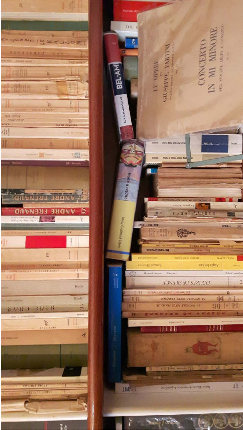
Autori francesi nella libreria della casa romana di via Pio Foà.