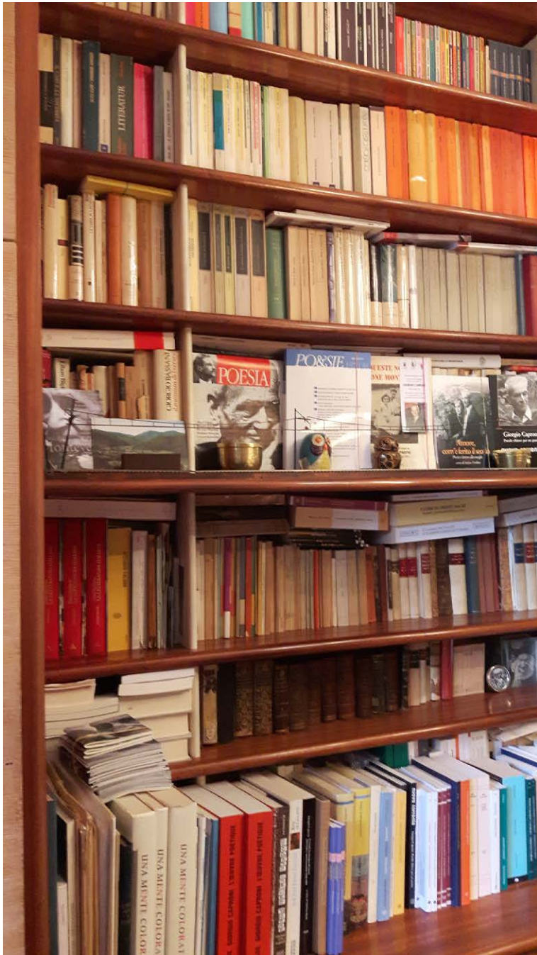
Studio di Giorgio Caproni nella casa romana di via Pio Foà (foto di Anna Dolfi).