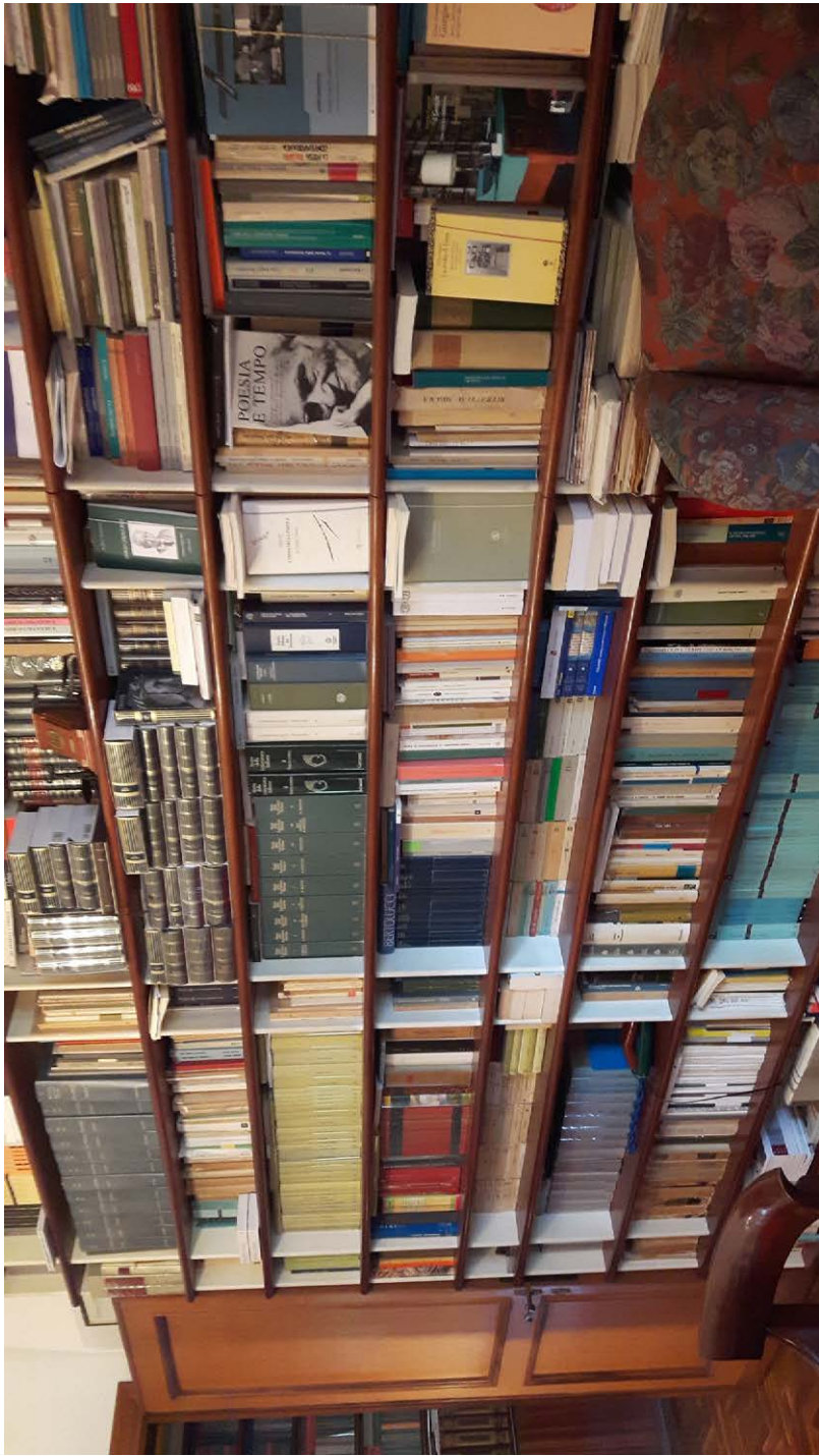
Studio di Giorgio Caproni nella casa romana di via Pio Foà.