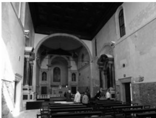
Figura 4. Venezia, Santa Maria della Visitazione, interno.