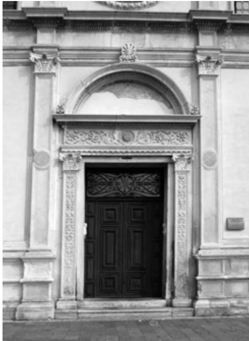
Figura 2. Venezia, Santa Maria della Visitazione, portale.