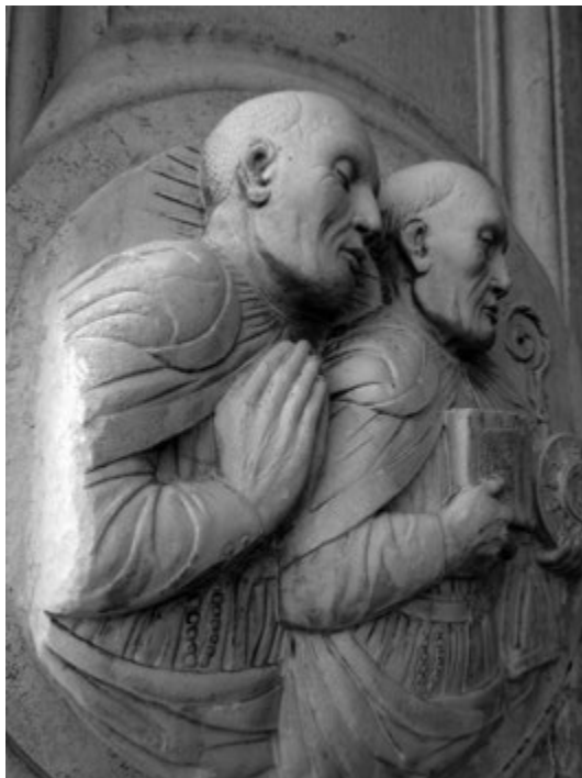
Figura 3. Venezia, Santa Maria della Visitazione, dettaglio dello stipite sinistro del portale.