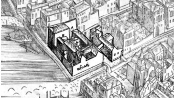
Figura 1. Jacopo De Barbari, Venetia , xilografia, 1500. Dettaglio dell'area delle Zattere con evidenziate le proprietà dei gesuati («iesuati»).