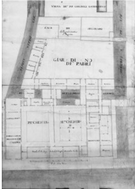
Figura 5. Pianta del complesso dei gesuati dopo il passaggio ai Domenicani, 1703-1725 ca. [ASVe, Santa Maria della Carità, Pergamene , busta 29, disegno 2, dettaglio]