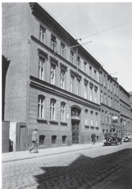
Abb. 2: Frontansicht des Archivs in der Karlstraße (LASH Abt. 399.92 Nr. 80)