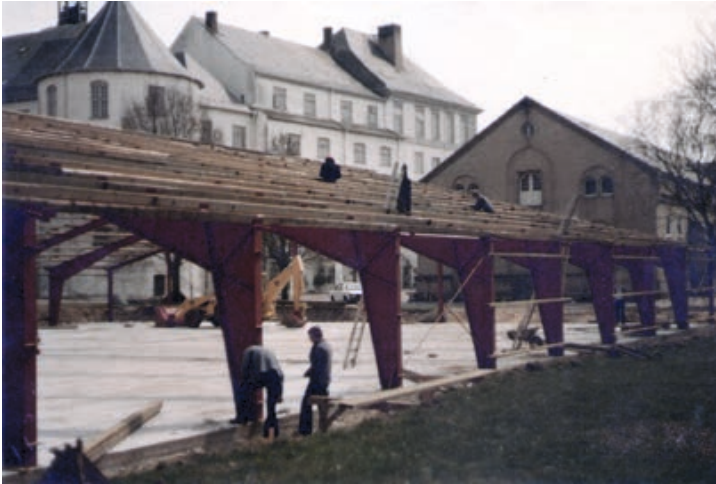
Abb. 6: Bau eines behelfsmäßigen Archivlagers hinter Schloss Gottorf (LASH Abt. 304 Nr. 5002)

nicht die Festigkeit hatte wie angenommen, sondern eher der Konsistenz eines „besseren Mörtels“ entsprach. Das Urteil der Statiker lautete: