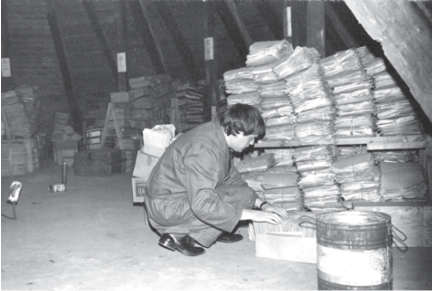
Abb. 5: Unterbringung der Entnazifizierungsakten auf Schloss Gottorf

einschränkte, dass dies, wenn es überhaupt in der Hand des Landesarchivs liegen würde, noch nicht ratsam sei, um den Verdacht zu entkräften, dass Entnazifizierungsakten zur Vertuschung von Straftaten vernichtet worden seien. 1599