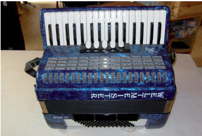
Abbildung 3: Erins Akkordeon

Es kann bei Bedarf gestisch aus ihr herauswachsen; sie holt es gestisch aus sich heraus, um es kurz in seinen Abmessungen und den zugehörigen rhythmischen Bewegungen des Spielens zu präsentieren und es dann sogleich wieder in sich hineinzuholen; es sich zu eigen zu machen, es sich einzuverleiben. Im Prozess des Einverleibens kommt es zu einem Ballen der Fäuste; in dem Moment, in dem das imaginäre Akkordeon immer näher an den Körper gerät, bis es schließlich wieder in ihm aufgeht und verschwindet. Die Verbindung zwischen Mensch und Ding lässt sich somit als Metamorphose, Verschmelzung, Adaptation analysieren.