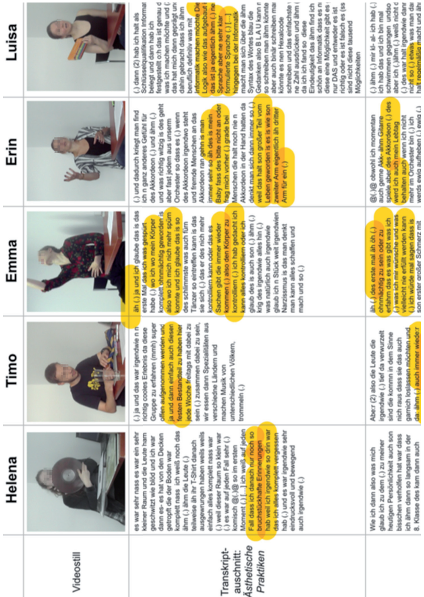
Tabelle 1: Fallübersicht mit Transkriptausschnitten zu ästhetischen Praktiken und ihrer biographischen Relevanz (Ausschnitt)