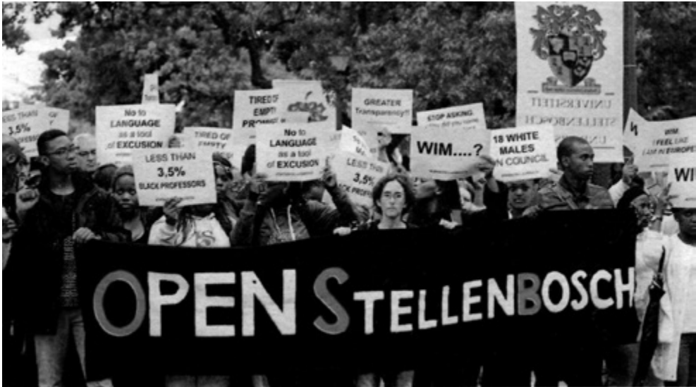
Die groep Open Stellenbosch betoog teen onder meer die gebruik van Afrikaans op die US-kampus.

Tesame met die gewelddadige betogings by Elsenburg aan die begin van September 2015 het die US ook skerp onder skoot gekom (Germishuys & Van den Berg 2015:1). Die OS-groep het kapsie gemaak teen die 21 “leliewit mans-raadslede” en wou weet wat die presiese program en oogmerke vir transformasie was. Tesame daarmee is ’n drastiese ultimatum aan die bestuur gerig dat as daar nie binne ’n dag gereageer word nie,