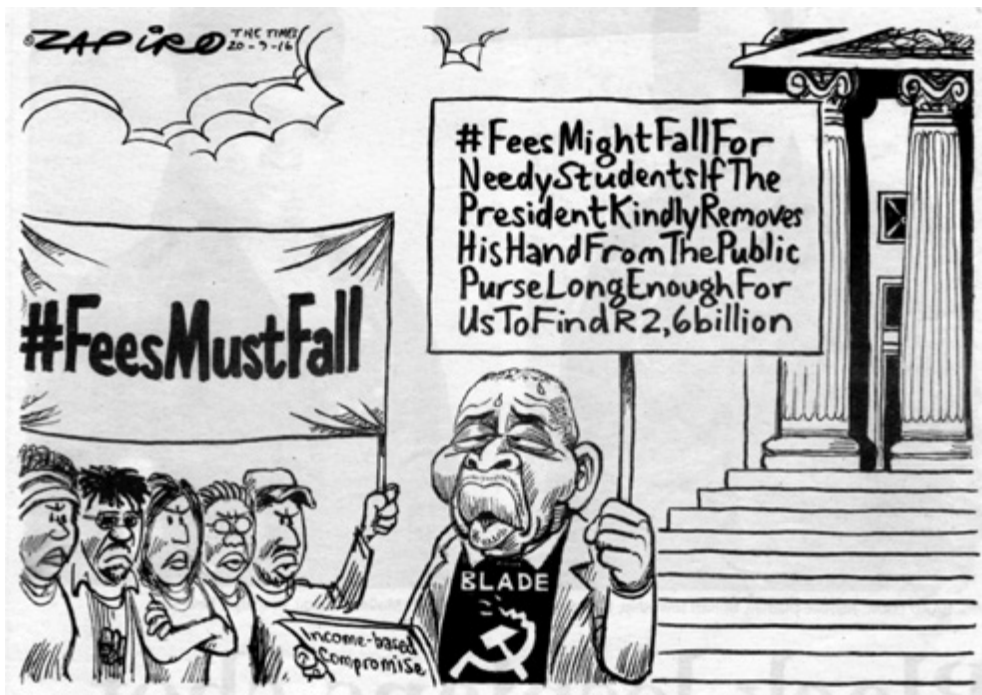
'n Beangste minister moet 'n dreigende storm ontloot. (Zapiro, The Times , 20 September 2016:13)

Die situasie onder jong swart studente op kampusse het egter al dreigender geword, met geweldenaars ook van buite die kampusse wat met kieres en swepe en brandstigting begin het. Selfs topbestuurslede is gyselaar gehou en topbestuursvergaderings en lesinglokale is binnegedring, beset en met dreigemente ontstig. Die woede is veral toegespits op die klem wat veral by die US nog op Afrikaans geplaas is. Uit wit geleedere is die geweld en intimidasie as onaanvaarbaar in 'n demokratiese staat bestempel, want daar moes ruimte vir almal – ook vir Afrikaners en Afrikaanssprekendes – gelaat word om hulle eie siening te huldig en hulle ideale te verwoord, ongeag ander meer radikale sienings (Du Preez & Smith 2015:7).