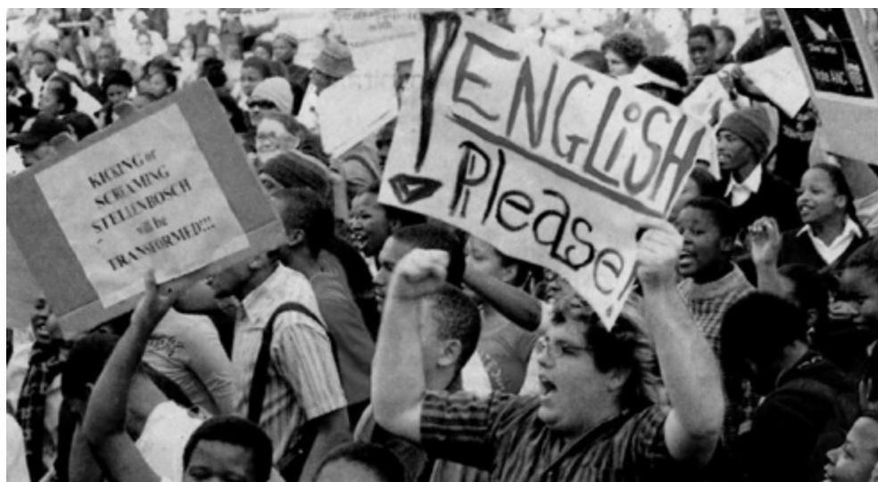
Opruiende optrede oor Afrikaans as onderrigtaal.

ernstig opgeneem te word, veral uit frustrasie om net fisies te probeer oorleef met genoegsame kos en bekostigbare verblyf. Die erns en omvang van die opstande het geen twyfel gelaat nie dat hierdie jonges se “rasionele en redelike versugting na selfverbetering” ernstig opgeneem en op die een of ander wyse dringend opgelos sou moes word. Universiteite is gesien as openbare instellings wat die hele land moet dien en Afrikaans het in toenemende mate onder beleg gekom, omdat baie swart studente begin vermoed het dat dit tussen hulle en ’n universiteitskwalifikasie staan. Die belangrikste eis van die #FeesMustFall-veldtog was egter ten diepste gratis tersiêre onderrig, omdat talle dit geensins kon bekostig nie ( Rapport 2015:2).