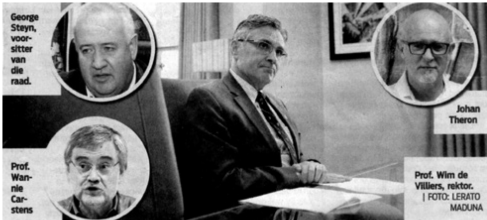
Die dramatis personae in Gelyke Kanse se litigasie oor die taalbeleid.