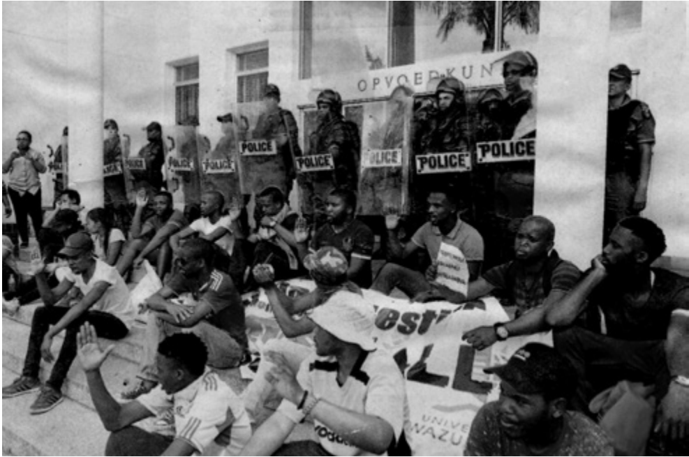
Polisie bewaak 'n universiteitsgebou by Maties tydens die #FeesMustFall-veldtog.