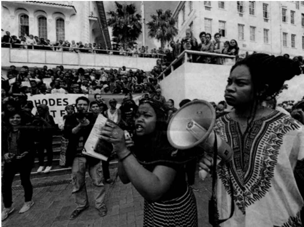
Van die studente wat in die video Luister te sien is, spreek studente op die Rooiplein toe.