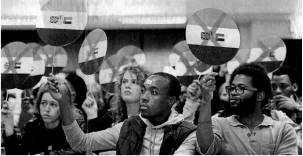
Studeute van die beweging Open Stellenbosch hou bordjies met die ou vlag wat doodgetrek is in die lug op die geleentheid waar 'n plaket ter ere van voormalige eerste-minister dr. HF Verwoerd verwyder is.