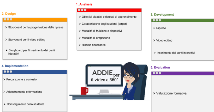
Figura 1 – Fasi del modello ADDIE.

e chiariti i problemi formativi, gli obiettivi e i risultati da conseguire, il contesto di apprendimento e le preconoscenze degli studenti, in modo da consentire una fruizione efficace e confortevole del video a 360°.