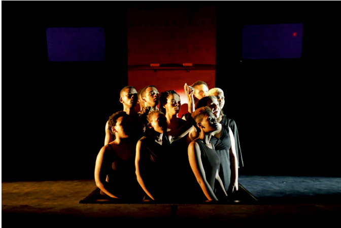
Abbildung 3: Der Auftritt des Antigone-Chors im zweiten Teil von Magnet Theatres Antigone (not quite/quiet), Baxter Theatre Centre in Kapstadt, September 2019.