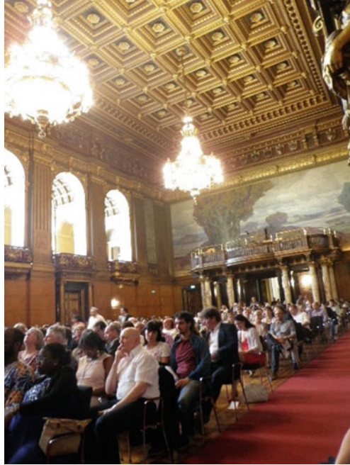
Abb. 5.3 Großer Festsaal (Blick von der Bühne ins Publikum)

unzweifelhaft erkennbar: Er deutet auf die Verquickung von Lokalem und Globalem, auf das Zelebrieren hybrider Identitäten und die Betonung einer transkulturellen Wertegemeinschaft, die nicht an Ländergrenzen Halt macht.