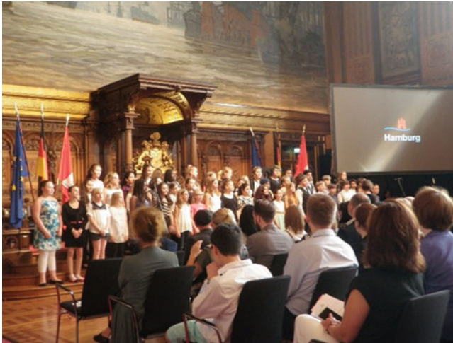
Abb. 5.5 Kinderchor bei einer Einbürgerungsfeier

diskursiven Inszenierung, tragen durch ihre Präsenz, ihr Erscheinungsbild und ihr Verhalten jedoch erheblich zum Gesamtbild derselben bei. So sind sie z. B. in der Regel festlich gekleidet, oft auch in Trachten ihrer jeweiligen Herkunftsregion. Sie werden unter Nennung ihres Namens und des ursprünglichen Herkunftslandes auf die Bühne gerufen. Auf diese Weise entsteht ein Eindruck von Multikulturalität, Hybridität und kosmopolitischer Vernetzung, der den Tenor des staatsnationalen Diskurses in erheblicher Weise unterstreicht. Indem der Erste Bürgermeister ihnen in festgelegter Reihenfolge die Urkunden überreicht, sie beglückwünscht und ihnen die Hand schüttelt, nimmt die Bühnenhandlung darüber hinaus einen durch und durch rituellen Charakter an. Die Bedeutung des symbolischen ‚Grenzübertritts‘ wird (v. a. durch den persönlichen Handschlag des Bürgermeisters und die damit assoziierte Wertschätzung) weiterführend hervorgehoben. Implizit wird dadurch auch die Subjektposition des/der ‚guten (eingebürgerten) Staatsangehörigen‘ mit ihrem kosmopolitischen Humankapital sowie dessen Relevanz für den deutschen Staat aktualisiert.