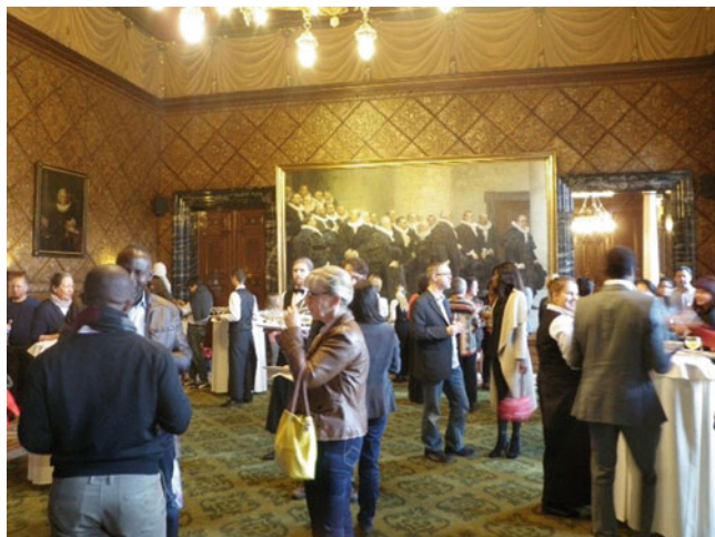
Abb. 5.7 Einbürgerungsfeier – Empfang (Nebenraum des Großen Festsales)