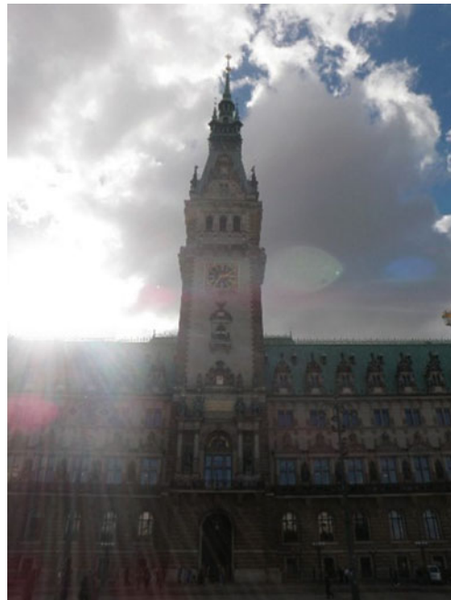
Abb. 5.1 Hamburger Rathaus

Der Große Festsaal ist demnach nicht nur ein Ort, an dem normalerweise Staatsempfänge begangen werden – und der allein schon aufgrund dessen dazu geeignet ist, das dortige Geschehen aus der Sphäre des Alltäglichen herauszuheben – er stellt überdies auch eine unmittelbare Verbindung zu Hamburg her. Hamburgische Geschichte, hamburgische Symbolik und hamburgische Identität spielen im Kontext der Feiern (und darüber hinaus auch für die weitere Inszenierung des offiziellen Diskurses) eine herausragende Rolle. Bezeichnend ist hierfür u. a. der große schwarz-rot-goldene Anker, der nicht bloß als Logo der Hamburger Einbürgerungsinitiative fungiert, sondern darüber hinaus auch stets an prominenter Stelle die Bühne der Einbürgerungsfeiern schmückt (siehe Abb. 5.2). Mit der Mischung aus Nationalfarben und maritimer (Hamburg-)Symbolik verknüpft dieser Anker (wie auch der Leitspruch der Initiative: Hamburg. Mein Hafen. Deutschland. Mein Zuhause. ) lokale mit nationaler Identität. Die Rolle Hamburgs als Hafenstadt und ‚Tor zur Welt‘ ist dabei essentiell. In Abschnitt 5.3 wird auf diese ‚Lokalisierung‘ von nationaler Zugehörigkeit noch weiterführend einzugehen sein.