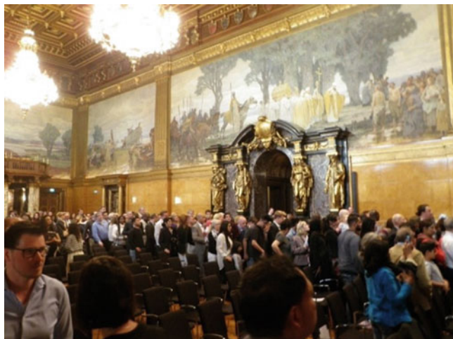
Abb. 5.6 Menschen stehen für Foto mit Olaf Scholz an