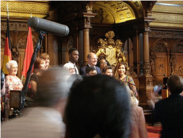
Abb. 5.4 Olaf Scholz mit einer Gruppe Eingebürgerter

Nicht jede/r Gastrender_in hat indes zwangsläufig einen Migrationshintergrund. Am 44. Jubiläum der Hamburger Einbürgerungsfeiern (23.01.2018) nahm z. B. der amtierende Bundespräsident Frank-Walter Steinmeier teil. Aus Sicherheitsgründen war es mir leider nicht möglich, dieser Veranstaltung beizuwohnen. Die Anwesenheit des deutschen Staatsoberhauptes als Tatsache an und für sich unterstreicht aber bereits die besondere Bedeutung, die den Feiern von offizieller Seite zugemessen wird. Sein Besuch erhob sie umso mehr zum nationalen rite de passage .