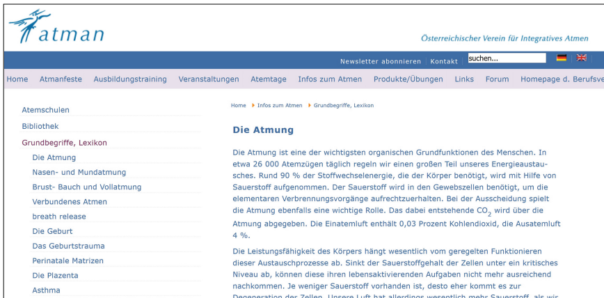
Abb. 4.2 atman -Website: „Grundbegriffe, Lexikon“ [W-1]

„Das Geburtstrauma“, „Asthma“, „Hyperventilation“, „Chakren“ 14 , „Kaltwasseratmen“, „Warmwasseratmen“, „Die Theorie der Gefühlsunterdrückung“ sowie „Die Funktion der Atmung nach der Polyvagal-Theorie“.