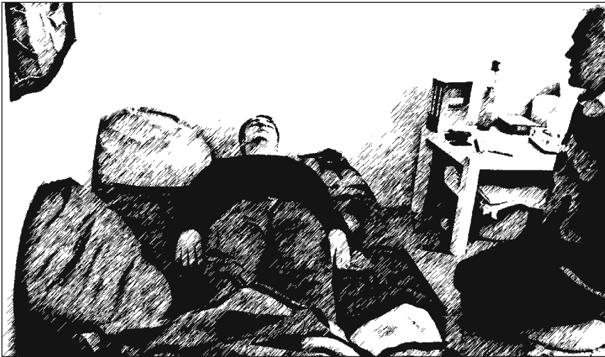
Abb. 5.2 Interaktionssituation: ‚Eigentliches‘ Atmen (Atemtherapie-Einzelsitzung)

zum Vorgespräch, völlig anders gelagerte – asymmetrische und in vielerlei Hinsicht alltagsuntypische Interaktionssituation: Man liegt auf dem Präsentierteller und ist dem Therapeuten in visueller Hinsicht gleichsam ausgeliefert – was zumindest ein Grundausmaß an Vertrauen in das unsichtbare, beobachtende Gegenüber voraussetzt.