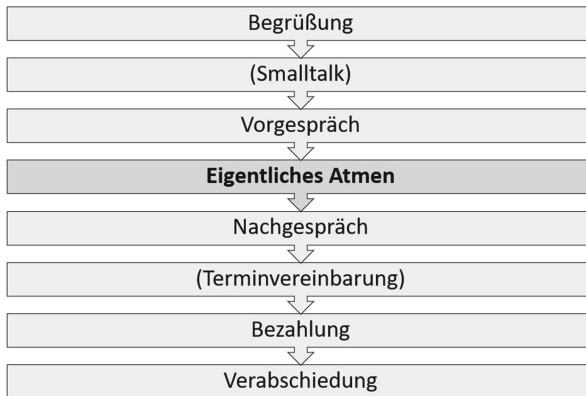
Abb. 6.1 Idealtypischer Ablauf von Atemtherapie-Einzelsitzungen

gespielt haben oder die während der Sitzung „aufgetaucht“ sind; die Sitzung endet 6.) (oftmals) mit einer Terminvereinbarung (außer, man hat etwa seinen Kalender nicht dabei, dann kann dies telefonisch oder per E-Mail nachgeholt werden), 7.) der Bezahlung und schließlich 8.) der Verabschiedung (siehe Abb. 6.1). 1