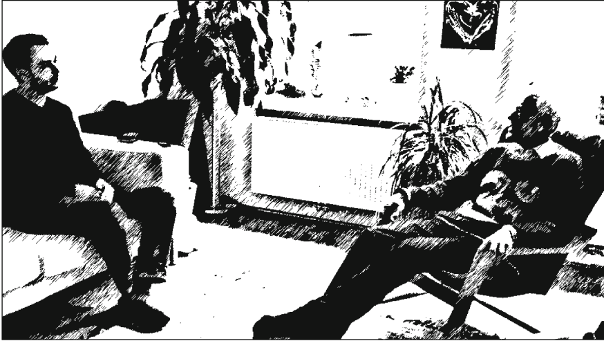
Abb. 5.1 Interaktionssituation: Vorgespräch (Atemtherapie-Einzelsitzung)

Den Klient*innen wird in den Einzelsitzungen in normativer und praktischer Hinsicht also eine spezifische Kompetenz (vgl. Pfadenhauer 2010) abverlangt: Sie dürfen (bzw. sollen) nicht nur exklusiv und problematisierend über sich erzählen, sie sollten auch die Bereitschaft mitbringen, dies unumwunden und ehrlich zu tun. Darüber hinaus sollten sie auch im Sinne eines praktischen Könnens fähig sein, etwaige Probleme in nachvollziehbarer Art und Weise zu artikulieren (Willems 1994: 30 ff.) oder etwa – sofern sie das wollen – im Nachgespräch auf ihre (Atem-)Erfahrungen sprachlich reflektieren.