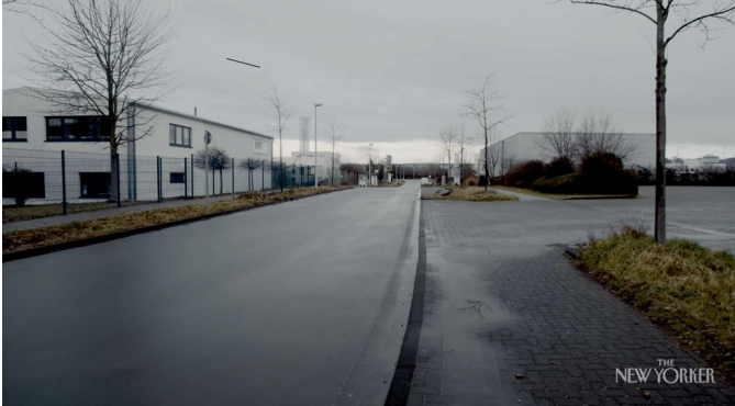
Abb. 8: Aus dem Dokumentarfilm »Deine Straße« © Güzin Kar (2020)

geblieben. Eine Gedenkplakette erinnert. Und auf Wunsch der Familie wachsen auf dem Grundstück fünf Kastanien.