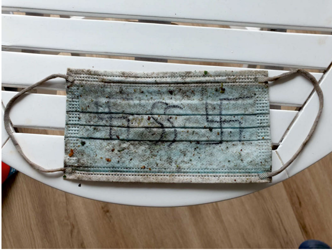
Abb. 3: Maske mit Hakenkreuzen und SS-Runen

deutsch-türkeistämmigen Familie, in deren Wohnung nachts um zwei Uhr noch Licht brannte und deren Balkontür offenstand. 17