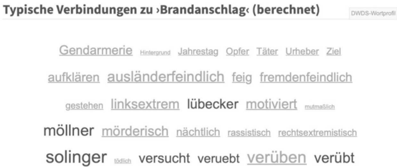
Abb. 5: DWDS – Suchabfrage >Brandanschlag<, typische Wortverbindungen

Gedächtnis, das ich an dieser Stelle als Mentalitäten 4 einer Zeit im Sinne Hermanns (1995) deute: