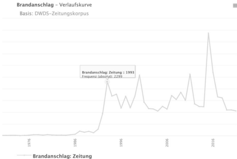
Abb. 6: DWDS – Verlaufskurve von Brandanschlag (Zeitraum 1946 bis 2021)

Über den Wortverlauf lassen sich zugleich gesellschaftliche Entwicklungen im Zeitverlauf erschließen, die das Thema Brandanschlag in der Öffentlichkeit aufgreifen bzw. darüber berichten. Insgesamt lässt sich festhalten, dass das Wort Brandanschlag unter Rückgriff auf die hier vorliegende Textsammlung allgemeingültige Rückschlüsse auf die deutsche Sprache ermöglicht 7 und mit Solingen oder Mölln sowie politisch motivierten Gründen kontextualisiert wird (hier insbesondere rechts- oder linksextrem). Doch wie zeichnet sich der Sprachgebrauch in dem nun heranzuziehenden Spezialkorpus bzw. ›Solingen‹-Korpus aus und wie werden die Betroffenen dargestellt? Schauen wir uns dazu nun zunächst die Kontexte des Wortes Brandanschlag genauer an, um dann Kontexte des Familiennamens Genç zu untersuchen.