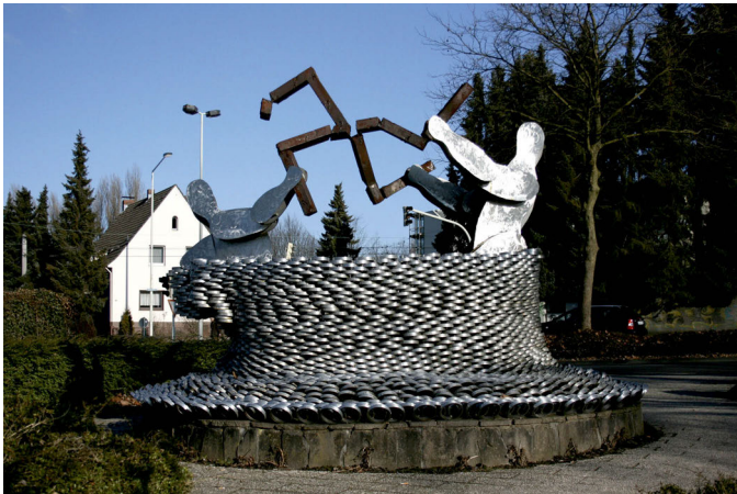
Abb. 7: Mahnmal an der Mildred-Scheel-Berufsschule in Solingen

Öffentliches »Doing Memory« an rechte Gewalt und ihre Opfer wird realisiert durch ein Hörstück wie das von Özlem Özgül Dündar oder das Mahnmal vor der Mildred-Scheel-Schule und ist – so soll hier betont werden – zentral für die Anerkennung des erfahrenen Leids, es ist notwendig für die Betrauerbarkeit, es ist unabdingbar für eine plurale Gesellschaft, die sich als demokratisch versteht. Als Praxis des öffentlichen Erinnerns und Vergessens ist »Doing Memory« – so zeigt auch schon das Eingangsbeispiel – deutlich erkennbar mehr als das Archivieren und Speichern abgeschlossener und damit statisch gewordener Vergangenheiten.