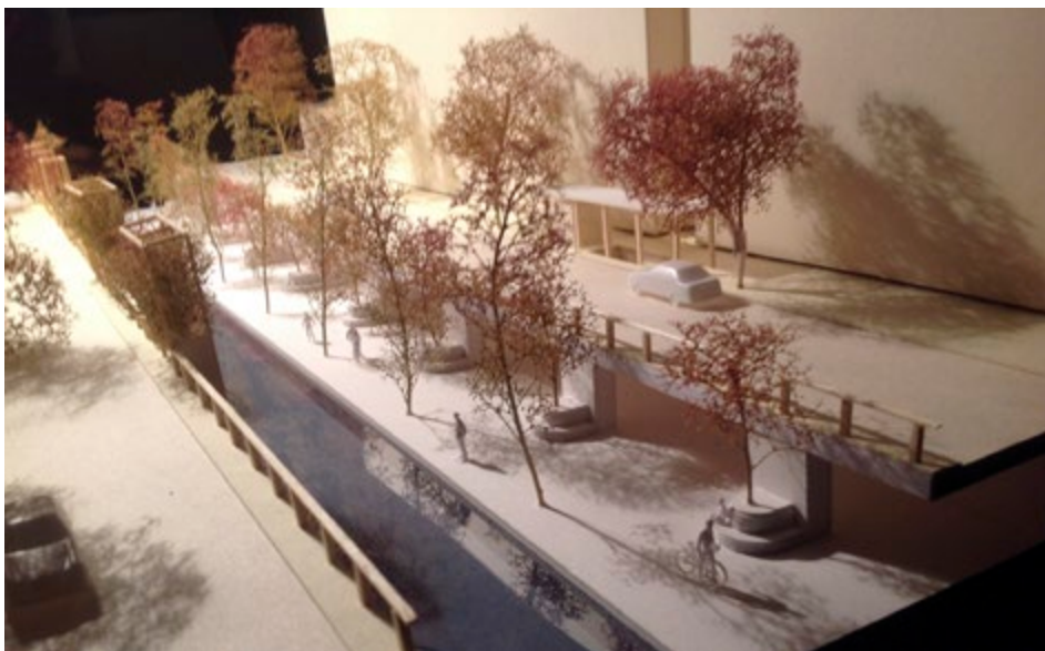
Figura 3. Progetto del Naviglio della Martesana in via Melchiorre Gioia, modello di studio (Politecnico di Milano, a cura di M. Prusicki e C. Candia).

protetta dal traffico, affiancata dal canale e da una sequenza di spazi di uso pubblico, fino al cuore del quartiere di Porta Nuova, re-identificando la via d'acqua come potenziale asse portante di nuove centralità in un vasto settore del territorio orientale di Milano - Città Metropolitana. 23