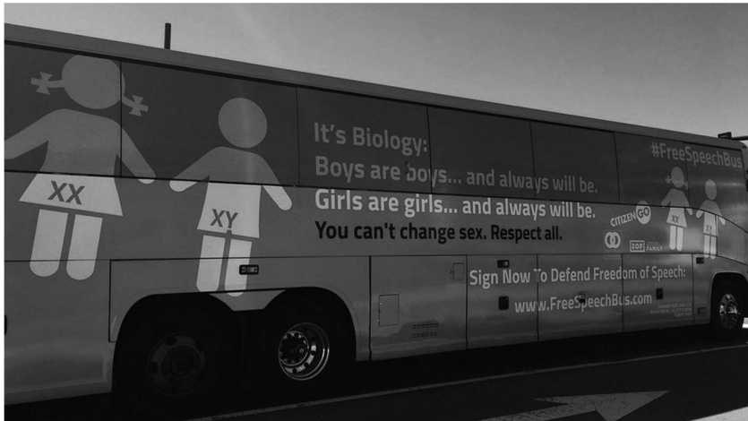
Abbildung 2: Aufschrift des Anti-Transgender Busses in den USA