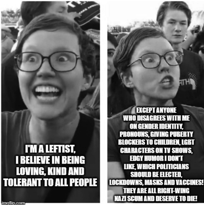
Abbildung 1: Social Justice Warrior-Meme.