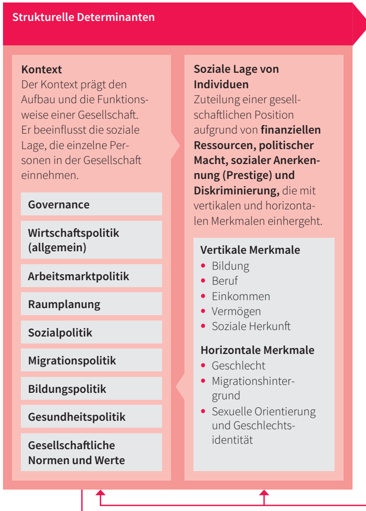
Abbildung 1: Modell zur Erklärung gesundheitlicher Ungerechtigkeit