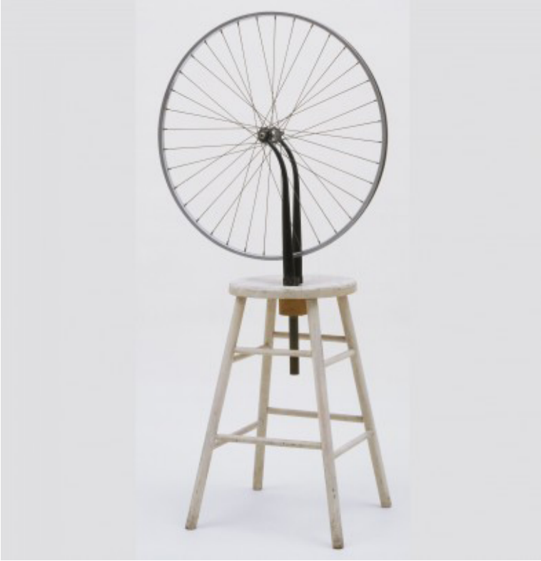
Illustrasie 5: Bicycle Wheel – Fietswiel (1951; derde weergawe) Marcel Duchamp (Publieke Domein)

bestaan nie meer nie, en was alreeds 40 jaar vroeër gemaak, in 1913.