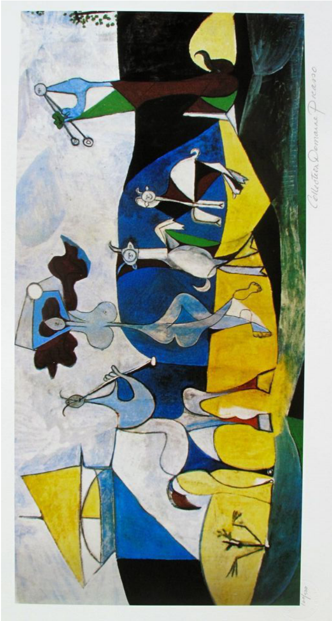
Illustrasie 7: La Joie de Vivre – Die vreugde van die lewe (1946) Pablo Picasso (Publieke Domein)