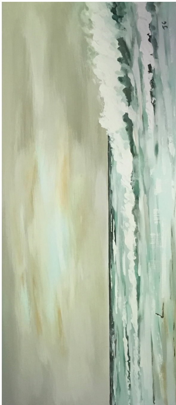
Illustrasie 17: Gety (2023) Johan Cilliers