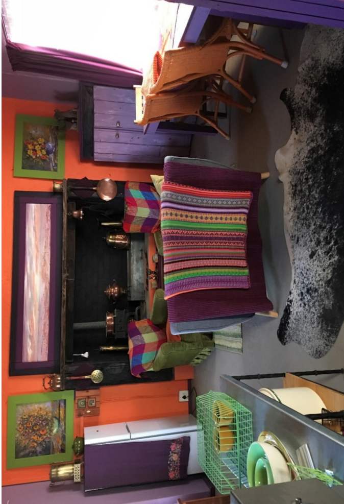
Illustrasie 13: Kombers (2019) Elna Cilliers