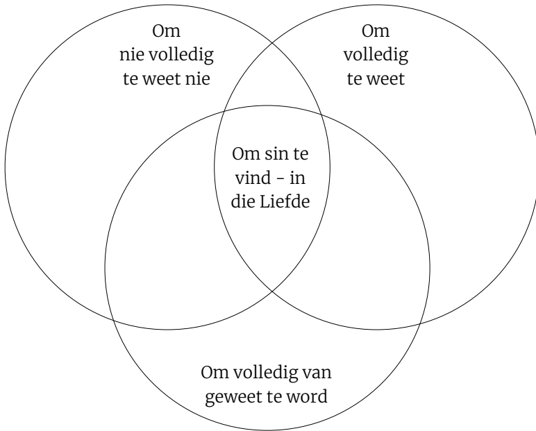
Illustrasie 16: Integrasie: Om sin te vind in die Liefde

Sou ons daardie oorvleueling van ruimtes “hemel” kon noem? Of meer nog: die nuwe aarde onder die nuwe hemel? Om (uiteindelik) sin te vind – in die Liefde?