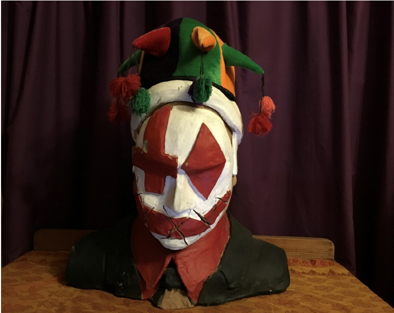
Illustrasie 6: Woorde, stilte, waarheid (2005) Jacques Cilliers

was 'n kop-en-skouer beeld, wat tot vandag toe nog nie al sy geheime prysgegee het nie. 40