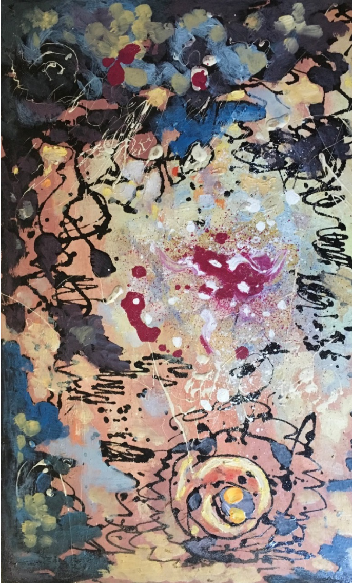
Illustrasie 2: Die skone orde van kosmiese chaos (1995) Johan Cilliers