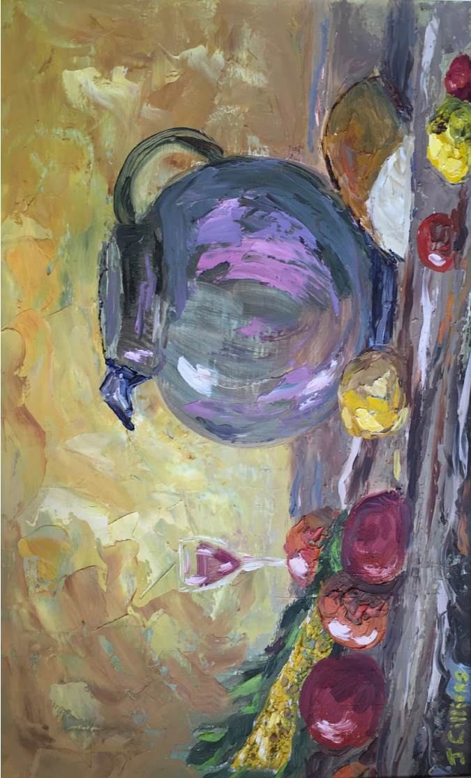
Illustrasie 18: Feesmaal (2016) Johan Cilliers

“En die grootste hiervan is die liefde...”