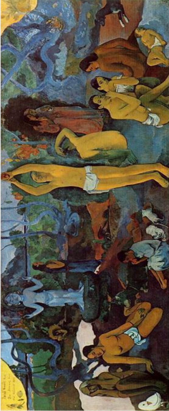
Illustratie 1: Waar korm ons vandaan? Wat (wie) is ons? Waarheen is ons op pad? (1897) Paul Gauguin (Publieke Domein)