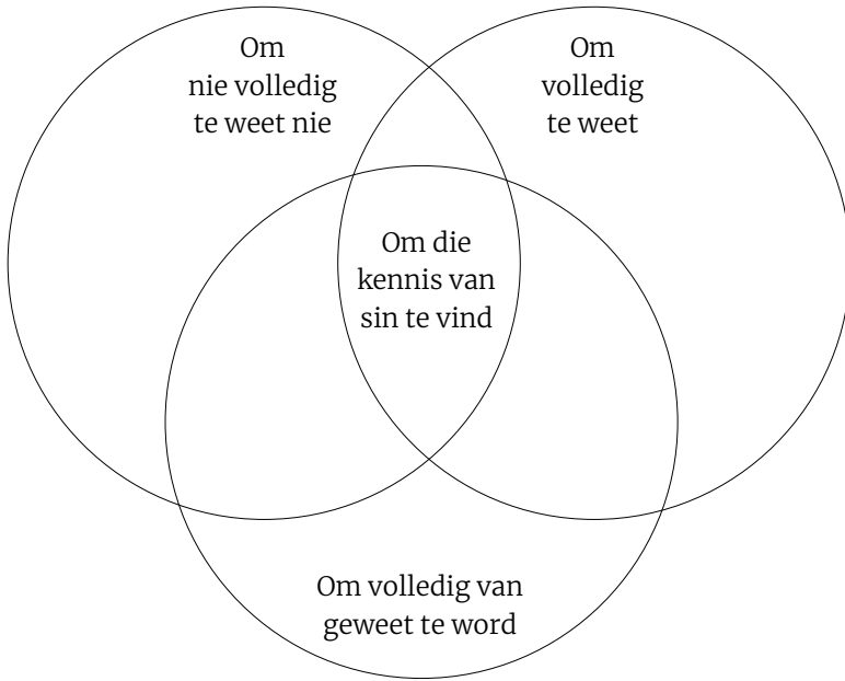
Illustrasie 14: Integrasie: Om die kennis van sin te vind

Laat ons nou, ter wille van verdere verheldering, die volgende hipotese daarstel: Wat sou gebeur as een, of meer, van hierdie vorme van kennis uit die ruimte van integrasie gehaal word, en op sy eie moes staan? As die modus van nie-weet-nie byvoorbeeld beskou sou word as die enigste, losgemaak van die ander? Dan, sou ek aanvoer, sou nihilisme die logiese konsekwensie wees – “laat ons eet en drink, want môre sterf ons”.