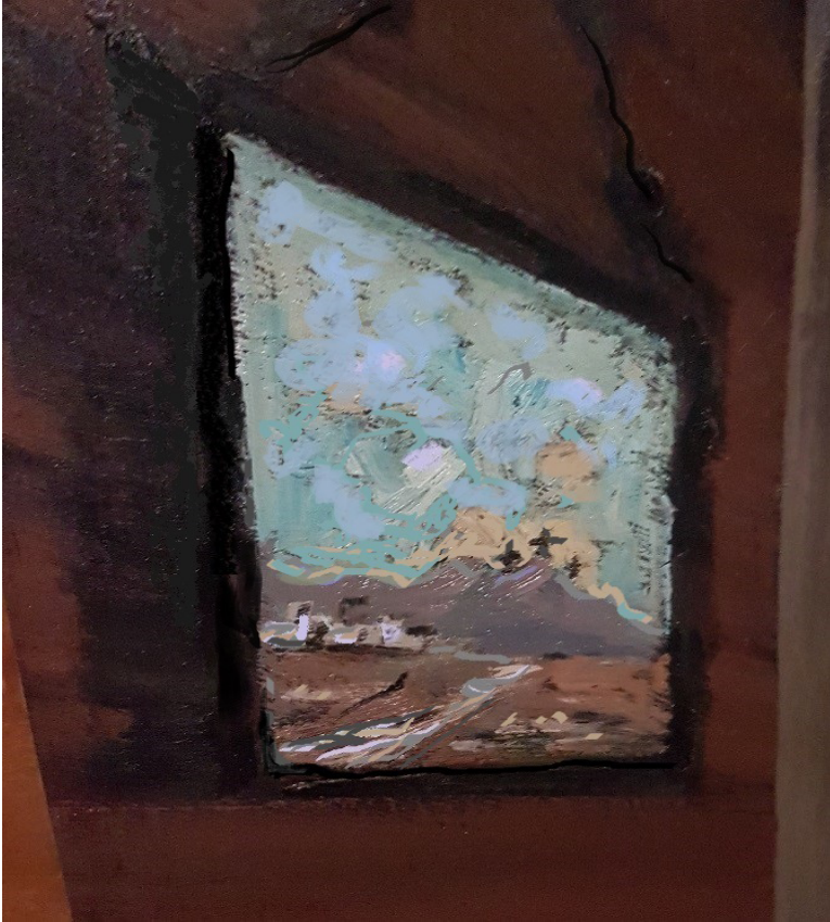
Illustrasie 9: Detail: Ingang tot Lewe (2001) Johan Cilliers

Ek het eenmaal die volgende storie gehoor, wat dalk te goed is om waar te wees – of dalk só goed, dat dit net waar kan wees?