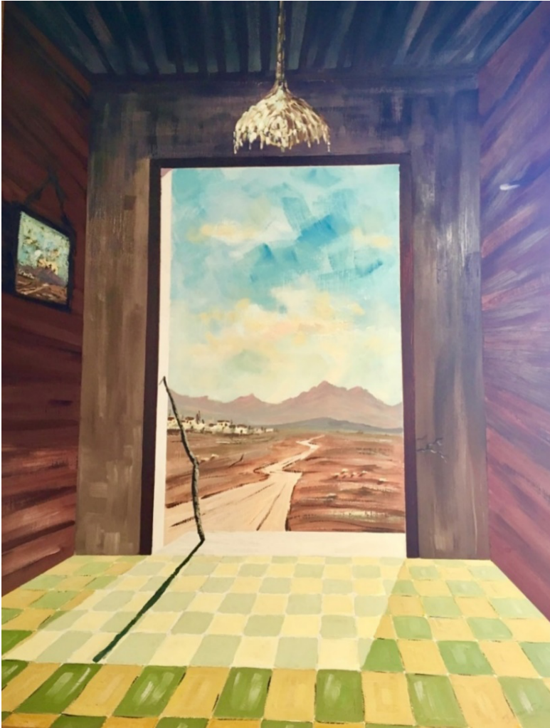
Illustrasie 8: Ingang tot Lewe (2001) Johan Cilliers

in die dorpie met sy aardse, behulpsame mense. Die kamer van waaruit ek kyk, lyk veilig, maar dit herinner tog ook aan 'n kliniese ruimte, wat my verhinder om uitwaarts en voorwaarts te beweeg.