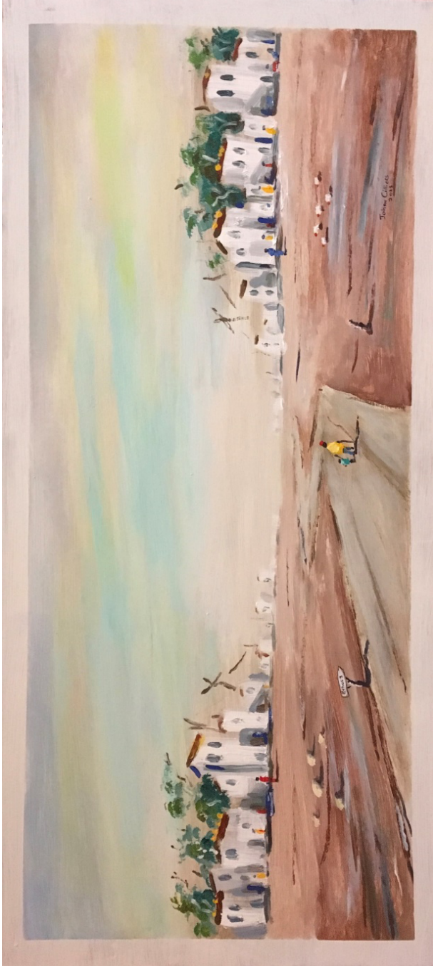
Illustrasie 10: Op weg (2003) Johan Cilliers