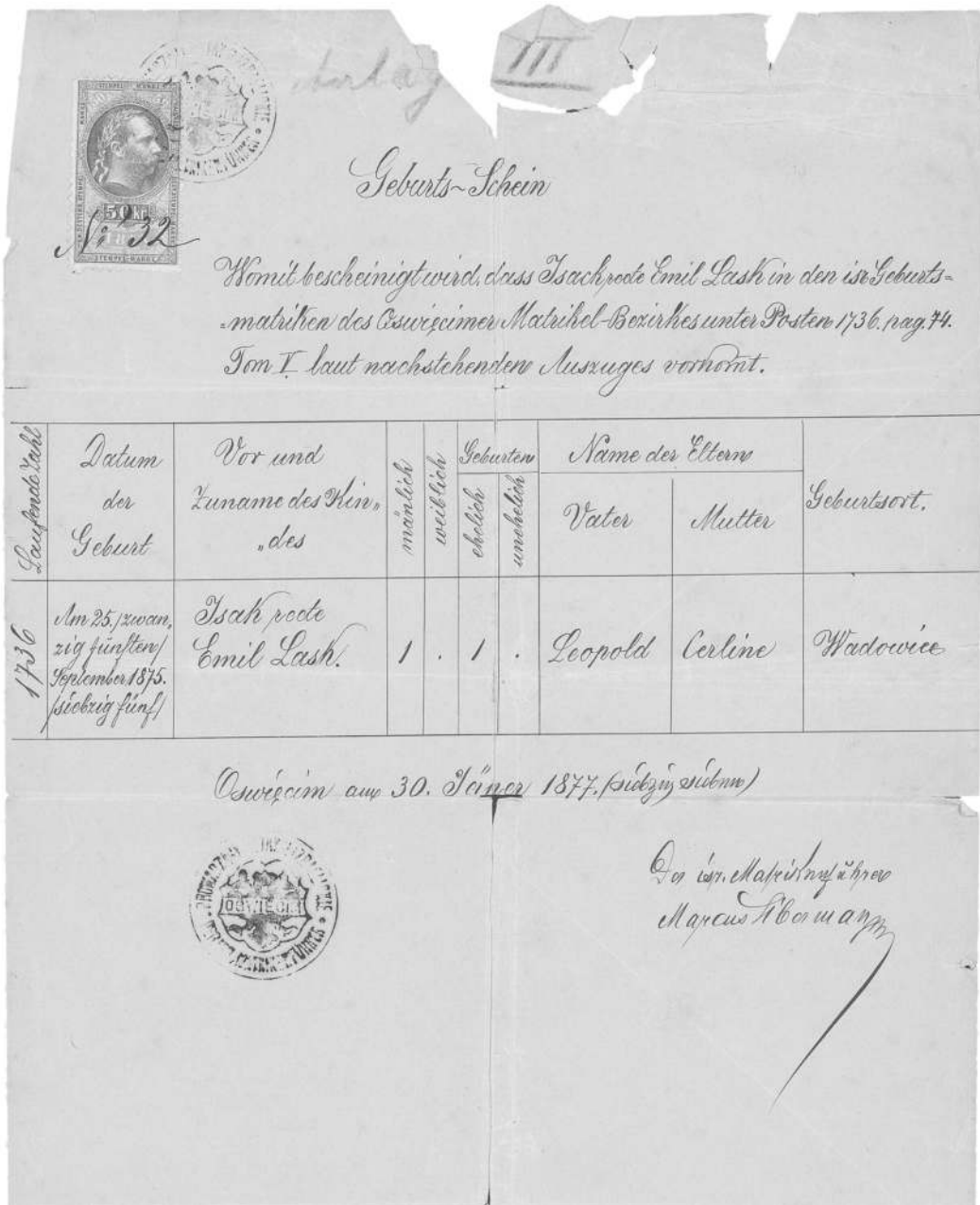
Abbildung 1: Geburtsurkunde Emil Lasks (AdK, Berlin, Berta Lask-Archiv, Nr. 549).