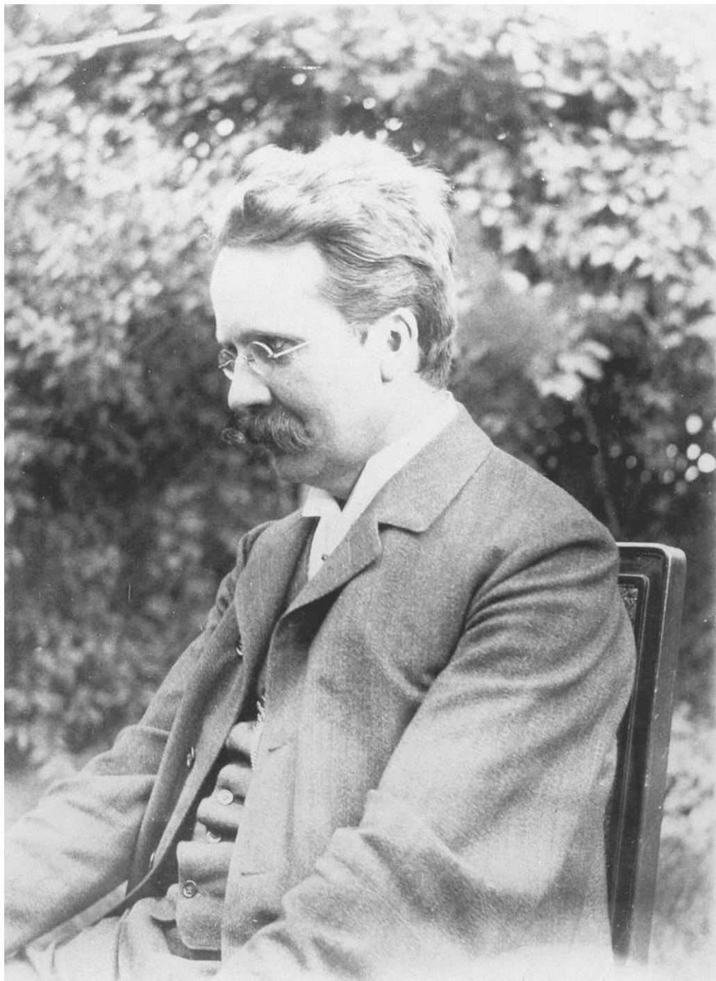
Abbildung 10: Heinrich Rickert im Jahr 1903.