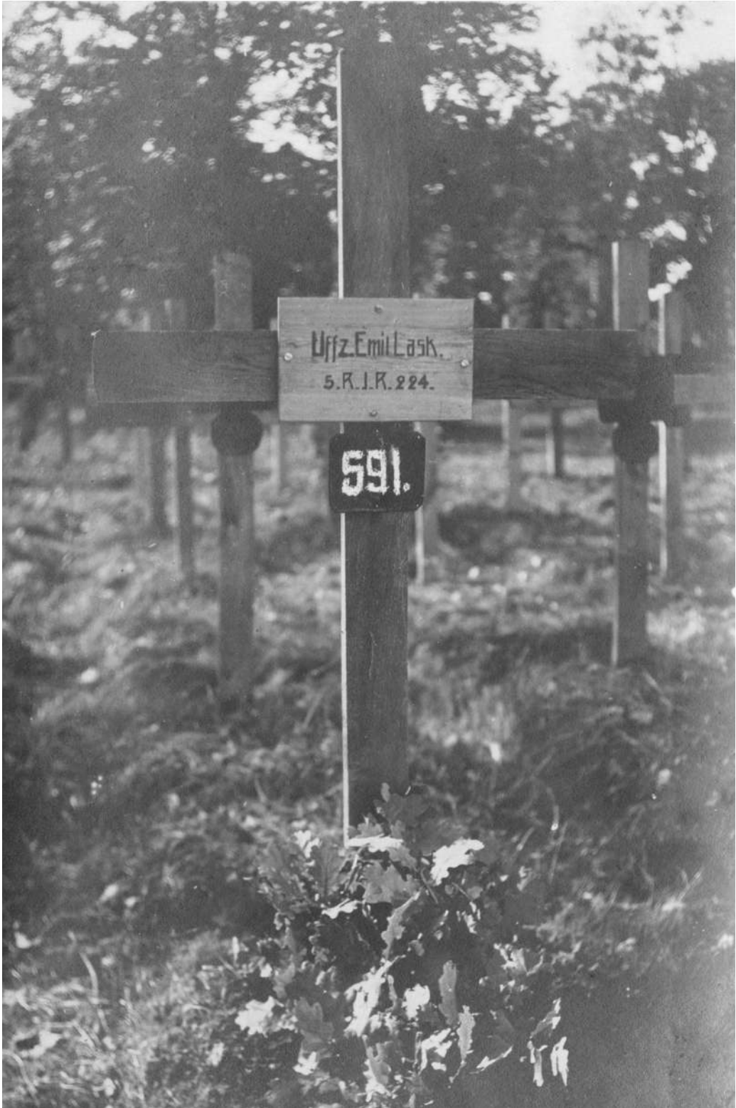
Abbildung 13: Gefallenental Emil Lask, wahrscheinlich in oder nahe Turza-Mała (Galizien).