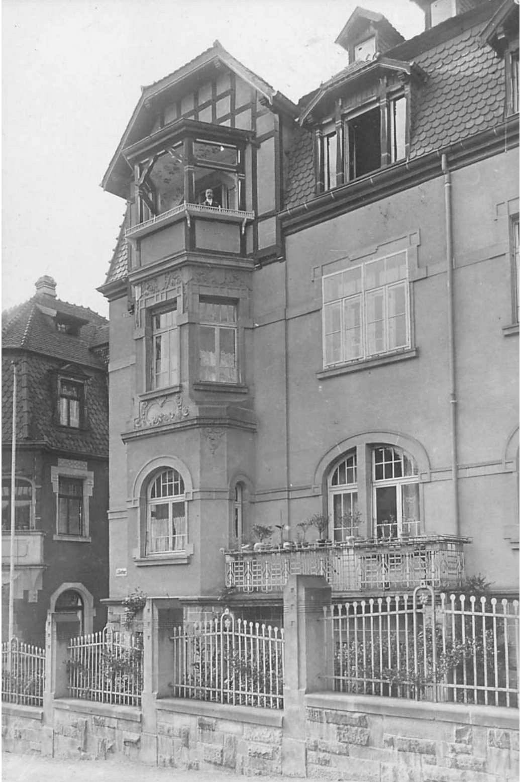
Abbildung 11: Karte von Emil Lask an Heinrich Rickert, 9.8.1910 (Universitätsbibliothek Heidelberg, Nachlass Emil Lask, Heid. Hs. 3820,9;).