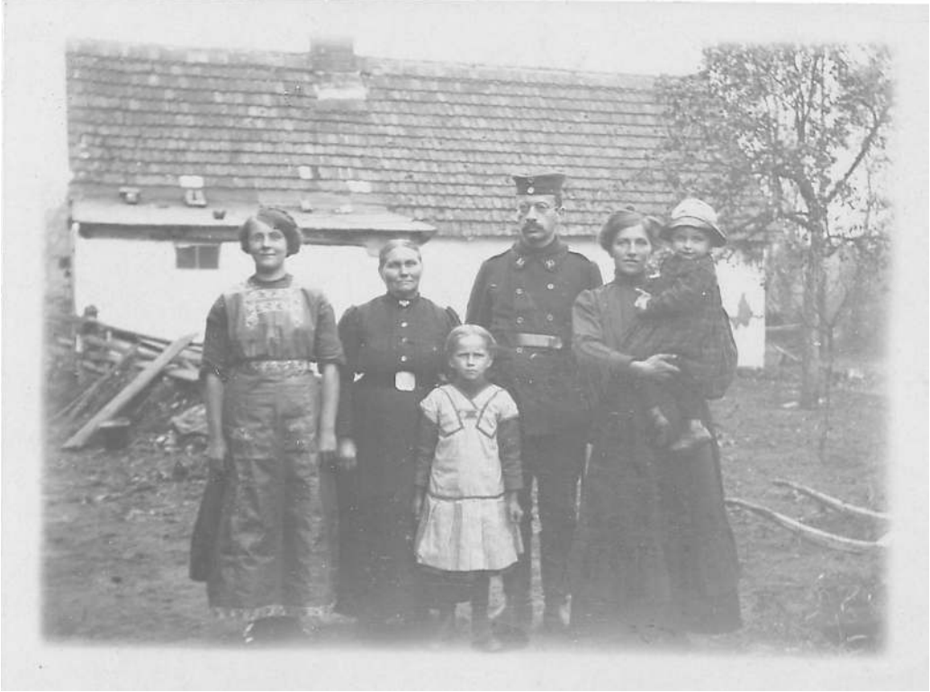
Abbildung 7: Emil Lask als Soldat (Universitätsbibliothek Heidelberg, Nachlass Emil Lask; Heid. Hs. 3820,34; Foto: unbekannt).