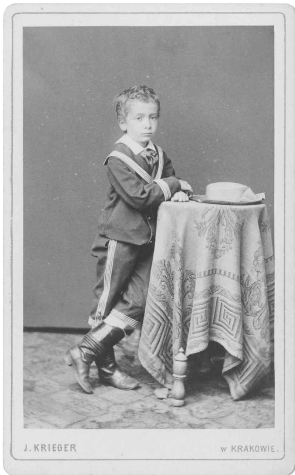
Abbildung 2: Emil Lask als Kind (AdK, Berlin, Berta Lask-Archiv, Nr. 498_001_01).