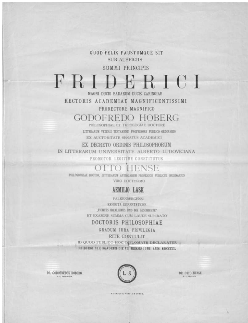
Abbildung 4: Doktorurkunde, 8. Juni 1902 (Familienarchiv Lask).