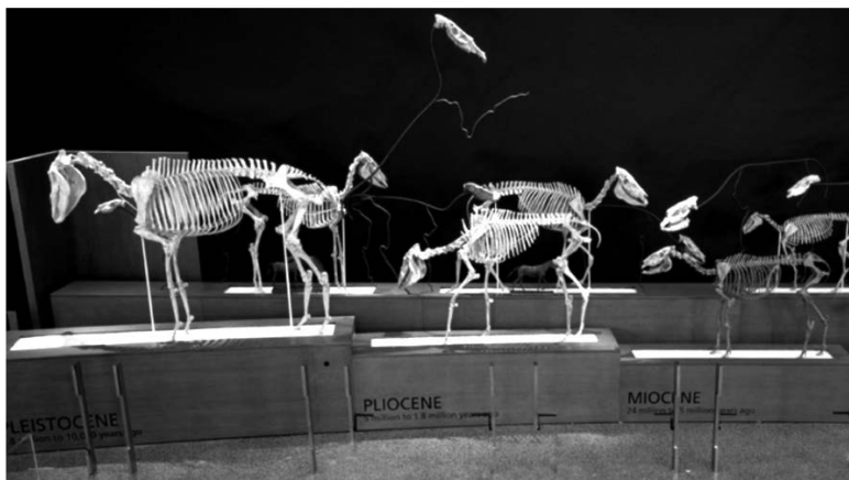
Abb. 1: American Museum of Natural History 2021: Evolution of Horses. Part of Hall of Advanced Mammals https://www.amnh.org/exhibitions/permanent/advanced-mammals/evolution-of-horses

die geläufigen Lehrmeinungen spiegeln. Beispielhaft sei hier auf die Ausstellung zur Geschichte der Pferdefossilien im Naturhistorischen Museum in New York verwiesen, mit der sich Latour (2014) befasst. Er zeigt hier plastisch – für den vorliegenden Fall exemplarisch und an einem aktuellen Beispiel nachvollziehbar – die zuvor beschriebene Verwobenheit von Erkenntnisprozess und Ausstellung auf.