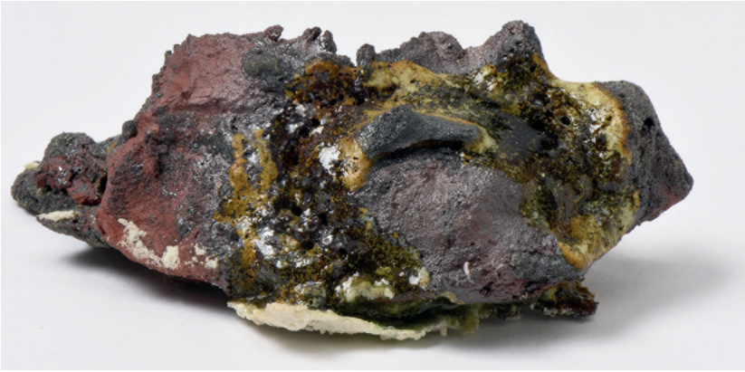
Fig. 1. Silvia Noronha, The Future of Stones — Speculation on Contaminated Matter , 2017 (Soil samples from Mariana dam disaster after simulation of the rock formation process, 5 x 7 x 4.5 cm).