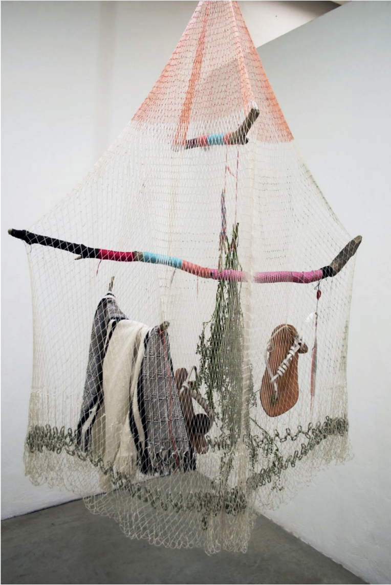
Fig. 5: Carolina Caycedo, Cosmotarraya Yuma (2016) Instalación Entre Caníbales, Instituto de Visión, Bogotá.