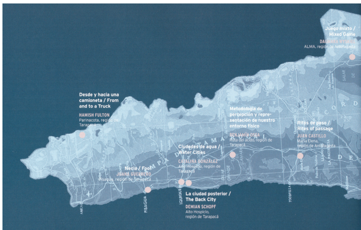
Fig. 1. Fragmento del mapa en Movimientos de Tierra .