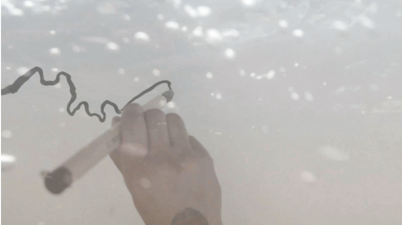
Fig. 3: Carolina Caycedo, Land of Friends (2014) 1 canal HD video, 38 min.