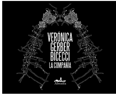
Fig. 2. Portada de La compañía (Verónica Gerber Bicecci, 2019).

Esta imagen que inaugura la lectura sintetiza la labor arqueológica que asume la narradora/fotógrafa, que irá desempolvando las capas históricas del desierto, rescatando de la tierra los testimonios de vida. De esta manera, Gerber reconstruye y redispone el discurso del poder que legitimó el proyecto exterminador y ecocida de la mina, a la vez que recupera las voces disidentes y silenciadas que encuentran un eco en la historia del paisaje. Las enfermedades y deformaciones de los cuerpos que formaban parte del ecosistema de Nuevo Mercurio hallan su origen y espejo en los sedimentos terrestres y acuáticos que testifican la materialidad tóxica de un sistema de violencia y aniquilamiento de la vida.