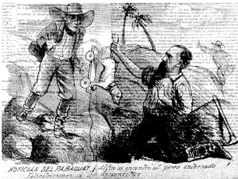
Fig. 1. Mansilla y el perro enterrado ( El Mosquito , 12 de mayo de 1878).

frente a la barbarie americana. Su viaje por el Paraguay, como otras de sus aventuras, no constituye una actividad legitimada por el ojo público, sino que es cuestionada y ridiculizada. El pertenecer a una familia rosista y su accionar irreverente ante las autoridades militares y políticas lo condenan antes de que pruebe la existencia o no del oro en el Paraguay. El 12 de mayo de 1878, en el periódico satírico El Mosquito , se ríen de la búsqueda de Mansilla e interpretan literalmente la expresión “el perro enterrado” que el autor suele emplear en sus cartas para referirse al oro (Stein 1878: s. p., fig. 1). Se ve a Mansilla extrayendo de la tierra en vez del mineral tan codiciado un perrito de juguete.