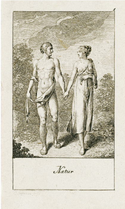
Abb. 1: Daniel Nikolaus Chodowiecki: Natürliche und affectierte Handlungen des Lebens (1780). Folge II/1: »Natur«.