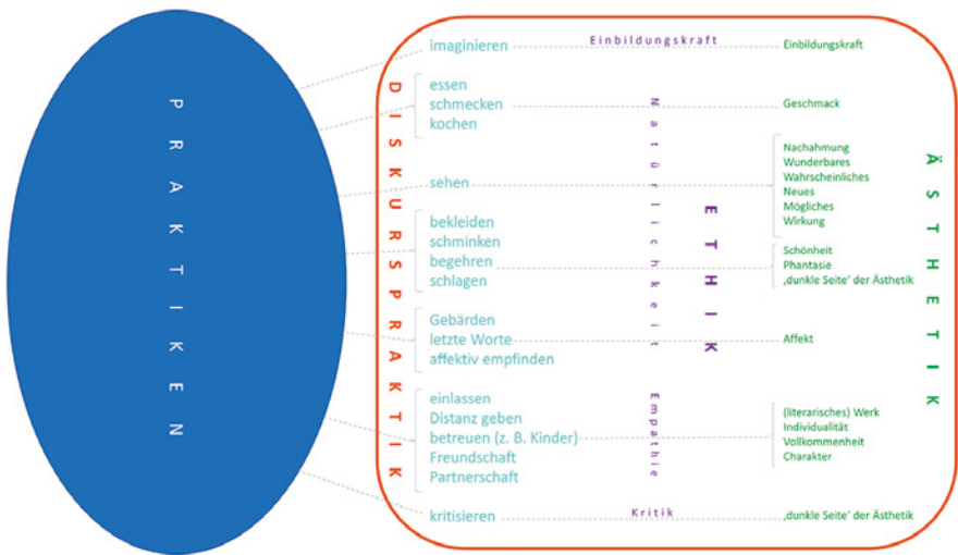
Abb. 6: Schematische Darstellung der Systematik

Bodmer entwickelt die in seinen poetologischen, kritischen und moralischen Schriften zentralen ästhetischen Begriffe und Theoreme in einem Diskurs, der sich am treffendsten als Diskurspraktik beschreiben lässt, da es sich um einen referenziell ebenso wie performativ auf Praktiken bezogenen Diskurs handelt. Diese charakteristische Art und Weise der ästhetischen Begriffs- und Theoriebildung lässt sich in Form einer Graphik darstellen (Abb. 6).