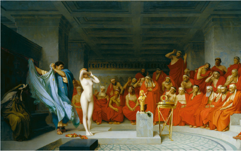
Abb. 3: Jean Léon Gérôme: Phryne vor den Richtern (1861).

gehens ist, zeigt die Metapher von Phrynes Schönheit, die »in voller Blüthe hervor leuchtete«, wo mit der Blüthe »als Symbol des weibl. Geschlechts« 167 ein unverhohlen sexuell konnotiertes Bild evoziert wird.