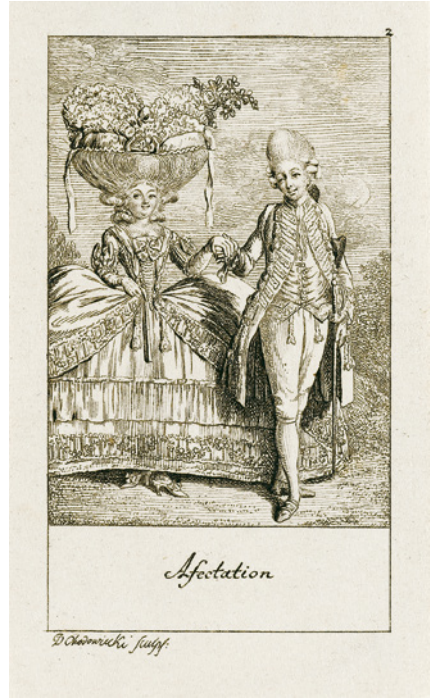
Abb. 2: Daniel Nikolaus Chodowiecki: Natürliche und affectierte Handlungen des Lebens (1780). Folge II/2. »Affectation«.

Nikolaus Chodowieckis 1779 und 1780 erschienener Bilderfolge Natürliche und affectierte Handlungen des Lebens ablesen. Die beiden Staffeln dieser Bilderserie, die in zwei aufeinanderfolgenden Jahrgängen des Goettinger Taschen Calenders erschienen und dort von dessen Herausgeber Georg Christoph Lichtenberg auch kommentiert wurden, 154 bestehen aus jeweils zwölf antithetischen Bildpaaren, die Praktiken des alltäglichen Lebens darstellen, wobei jeweils eine gute, natürliche Spielform von einer schlechten, unnatürlichen Spielform der Praktik unterschieden wird. Die erste Folge der Natürlichen und affectierten Handlungen des Lebens eröffnet Chodowiecki dabei mit einem programmatischen Bildpaar (Abb. 1 u. 2), das die Logik der gesamten Bilderserie verdeutlichen soll – also die