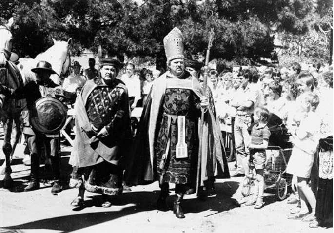
Abb. 5: Stadtfest zum tausendjährigen Jubiläum der Verleihung der Markt-, Münz- und Zollrechte; Marktbild zum »Bischofszug«, 17. Juni 1989.

Im Juni 1989 beging Halberstadt das tausendjährige Jubiläum der Verleihung der Markt-, Münz- und Zollrechte im Jahr 989. Höhepunkt der aufwendig gestalteten Festwoche war, neben verschiedenen Kulturveranstaltungen, der Auszeichnung verdienstlicher Bürger und einem breiten gastronomischen Angebot mit Volksfestcharakter, die Nachstellung von sechs historischen Episoden in sogenannten Marktbildern, die ausgewählte Facetten der Stadtgeschichte repräsentierten. Gegenstand der mit in der gesamten DDR gecasteten Schaustellern und Laienschauspielern besetzten sowie mit Pferden inszenierten Historienbilder waren die Verleihung der Marktrechte durch Otto III. 989, der »Halber-