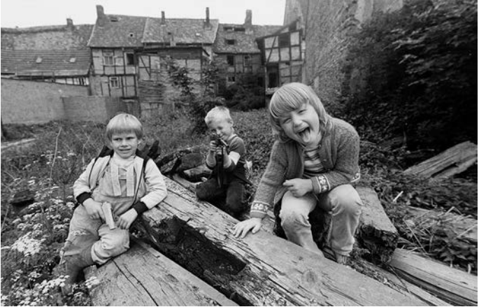
Abb. 6: Kinder spielen im Hinterhof von Baken- und Judenstraße, dem vormaligen Standort der Synagoge, 1987.

Im Jahr 1992 führten zwei Halberstädter Geschichtsstudentinnen unter Schülern ihrer Stadt eine Umfrage durch, mit deren Hilfe sie deren Kenntnisse zur jüdischen Geschichte erheben wollten. Damit waren die beiden Teil einer ganzen Reihe von Initiativen, die erkannt hatten, dass die jüdische Vergangenheit Halberstadts während vierzig Jahren DDR sträflich vernachlässigt worden war, und denen es ein Bedürfnis war, die neu gewonnene Freiheit von 1989/90 dazu zu nutzen, solcherart Fragen künftig uneingeschränkt nachzugehen. Das Ergebnis ihrer Befragung unter insgesamt 142 Schülern der Klassenstufen acht bis zwölf (14 bis 19 Jahre), bestehend aus sechs Fragen, war allerdings frappierend. 49 Prozent vermochten es nicht, überhaupt eine