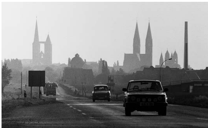
Abb. 1: Die Silhouette Halberstadts aus nordöstlicher Richtung, Juli 1989.

Wer Anfang des 20. Jahrhunderts das malerisch im nördlichen Harzvorland gelegene Halberstadt besuchte, dürfte zu diesem Zweck in nicht wenigen Fällen den erstmals 1905 verlegten Reiseführer Halberstadt in Wort und Bild zur Hand genommen haben. Das Büchlein begleitete den Besucher auf einem imaginierten Stadtrundgang, der am damals noch vor den Toren der Stadt gelegenen Bahnhof begann und sodann zu den Sehenswürdigkeiten Halberstadts führte. Dazu zählten in erster Linie beeindruckende Sakralbauten wie der gotische Dom, die romanische Liebfrauenkirche und die das markante Stadtbild komplettierende Martini-kirche. Mehr noch war Halberstadt aber berühmt für seine einige Hundert Gebäude zählende historische Fachwerk-