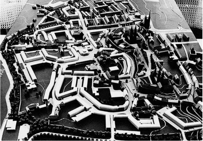
Abb. 4: Modell des avisierten Umbaus der Halberstädter Altstadt (1984); der ehemalige Rosenwinkel ist durch komplexen Wohnungsbau überbaut (Bildmitte unten).