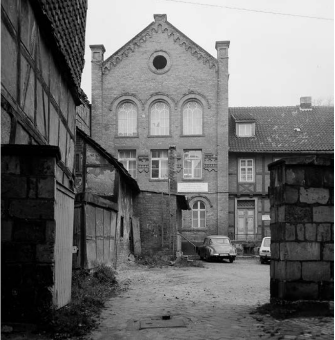
Abb. 3: Die ehemalige Klaussynagoge im Rosenwinkel 18 zur Zeit ihrer Nutzung durch den VEB Pinselfertigung Halberstadt, nach 1979.