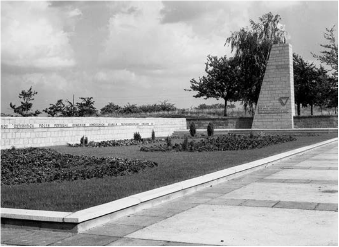
Abb. 2: Der Gedenk- und Appellplatz der Gedenkstätte Langenstein-Zwieberge nach seiner Umgestaltung 1968.

Im Oktober 1987 besuchten Jitzchak und Rafael Auerbach, die Söhne des letzten Rabbiners der Jüdischen Gemeinde, Hirsch Benjamin Auerbach, Halberstadt. Auf ihrem Rundgang durch die Altstadt nahmen sie auch den ehemaligen Standort der Synagoge in Augenschein, der ihr Vater von 1933 bis 1938 vorgestanden hatte. Die Gemeinde hatte sie 1939 im Gefolge des Novemberpogroms bis auf das Fundament abtragen müssen. Bald fünfzig Jahre nach diesem Gewaltakt präsentierte sich das im Hinterhof von Baken- und Judenstraße gelegene Areal in gleichermaßen verwun-