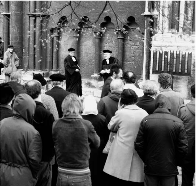
Abb. 7: Einweihung des Mahnmals vor dem Dom, 8. April 1982. In der Bildmitte Landesbischof Werner Krusche bei seiner Ansprache.

Am 8. April 1982 kam es auf dem Halberstädter Domplatz zu einer außergewöhnlichen Veranstaltung. Vor dem Westportal des Doms, dort, wo sich vier Jahrzehnte zuvor alle noch verbliebenen Halberstädter Juden unter sechzig Jahren zu ihrer Deportation hatten finden müssen, wurde an diesem Tag – Gründonnerstag – ein Mahnmal eingeweiht, das der jüdischen Bürger der Stadt und ihrer