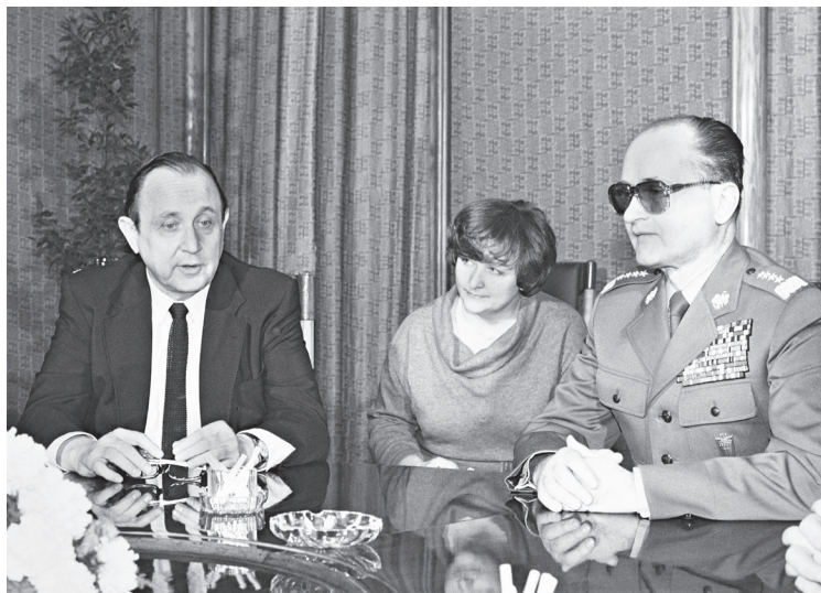
Wojciech Jaruzelski (rechts) empfängt Hans-Dietrich Genscher (links) zu einem Gespräch in Warschau, 20. März 1981.

gerade einem deutschen Außenminister das so sagen zu müssen. [...] Ich bin der Überzeugung, dass unsere Haltung in diesen für Polen sehr schwierigen Monaten nicht nur der Stabilisierung der Lage dient, sondern darüber hinaus vielleicht sozusagen den Schlussstein unter das setzt, was wir uns alle vorgenommen haben, nämlich die Versöhnung zwischen Deutschen und Polen. [...] Sie wissen, ich bin ein sehr realistischer und nüchterner Mensch. Aber wenn ich Ihnen sage, dass ich nie so innerlich angerührt von einer Reise zurückgekommen bin, dann nehmen Sie mir das bitte ab, dass ich heute noch gefühlsmäßig tief berührt bin von der Art, wie man mir dort gegenübergetreten ist.« 8