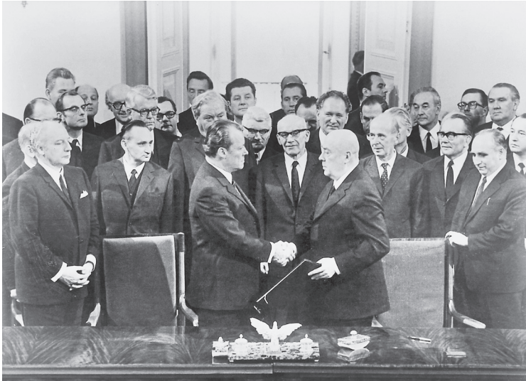
Nach der Unterzeichnung des Warschauer Vertrags geben sich Willy Brandt (links) und Józef Cyrankiewicz (rechts) die Hand, 7. Dezember 1970.

Zusammenhalt der west- und ostdeutschen Bevölkerung gewährleistet, sondern langfristig auch eine gesellschaftliche Liberalisierung in den Staaten des Ostblocks erreicht werden.