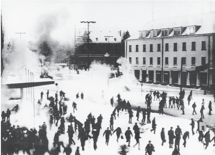
Nach der Verhängung des Kriegsrechts werden Demonstranten in Warschau von der Polizei mit Tränengas auseinandergetrieben, 16. Dezember 1981.

Erneuerung Polens, die bei weiteren Streiks nicht durchführbar sei. Durch Erlass des Staatsrats und per Anordnung durch den Militärrat wurden auf alle wichtigen Posten in Verwaltung und Wirtschaft Militärkommissare berufen. Erst zweieinhalb Jahre später, im Juli 1983, sollte die Regierung Jaruzelski den Kriegszustand wieder aufheben.