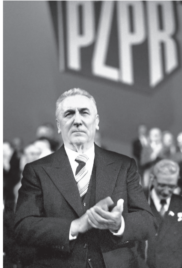
Edward Gierek, Februar 1980.

die kommunistische Partei an der Macht zu halten – mit unabsehbaren Konsequenzen für die angespannten Ost-West-Beziehungen. Um die Ruhe im Land wiederherzustellen, musste Gierek also wenigstens die sozialen Forderungen der Streikenden erfüllen, was allerdings eine umfassende Reform und die schnelle Stabilisierung der Wirtschaft vorausgesetzt hätte. Ein überzeugendes ökonomisches Reformkonzept aber war nicht einmal in Ansätzen erkennbar, zumal eine grundlegende Abkehr von der sozialistischen Planwirtschaft erneut die Systemfrage gestellt hätte.