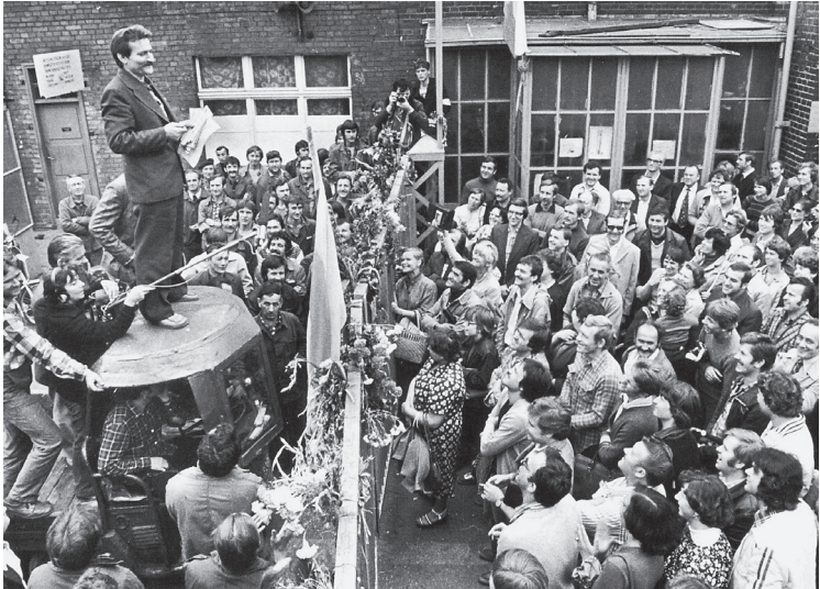
Lech Wałęsa (links) spricht zu streikenden Arbeitern der Danziger Lenin- werft, 1980.

Katalog mit 21 Punkten vorlegte. An erster Stelle stand dabei die Forderung nach Zulassung freier Gewerkschaften, allgemeinem Streikrecht sowie voller Meinungsfreiheit in Wort und Schrift. Die ursprünglich sozialen Proteste erhielten damit eine spezifisch politische Dimension, forderte die Streikbewegung auf diese Weise doch das Macht- und Meinungsmonopol der regierenden Polnischen Vereinigten Arbeiterpartei (PVAP) heraus.