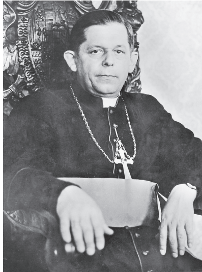
Józef Glemp, 1981.

im westlichen Sinne möglich sei und die Anwendung ihrer Prinzipien hinsichtlich Polens an den Realitäten vorbeiführe. Reform heiße heute vor allem die Wiederherstellung der vollständigen Kontrolle von Staat und Gesellschaft durch die Partei. »Politische Freiheiten seien eine Frage des nächsten Jahrhunderts.« 16