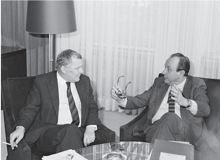
Treffen von Hans-Dietrich Genscher (rechts) mit Mieczysław Rakowski in Bonn, 30. Dezember 1981.

lichen sowjetischen Machtbereich – weil dies nach Lage der Dinge unmöglich ist –, sondern um die Erhaltung der wesentlichen Elemente der polnischen Erneuerung, die die vorgegebenen politischen Rahmenbedingungen nicht sprengen.« 13