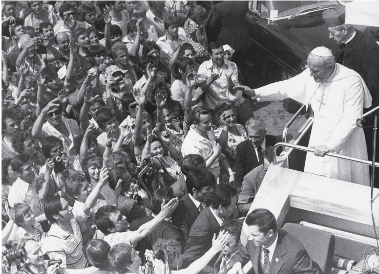
Fahrt von Papst Johannes Paul II. durch Warschau während seines Besuchs in Polen, Juni 1979. Rechts hinter dem Papst der polnische Primas Stefan Kardinal Wyszyński.

wahrgenommen. Die erste Reise Johannes Paul II. in sein Heimatland im Juni 1979 demonstrierte eindrucksvoll die Wiederbelebung des polnischen Nationalstolzes, des gesellschaftlichen Zusammengehörigkeitsgefühls und Selbstbewusstseins im Zeichen des Katholizismus. Mehrere hunderttausend Menschen besuchten die zahlreichen Gottesdienste unter freiem Himmel, die der Papst unter anderem auch im ehemaligen Konzentrationslager Auschwitz hielt. Hauptbotschaft der päpstlichen Ansprachen waren das unzerstörbare Band zwischen der römisch-katholischen Kirche und der polnischen Nation, die Forderung nach Respektierung der Menschen- und Freiheitsrechte sowie die Stärkung der geistigen Einheit Europas auf der Grundlage christlicher Werte.