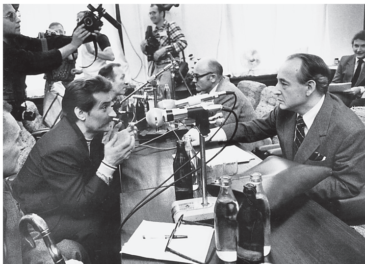
Gespräch zwischen Lech Wałęsa (links) und dem polnischen Stellvertretenden Ministerpräsidenten Mieczysław Jagielski (rechts) in Danzig, August 1980.

auch auf Druck Moskaus abgesetzt und General Wojciech Jaruzelski zum Premierminister ernannt, dem im Oktober zusätzlich das Amt des Verteidigungsministers und des Ersten Sekretärs der PVAP übertragen wurde. Der nun mächtigste Mann im Staate schlug eine gemeinsame »Front der Nationalen Verständigung« unter Beteiligung von Solidarność und katholischer Kirche vor und forderte Wałęsa ultimativ zur Mitarbeit auf. Unverhohlen drohte Jaruzelski mit der Verhängung des Ausnahmezustands, sollte die Gewerkschaft nicht kooperieren. Diese Drohkulisse unterstrichen Manöver der Truppen des Warschauer Paktes an der polnischen Grenze, während das Präsidium der Landeskommission der Solidarność Ende November 1981 in Radom tagte, um über das zwiespältige Angebot zu beraten. In der Nacht vom 12. auf den 13. Dezember 1981 beschloss die Solidarność unter ihrem Vorsitzenden Wałęsa geschlossen in den Generalstreik zu