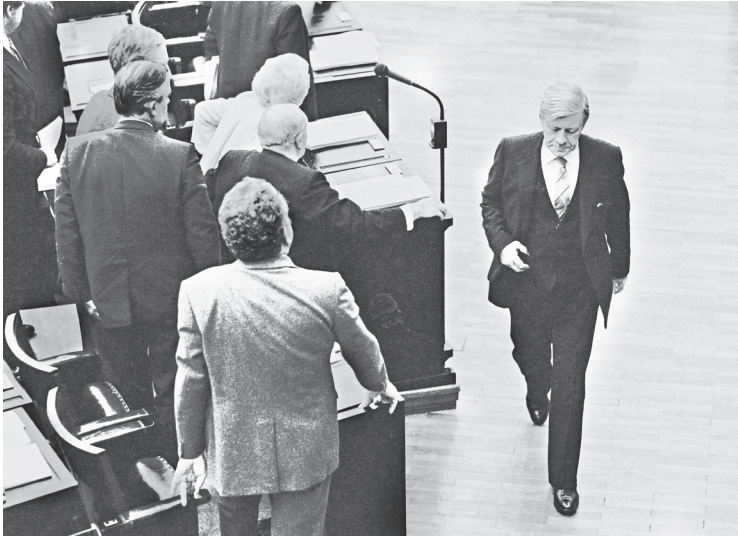
Nach seiner Abwahl als Bundeskanzler verlässt Helmut Schmidt den Plenarsaal des Deutschen Bundestages, 1. Oktober 1982.

zeit« zwischen Ost und West war es für den Entspannungsprozess umso entscheidender, dass mit der KVAE ein multilaterales, blockübergreifendes Kommunikationsforum fortbestand. Es bot Washington und Moskau die Möglichkeit, ohne internationalen Prestigeverlust am Verhandlungstisch zusammenzukommen und ihre rüstungspolitische Sprachlosigkeit zu überwinden.