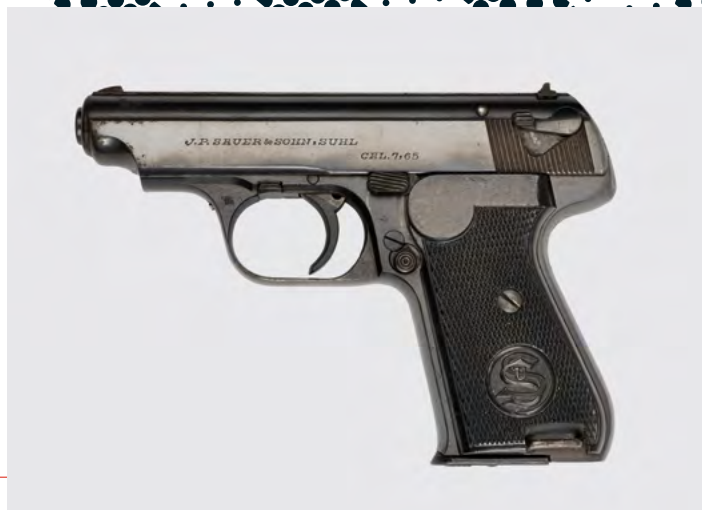
14 Pistool Sauer Model 38 H van het Politie Bataljon Amsterdam, 1942.