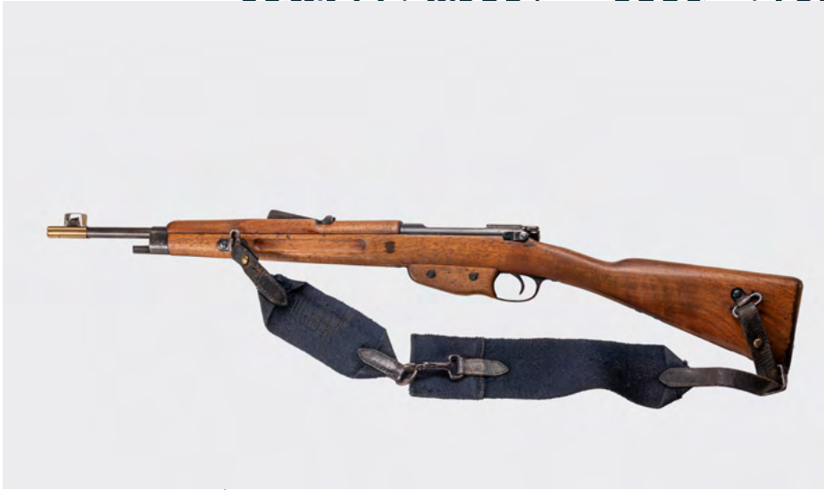
12 Nederlandse Mannlicher karabijn M.95, serienummer 2957W, model karabijn voor de Gemeentepolitie met bajonet, 1936. Inv.nr. 00022400

note van de commissaris bloemen aanbod en de manschappen bier te drinken kregen, zou later worden geconcludeerd dat van een feest sprake was. Dat lijkt een opgeklopt verhaal. Tulp betoonde zich wel trots en sprak hoogdravend van een groot gevaar dat was afgewend. De manschappen hadden ‘het Gezag in den Staat’ verdedigd tegen ‘zielige pionnen in het communistische schaakspel.’ Hij bepleitte maatregelen om te voorkomen dat