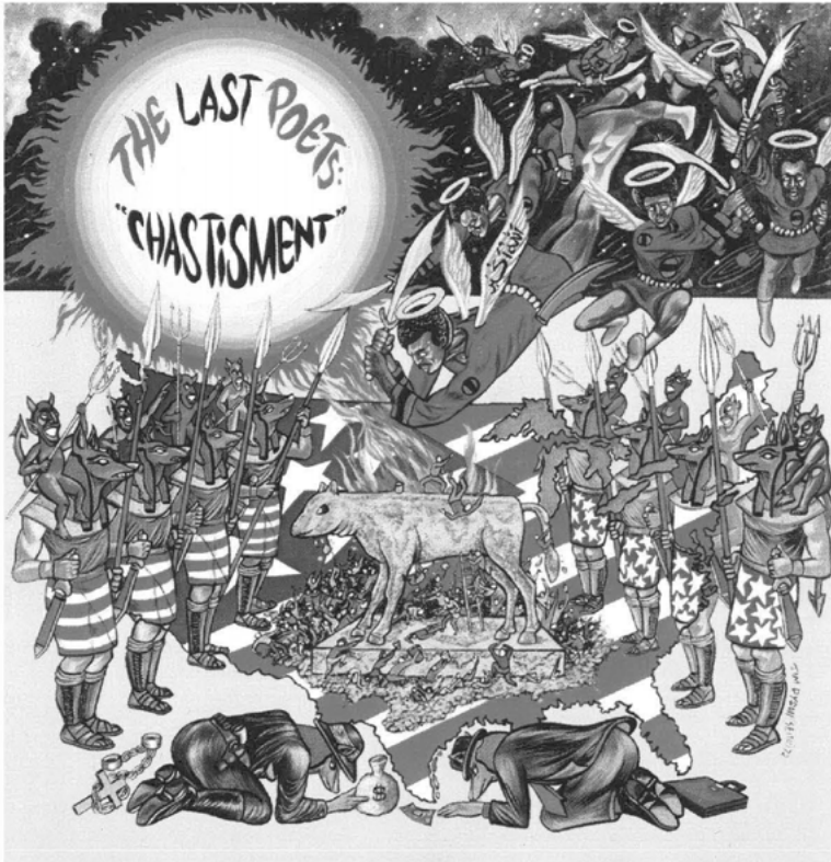
Abbildung 2: The Last Poets, Chastisement

In religiöser Hinsicht sind vor allem die frühen Alben der Last Poets von der Nation of Islam unter Elijah Muhammad geprägt. Dieser Einfluss fällt bereits ins Auge, wenn man eines ihrer auffälligsten und am liebevollsten gestalteten Plattencover in die Hand nimmt, das des programmatisch betitelten Albums Chastisement [sic] aus dem Jahr 1972, welches sich wie eine Siebzigerjahre-Comic-Illustration der Muhammadschen