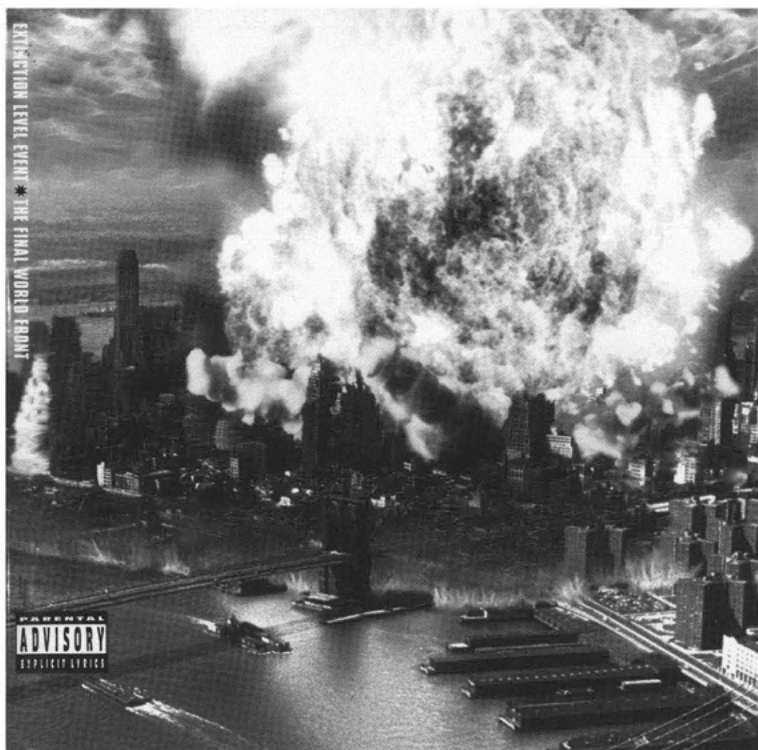
Abbildung 4: Busta Rhymes, Extinction Level Event

Das Thema sollte den Rapper, ein Mitglied der Nation of Gods and Earths, bis zur Jahrtausendwende immer wieder beschäftigen – wie Elijah Muhammad schien auch Busta Rhymes davon überzeugt zu sein, dass mit dem Jahr 2000 eine globale Katastrophe einkehren werde. Doch auch Busta Rhymes hielten die eigenen düsteren Prognosen nicht davon ab, weiter an seiner Zukunft als global player des HipHop zu arbeiten. 1997, auf seiner zweiten Platte When Disaster Strikes , ließ er in ebenso hohem Tonfall wie holpriger Grammatik verkünden: »As we approach the current time frame of 1997, with approximately two and a half years before the year 2000, repeatedly it has been reported that there will be a time soon approaching that a major disaster will be striking all levels of existence« (Busta Rhymes 1997). Ihren stärksten Ausdruck fand diese latente pre-millennial tension jedoch auf Busta Rhymes' letztem Album vor der Jahrtausendwende: auf der Platte Extinction Level Event: The Final