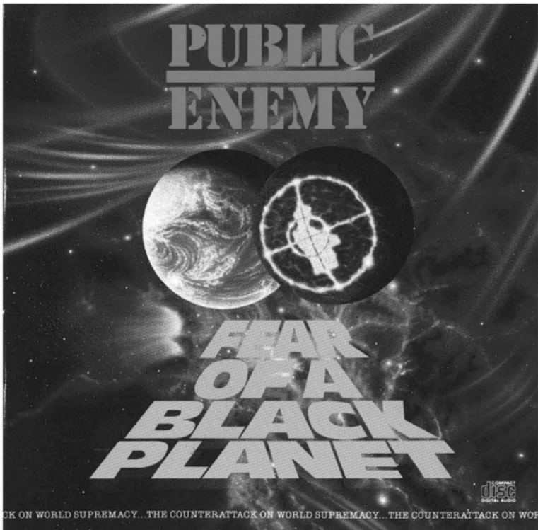
Abbildung 3: Public Enemy, Fear of a Black Planet

der der Gruppe selbst verstehen sich, einer vielzitierten Äußerung ihres Frontmanns und Chefideologen Chuck D (eigentlich Carlton Ridenhour) zufolge, als »CNN of black culture« (Dyson 1993: 17): als alternative Nachrichtensprecher inmitten einer von weißen Mächten dominierten Medienwelt. »False media, we don't need it, do we? It's fake«, rappte die Gruppe auf »Don't Believe the Hype«, und versammelte auf Fear of a Black Planet Rassismen und Anfeindungen, die in US-amerikanischen call radio shows über Public Enemy geäußert worden waren (»Go back to Africa!«), zu einem ebenso aggressiven wie amüsanten Pastiche, dessen Titel mit seiner Zahlensymbolik klar auf die antichristlichen Allianzen der US-amerikanischen Radiostationen verweist: »Incident at 66.6 FM« (Public Enemy 1988; Public Enemy 1990a).